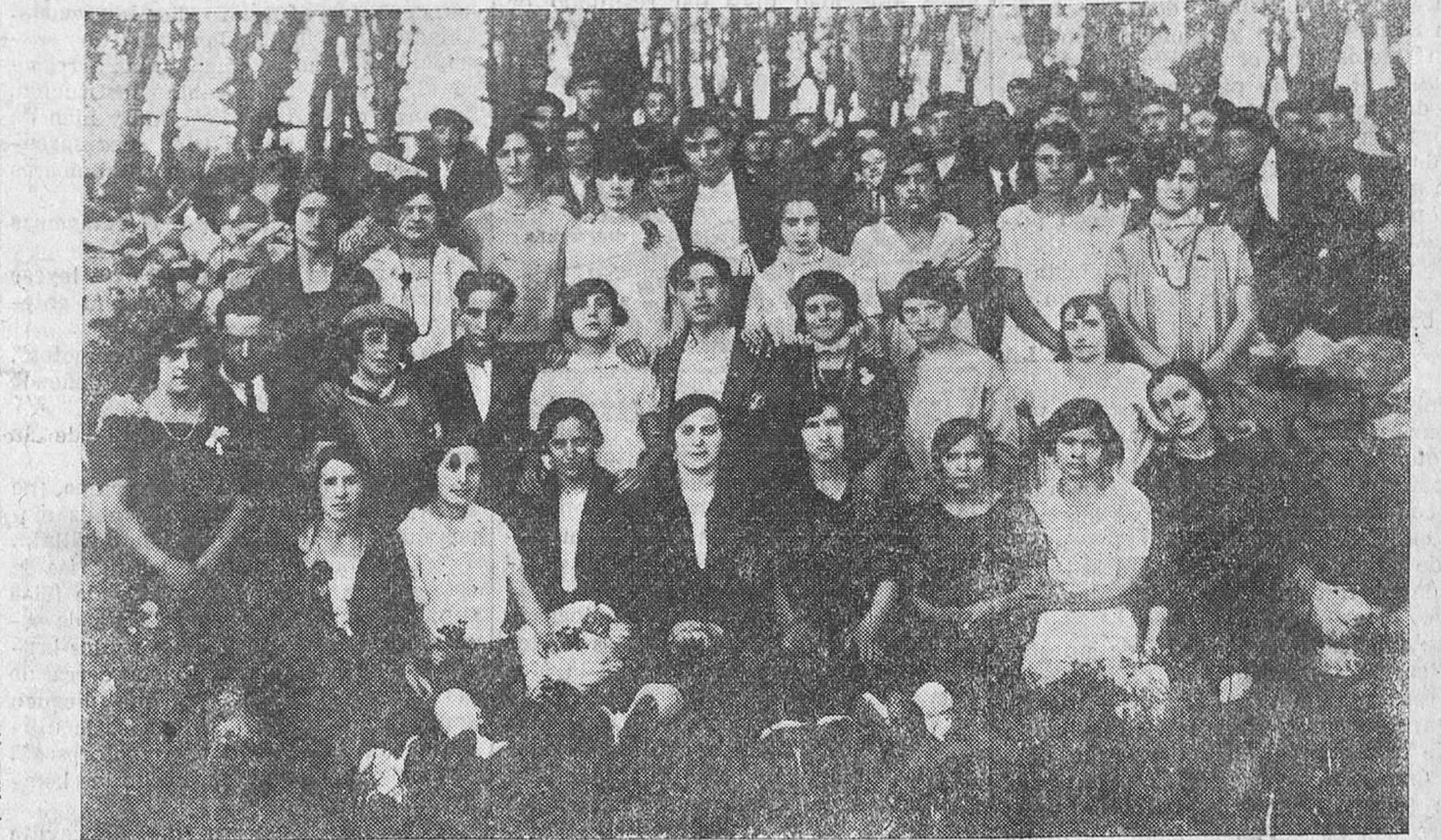
Un grupo de asistentes a la romería de San Pedro, en el que se destacan algunas bellas y simpáticas muchachas.

Es muy posible que en los días en que esté aquí el príncipe vengan a