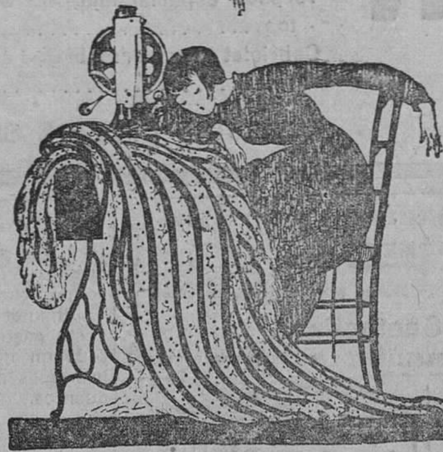
El agotamiento producido por el trabajo es vencido con GLOBEOL.

Para evitar falsificaciones debe rechazarse como ilegítimo todo producto que no lleve en encarnado este sello EL HOMBRE DE LAS TENAZAS .