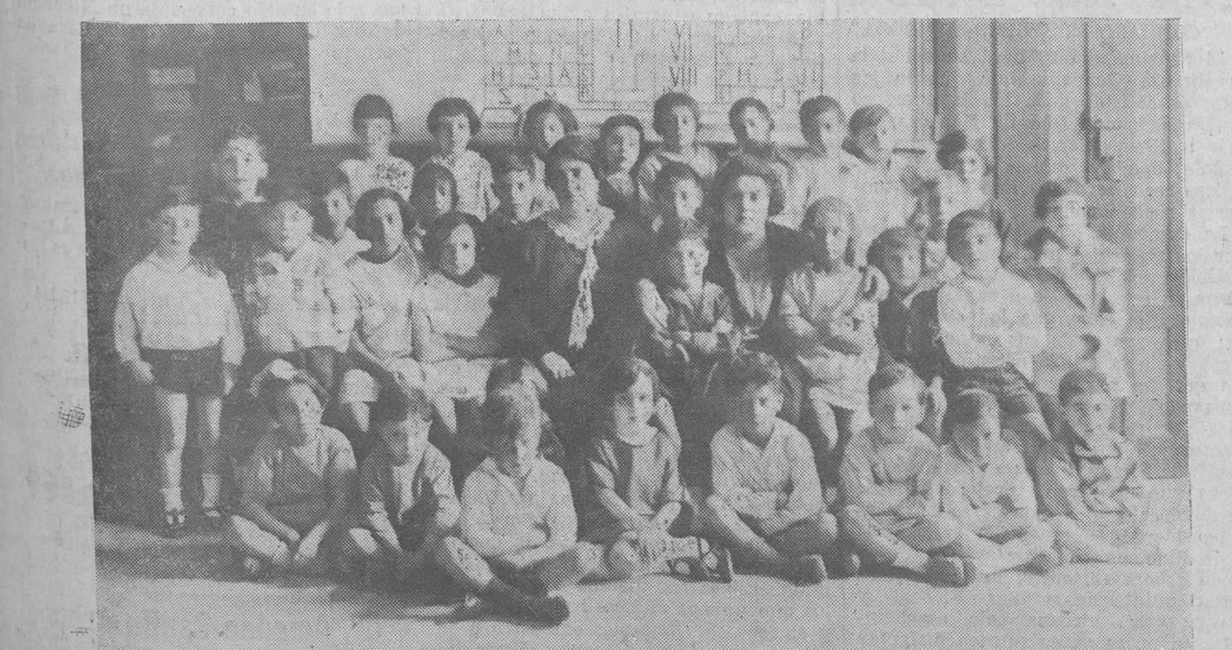
Aplicados niños que se han distinguido en sus estudios en la escuela de párvulos del Centro, con sus profesoras.