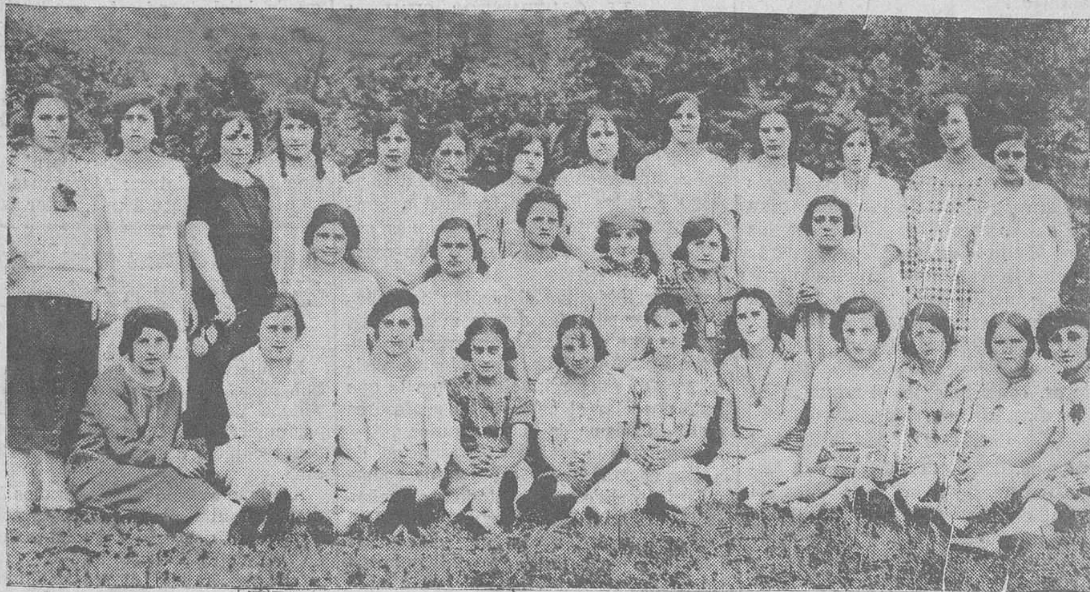
Un grupo de niñas jóvenes que asistieron a la romería del Carmen, en Revilla.

Afirma que los homenajes serán en honor de la oficialidad y de los