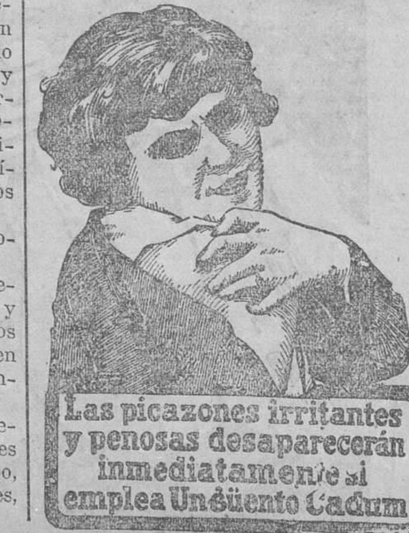
Las picazones irritantes y penosas desaparecerán inmediatamente si emplea Unáguento Cadum

cordándose publicarla también en el Boletín de la Cámara.