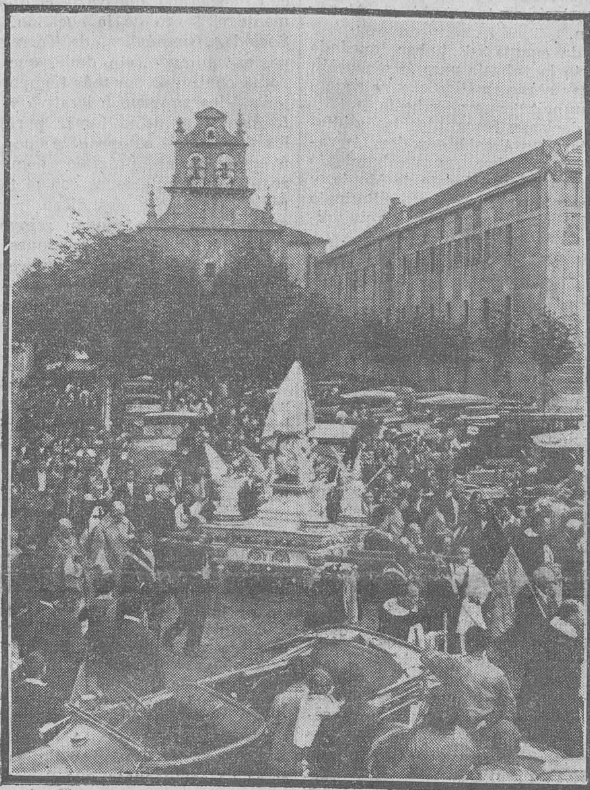
AMPUERO. -- Procesión de la Bien Aparecida.

Reciban los padres de la hermosa niña, y su abuela doña Nemesia, nuestra más cordial felicitación.