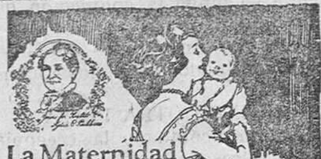
La Maternidad es más gloriosa cuando la madre y el niño están sanos. Las madres convalecientes deben tomar el...