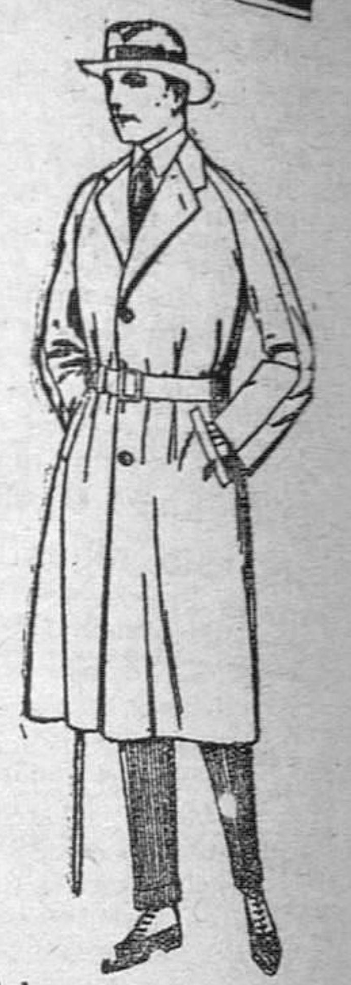
Gabanes de cheviot, cober, melton, gabardina, etc., de pesetas 60 á 180. Grandes existencias en géneros para gabanes á medida.