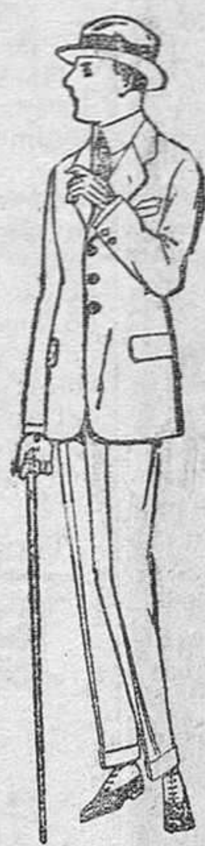
Trajes de lanilla, vicuña ó estambre, para jovencitos de 10 á 14 años, de ptas. 30 á 90. Trajes de dril listado, crudo ó kaki, de ptas. 28 á 40.