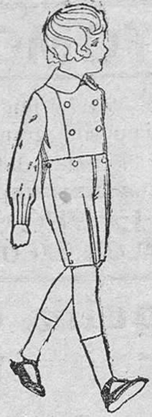
Trajes de vicuña ó estambre azul, para niños de 3 á 7 años, de ptas. 25 á 30. Los mismos de dril liso, de ptas. 10 á 15.

Ropas confeccionadas para Caballero, Señora, Niño y Niña.