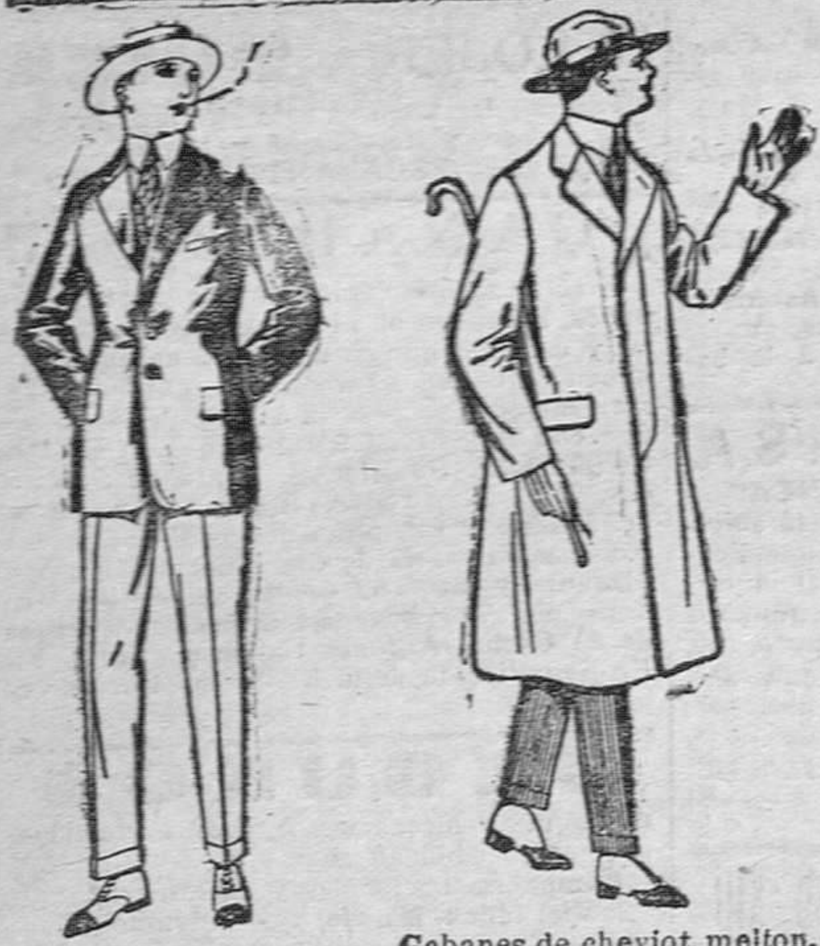
Trajes de alpaca negra ó azul, de ptas. 70 á 95. Americanas de alpaca negra ó azul, de pesetas 40 á 60. Pantalones de dril liso ó listado, de ptas. 9 á 18.

Madrid, Barcelona, Alicante, Almería, Bilbao, Cádiz, Cartagena, Granada, Málaga, Sevilla, Palma de Mallorca, Gijón, Valencia, Valladolid, Zaragoza.