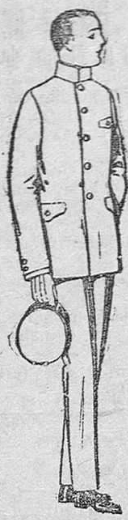
Trajes de vicuña azul ó estambre gris, para grooms de 10 á 15 años, de ptas. 45 á 80. Los mismos con pantalón breeches, de ptas. 47 á 80.