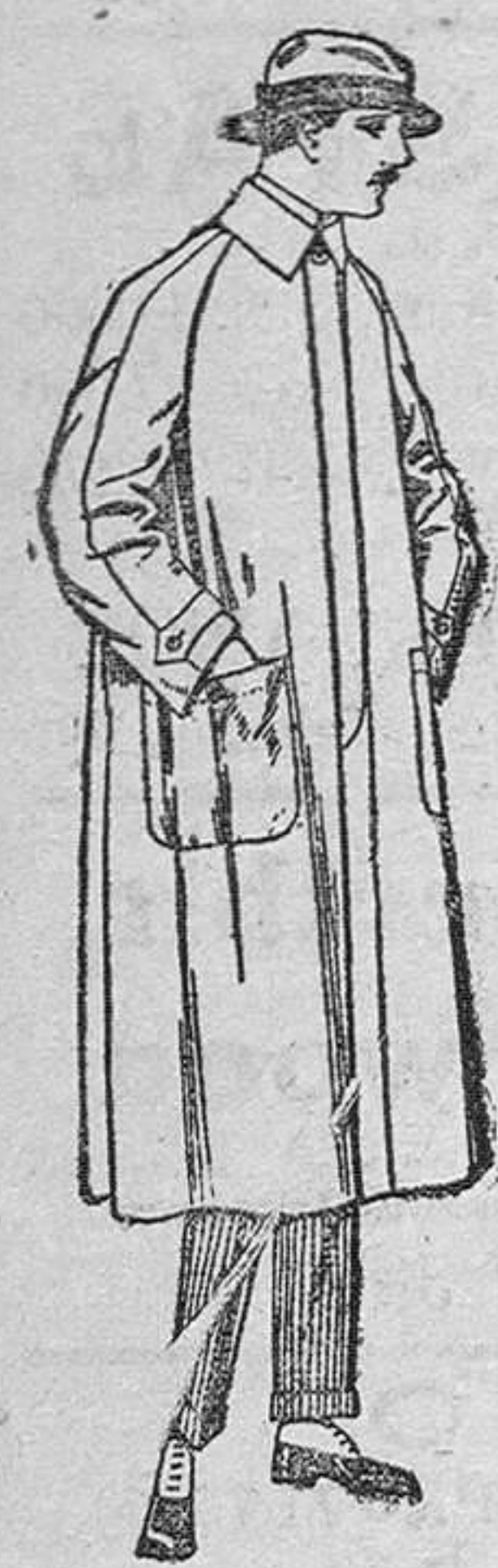
Impermeables forma gaban, rayán, de ptas. 40 á 170. El mismo modelo en caout-chouc, negro, de pesetas 70 á 90.