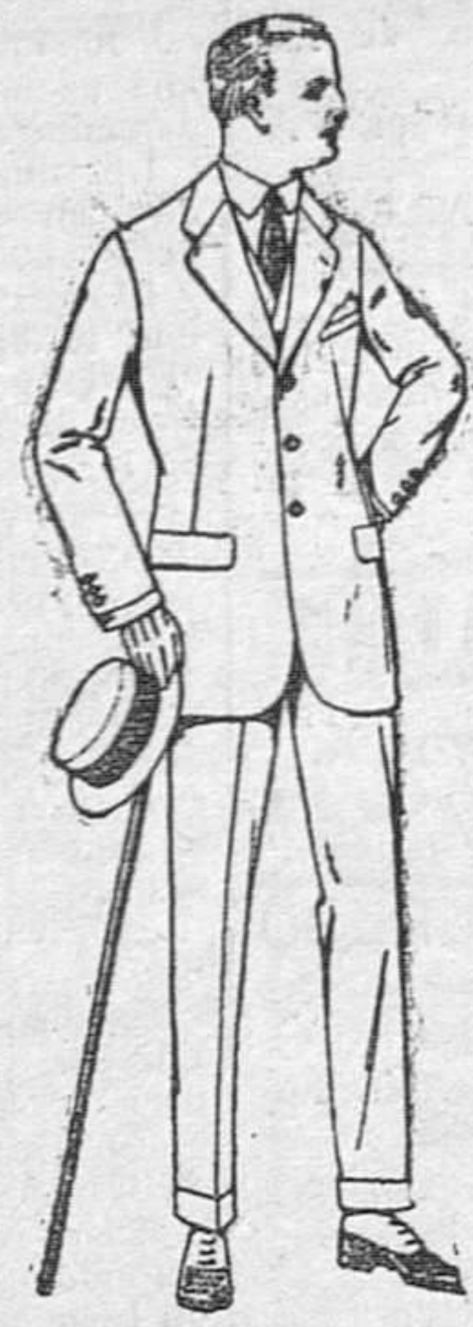
Trajes de lanilla, melton, estambre, vicuña ó jerga, de ptas. 35 á 145. Trajes de dril crudo, kaki ó listado, de ptas. 28 á 60.