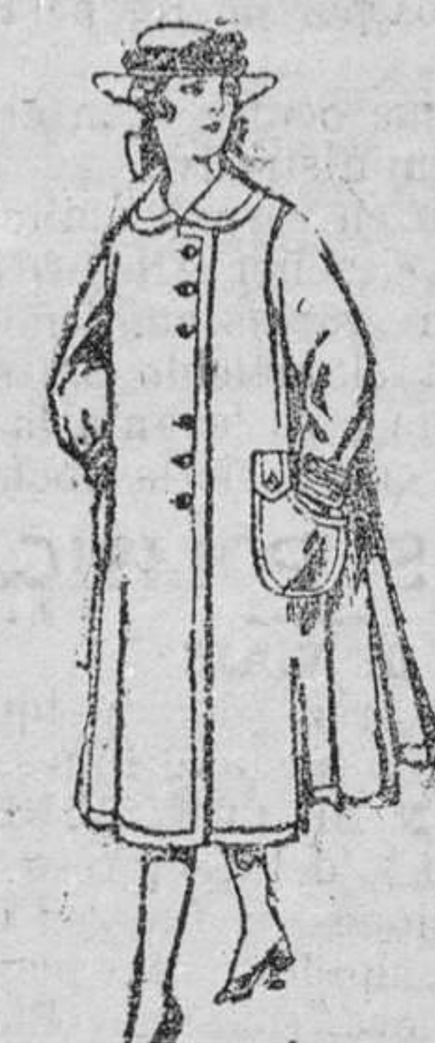
Abrigos de lana para jovencitas de 11 á 15 años. De pesetas 35 á 40.