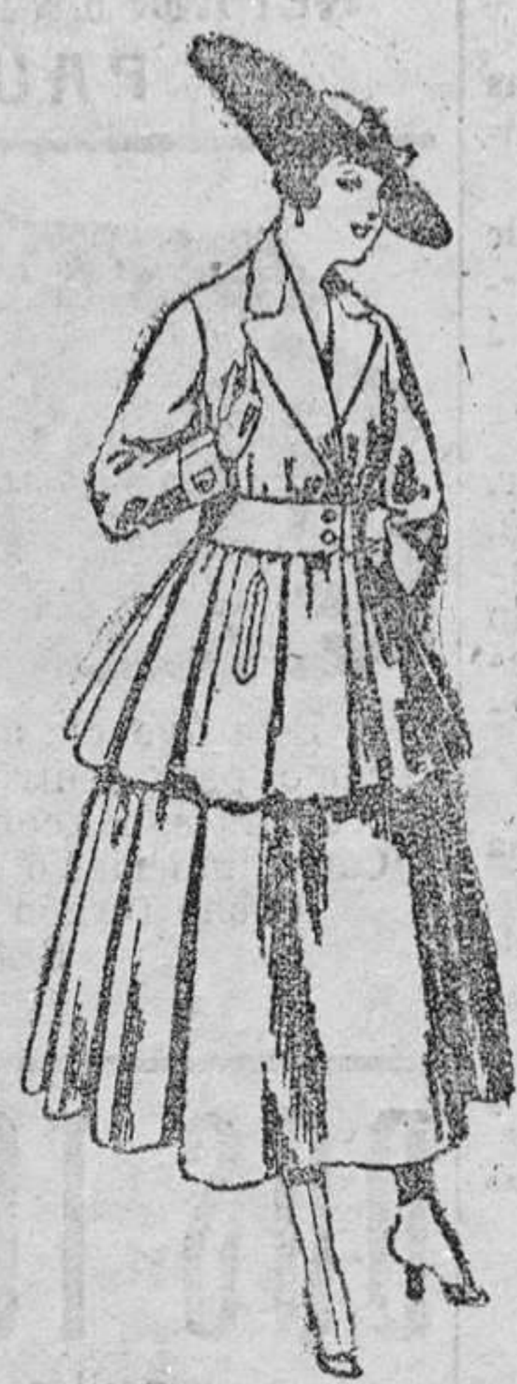
Traje de lana, en negro azul y color, para señora. De pesetas 90 á 100.

Camisería, Géneros de punto, Corbatería, Guantería, Peletería, Sombrerería, Zapatería, Paraguas, Bastones y Artículos de viaje