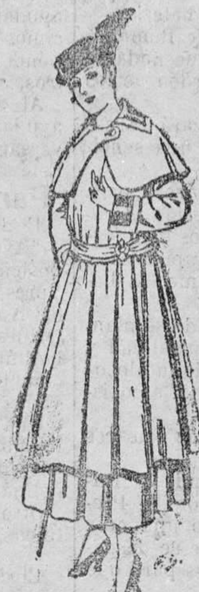
Abrigo de punto, en color, para señora. De pesetas 75 á 120.