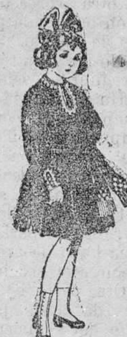
Vestidos de lanilla azul, para niñas de 4 á 9 años. De pesetas 23 á 56.