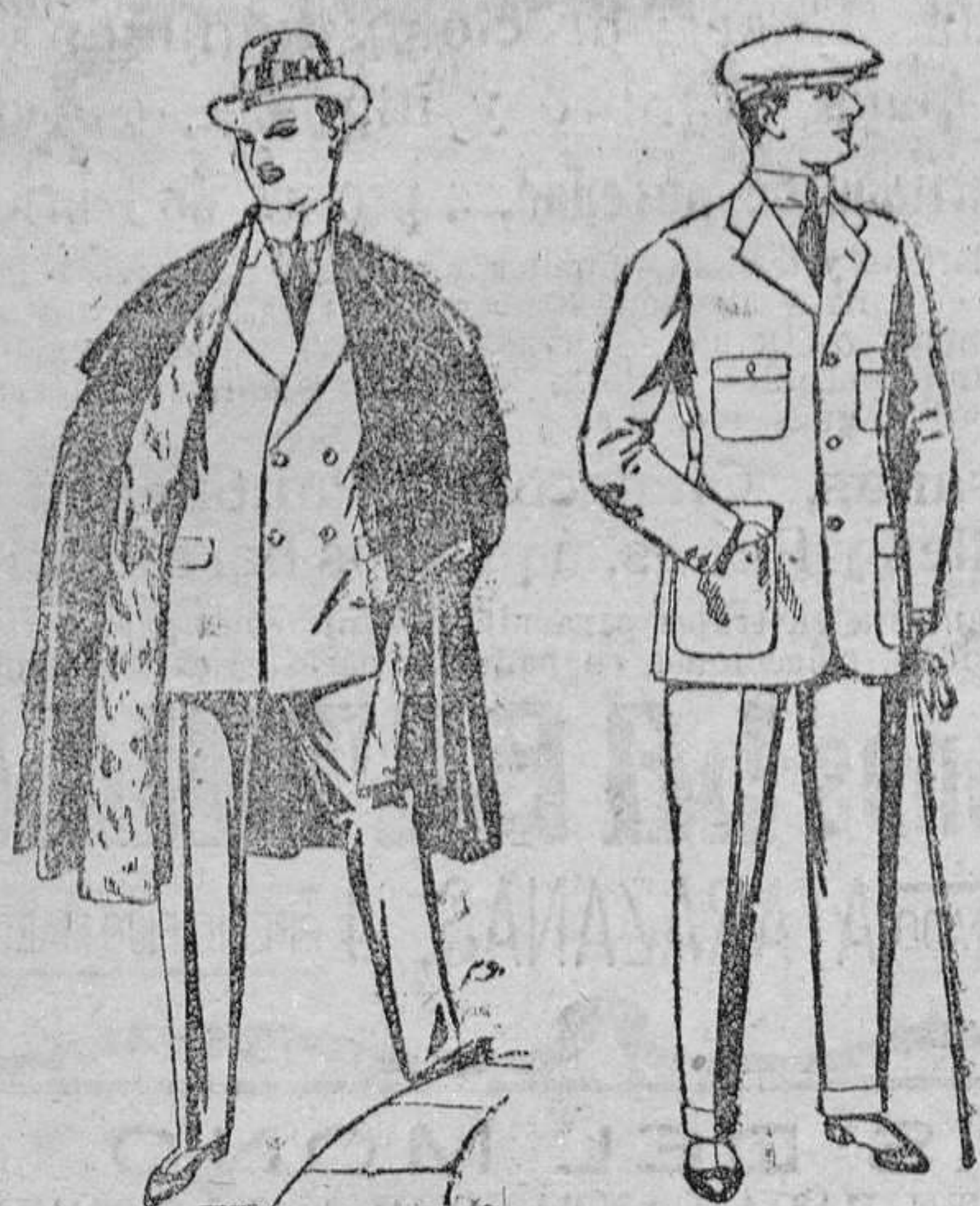
Capas (enteras) de paños de Béjar y Terrasa, embozos de peluche, terciopelo, astrakán ó escocés. De pesetas 55 á 115.