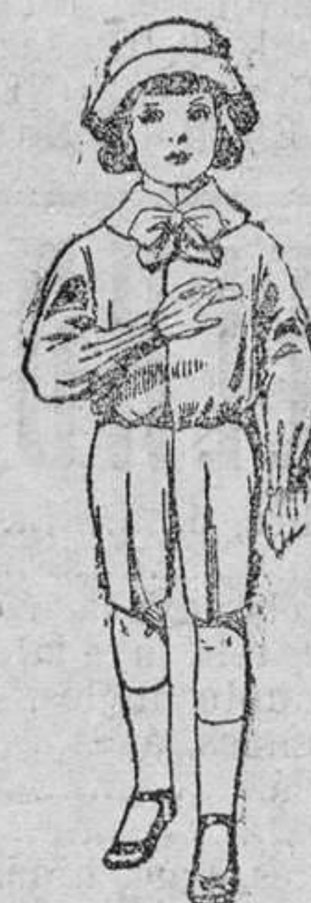
Traje de patén para niños de 4 á 9 años. De pesetas 9 á 14.