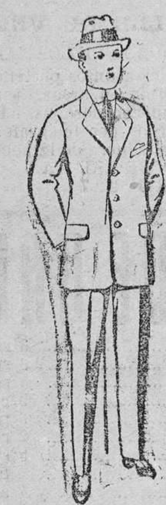
Trajes de patén, vicuña ó jerga, para niños de 10 á 16 años. De pesetas 15 á 55.