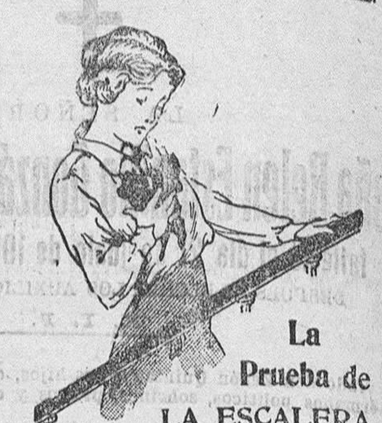
La Prueba de LA ESCALERA

Se vende en las principales farmacias del mundo y Baraco, 24, MADRID Se resalta folleto que guía lo pide.