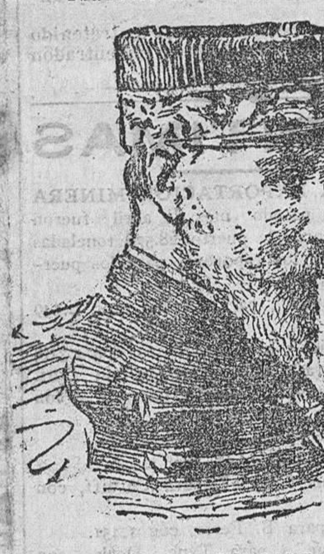
GENERAL GOURAND, que ha sustituido al general D'Amde en el mando de las tropas francesas que operan en contra de los turcos en los Dardanelos.