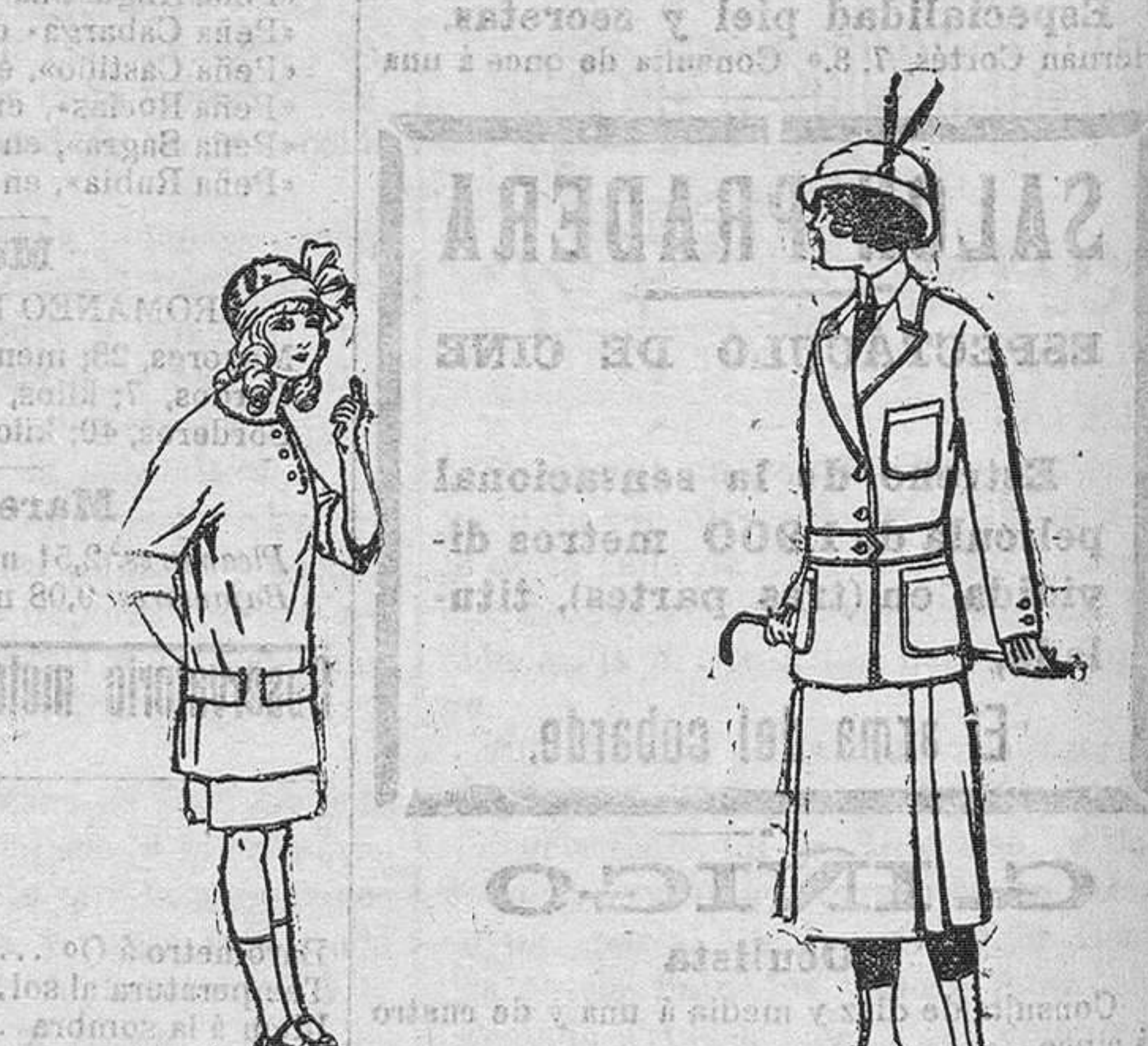
Trajes de lanilla, para señora. á pesetas 25. Vestidos de lanilla para niños de 4 á 12 años. De pesetas 9 á 30. Trajes de lanilla para jovencitas de 13 á 15 años. á pesetas 19.