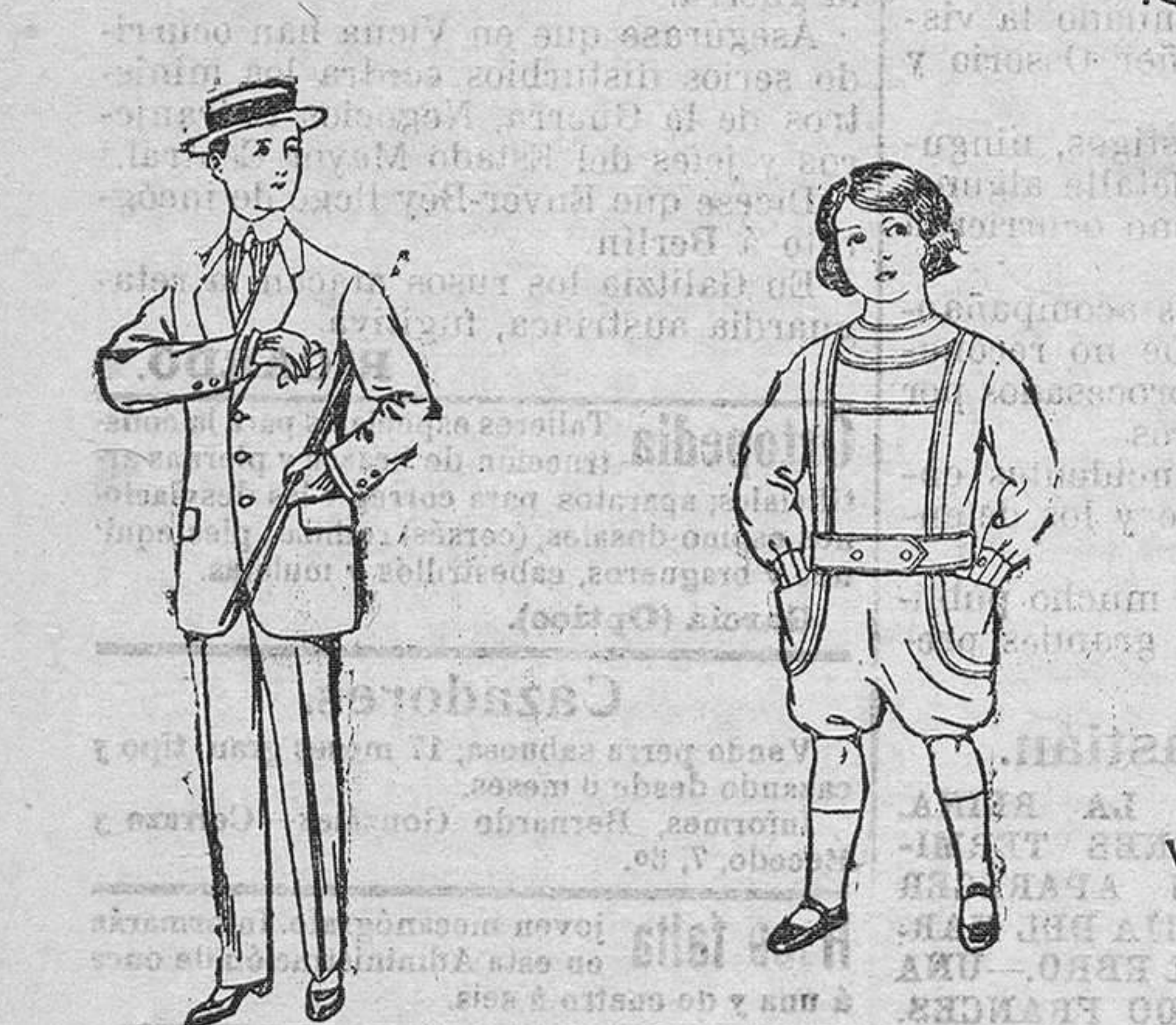
Trajes de lanilla, vicuña etc. Traje delantero de dril, color belga para niños de 10 á 16 años. y azul, para niños de 3 á 6 años. De pesetas 14 á 48. De pesetas 6 á 12.