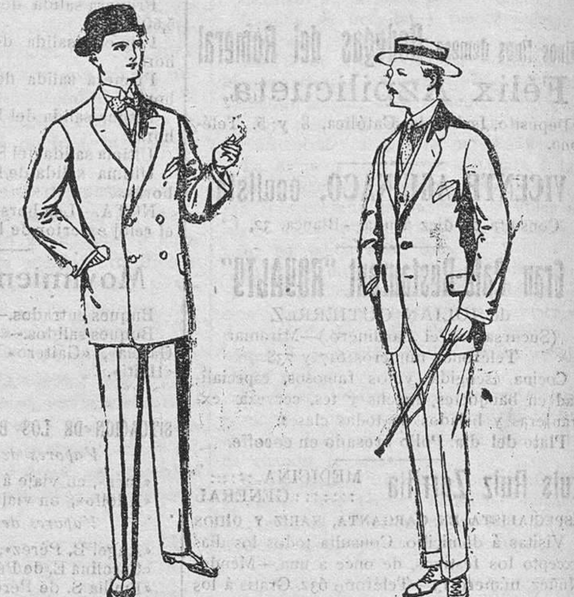
Trajes de vicuña ó jerga, negros y azules. De pesetas 35 á 75. Trajes de alpaca negra. De pesetas 32 á 54