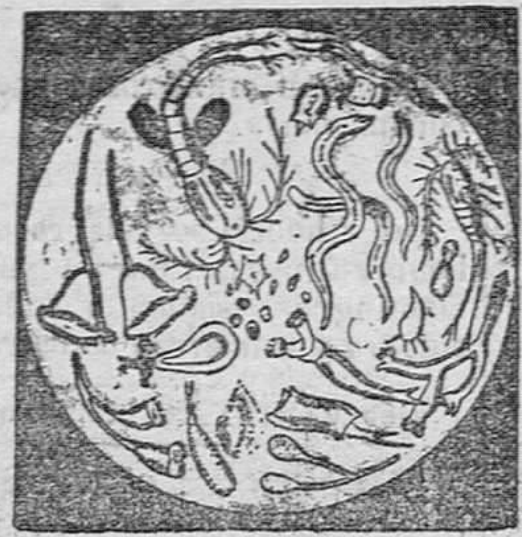
MICROBIOS destruidos por el Alquirán-Guyot

El tratamiento sólo cuesta unos 10 céntimos al día y cura. Atención.—Como hay personas para quienes el sabor del agua de breja no es agradable, podrán reemplazarla con las Cápsulas-Guyot de Alquirán de Noruega (de pino marítimo puro) y tomar dos ó tres cápsulas á cada comida; las cuales producen idénticos efectos saludables y curación igualmente cierta. Las verdaderas Cápsulas-Guyot son blancas, y la firma de Guyot va impresa en negro sobre cada cápsula.