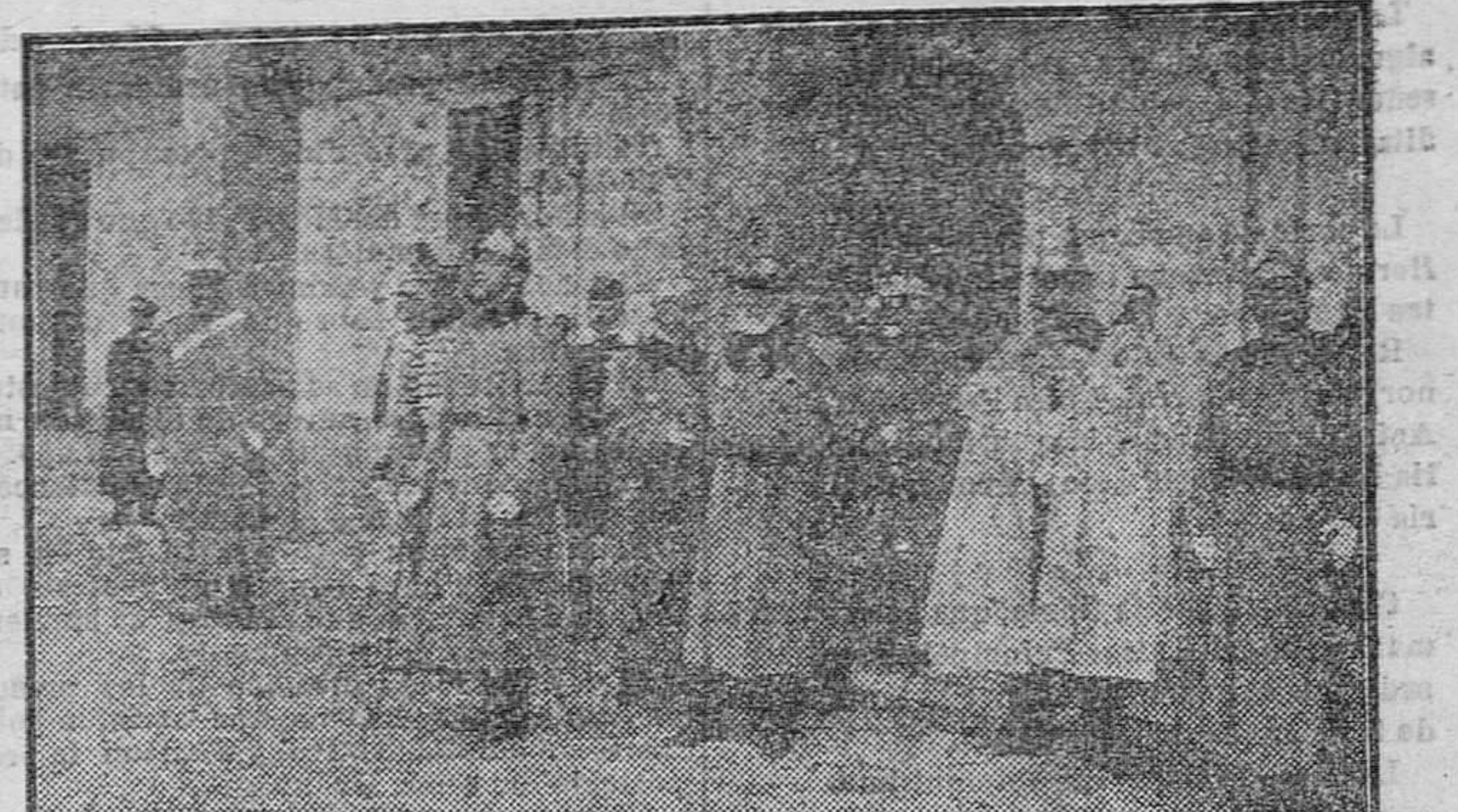
MADRID.—Misa de campaña en el cuartel de la Montaña por el general Ríos.—El Rey, ministro de la Guerra, etc.

Por cierto que la orquesta estaba á un tono, que hubiera permitido cantar á Ibarrola como tenor de fuerza. En el salón Pradera se siguen poniendo preciosas y variadas películas todas las noches, y el público, que ha acogido las comodidades que el salón le da en toda la simpatía que merecen las felices iniciativas de la empresa, acude al espectáculo en masa, y aplaude calurosamente.