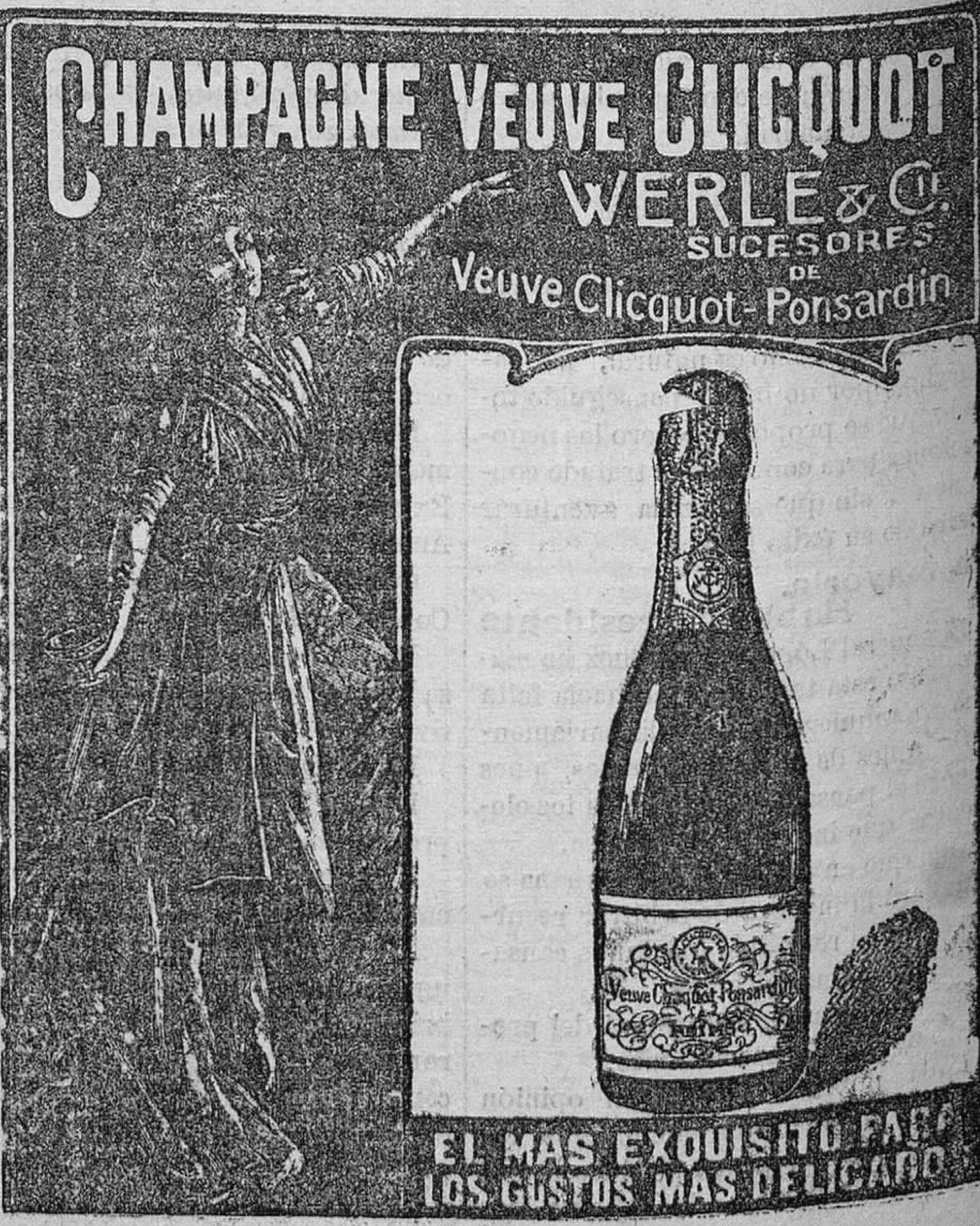
EL MAS EXQUISITO PAGO A LOS GUSTOS MAS DELICADO