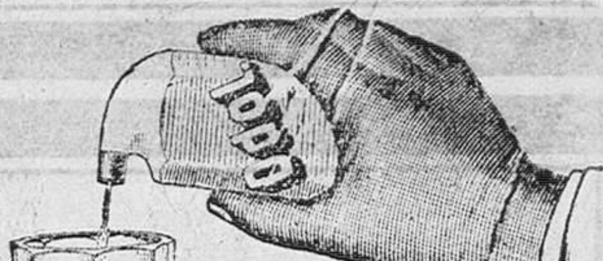
lo mejor para la dentadura el frasco Ptas 3 50