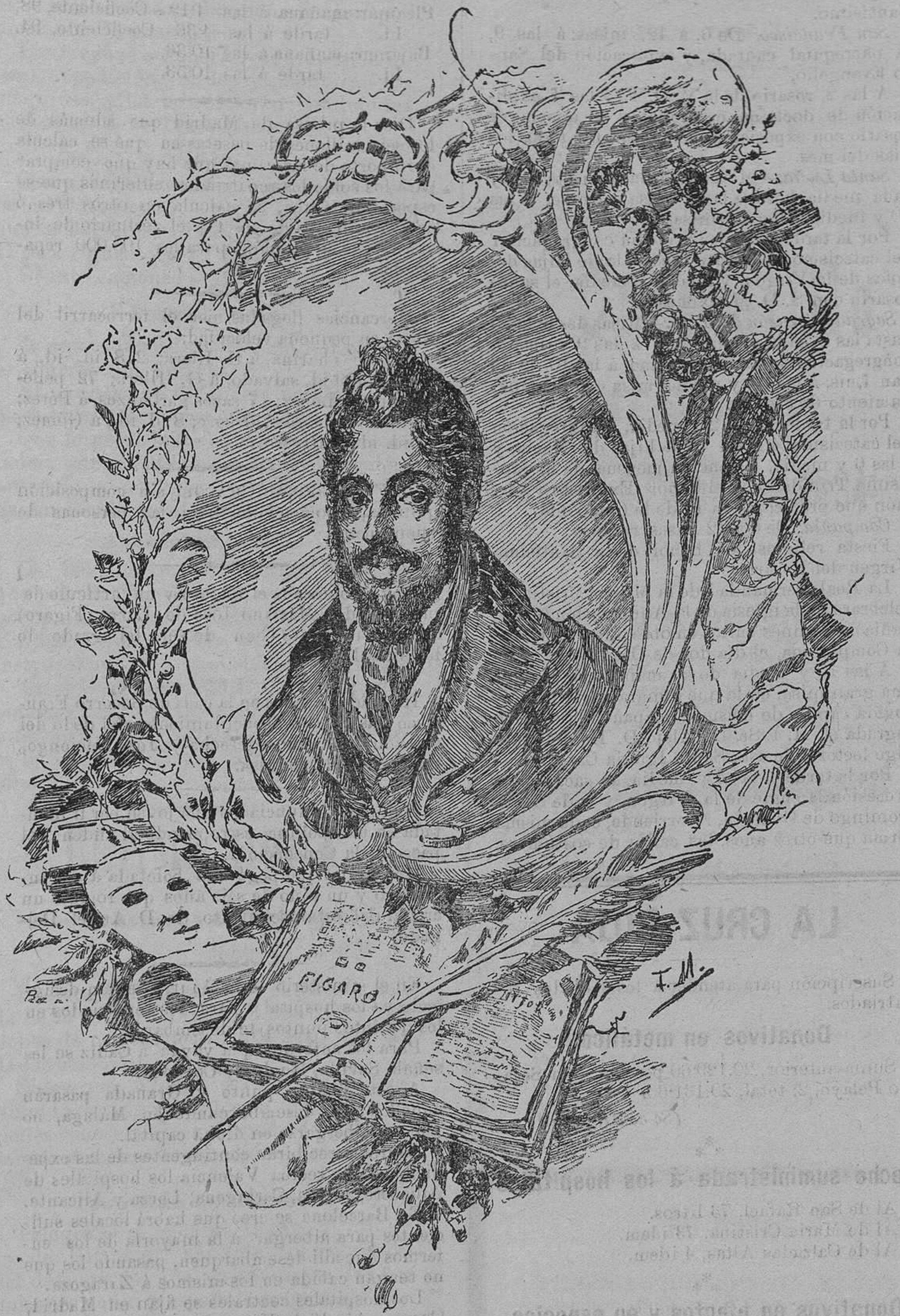
Don Mariano José de Larra

Y será para el país un buen día, aquel en que se retiren á sus casas, para no ocuparse más que de sus asuntos particulares, los hombres que hoy están al frente de los negocios públicos, y á cada mo-