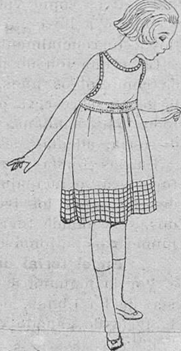
Delantales de voile blanco, combinado con voile estampado, para niñas de 4 a 6 años, de ptas. 8 a 10