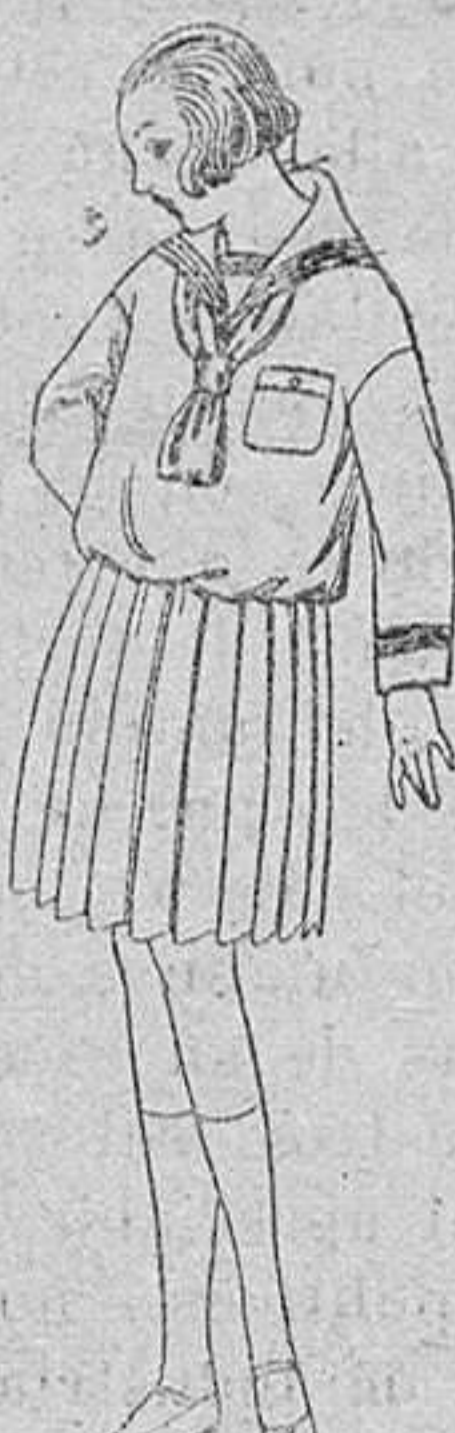
Trajes modelo «Marinera» de dril, otomán o satén blanco, para niñas de 4 a 9 años, de ptas. 16 a 85 Los mismos, de estambre o je ga azul, de ptas. 45 a 55