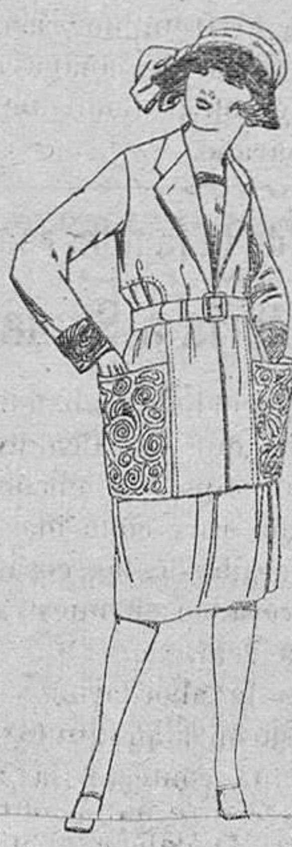
Trajes de gabardina, sarga inglesa, lanilla, etc., en azul y color, adornos bordados, para jovencitas de 13 a 15 años, de ptas. 95 a 130