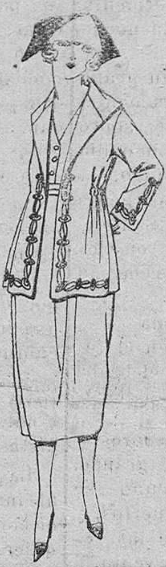
Trajes de estambre, sarga inglesa etc., en negro, azul y color, adornos bordados, de ptas. 170 a 195 Trajes de dril otomán, gabardina, etc., de ptas. 55 a 83