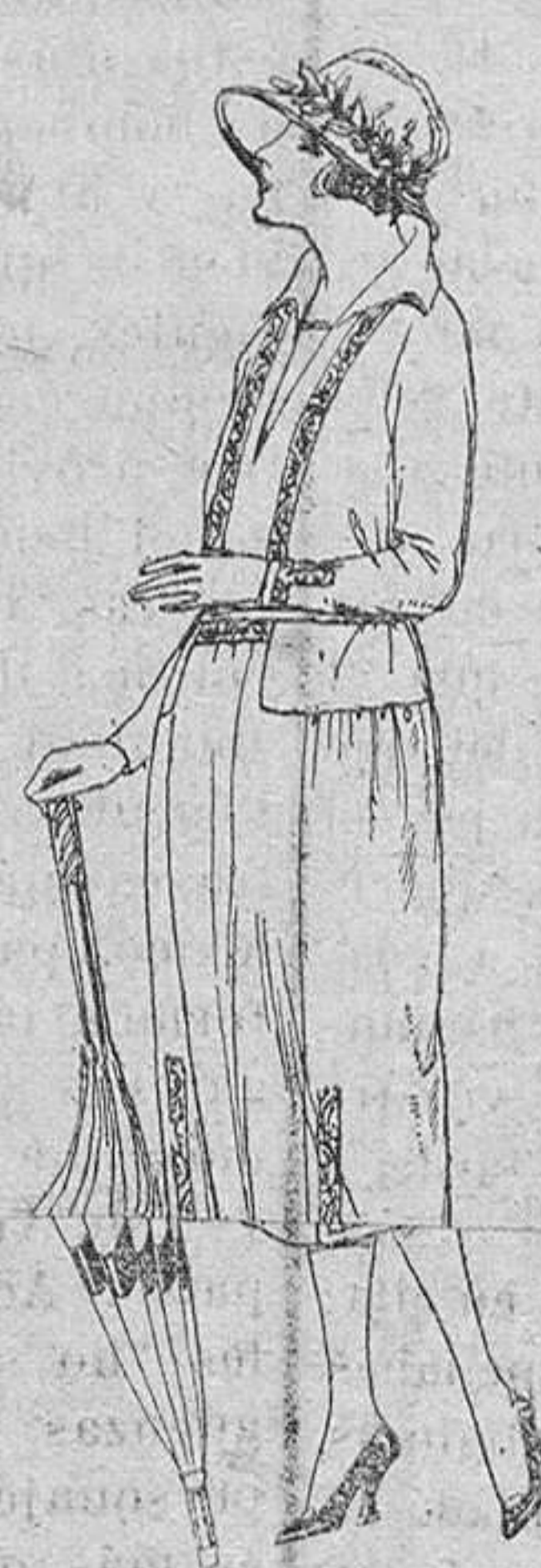
Vestidos de sarga inglesa, estambre, etc., en negro, azul y color, adornos bordados, de ptas. 110 a 135