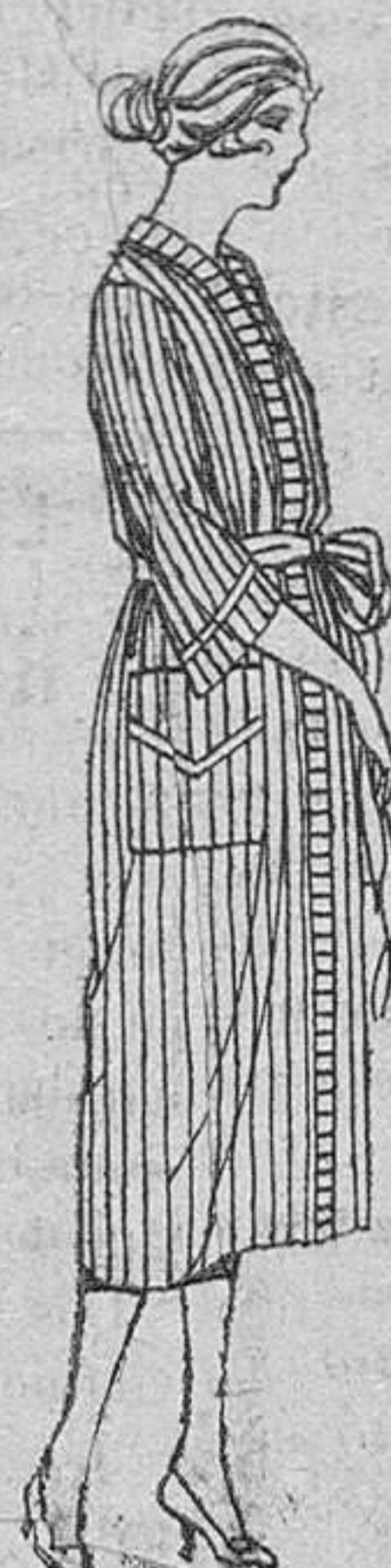
Batas de percal, voile listado, etc., de ptas. 18 a 30