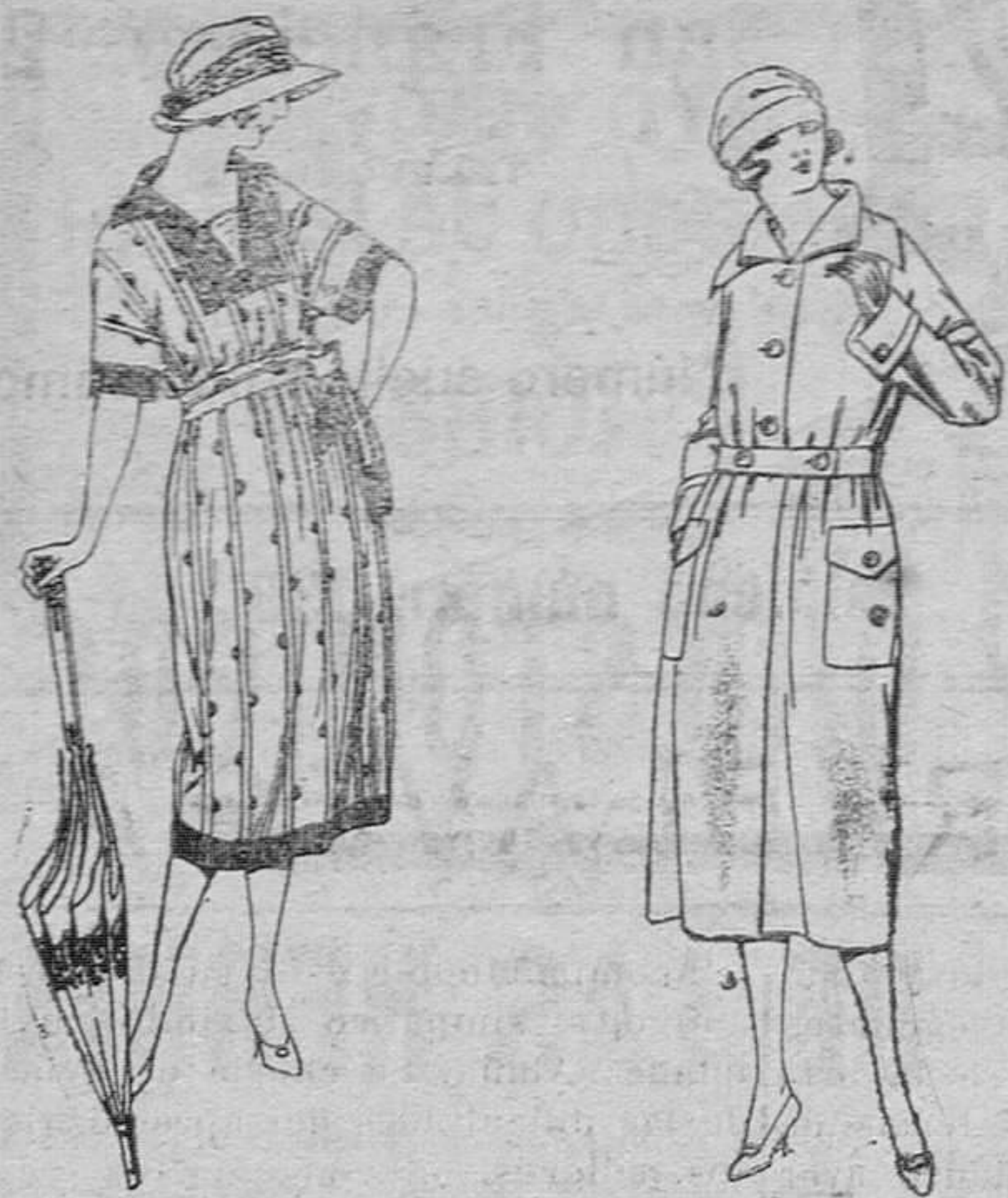
Vestidos de voile labrado, diferentes combinaciones de color, de ptas. 58 a 75

SUCURSALES: Madrid, Barcelona, Alicante, Almería, Bilbao, Cádiz, Cartagena, Gijón, Granada, Málaga, Palma de Mallorca, Sevilla, Valencia, Valladolid y Zaragoza.