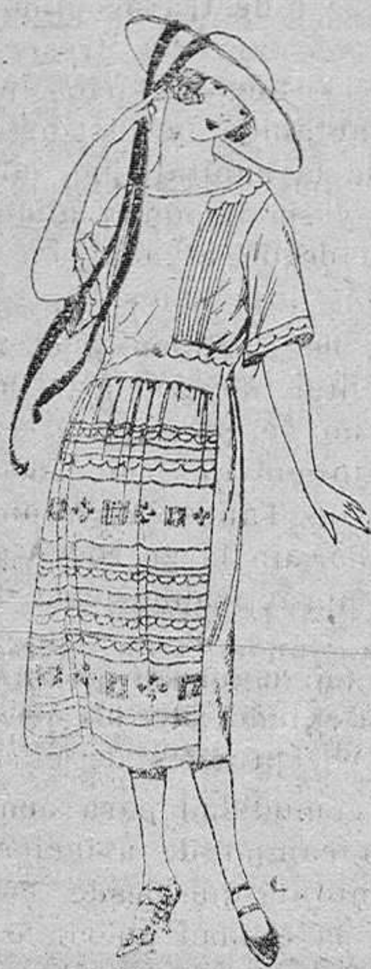
Vestidos de crespón blanco y color, adornos bordados, de ptas. 70 a 90