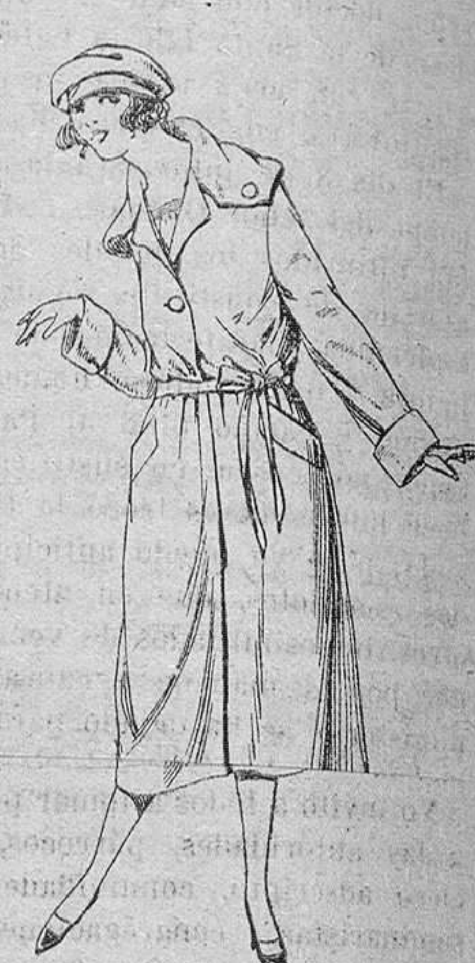
Abrigos de seda impermeables, en negro, azul y color, de ptas. 130 a 225