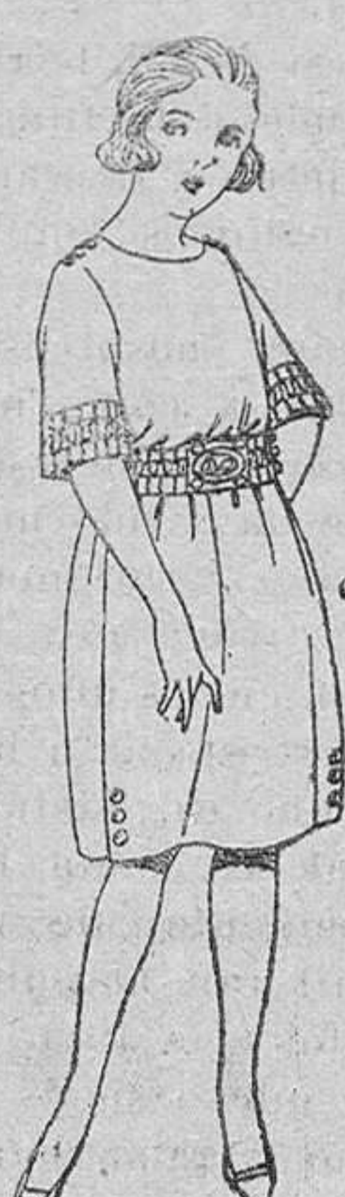
Vestidos de lanilla, gabardina, sarga inglesa, etc., en azul y color, adornos bordados, para jovencitas de 13 a 15 años, de ptas. 55 a 85