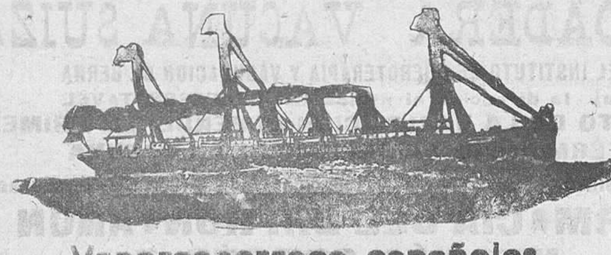
Vapores correo españoles

De venta en Droguerías, Farmacias y Ultramarinos Compañía de Productos Alimenticios (S. A.) San Sebastián