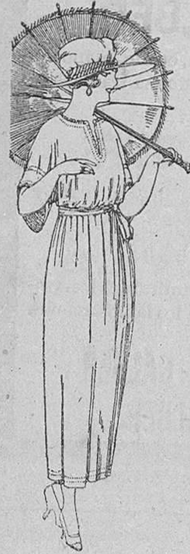
Vestidos de voile blanco y color, adornos bordados, de ptas. 45 a 58