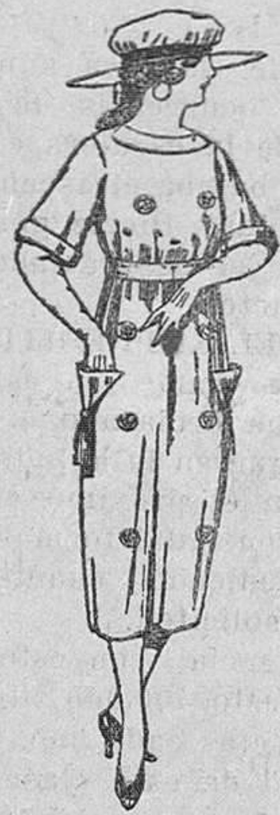
Vestidos de sarga inglesa, estambre, etc., en azul y colores, adornos bordados, de ptas. 55 a 62