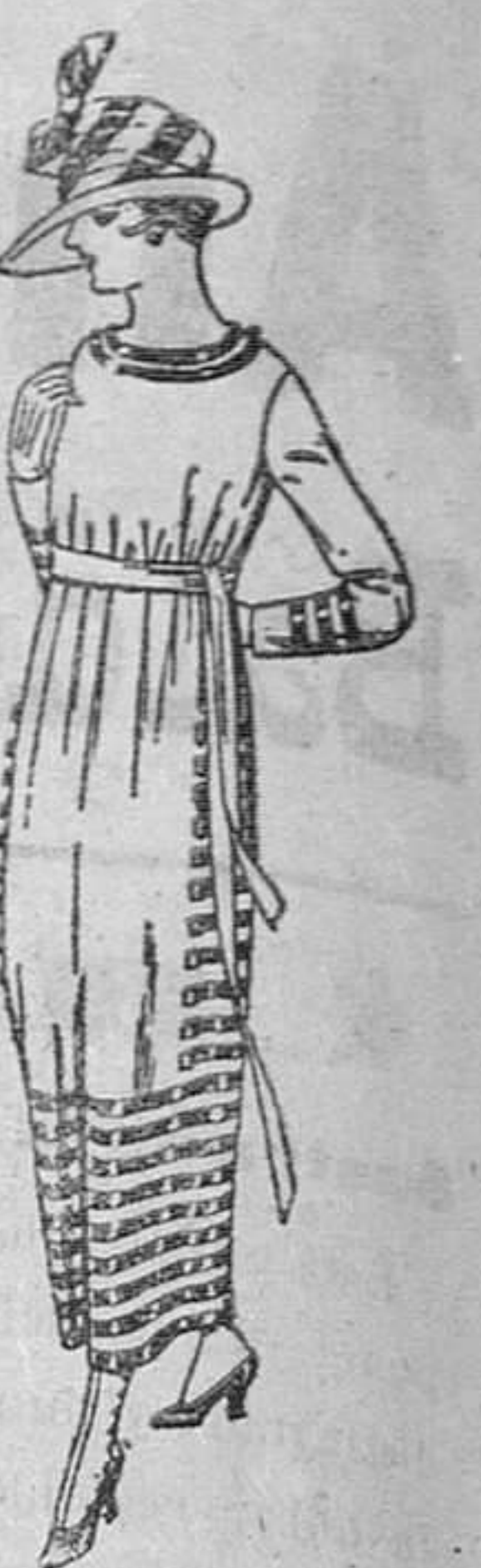
Vestidos de sarga inglesa, estambre, etc., en negro, azul y color, adornos trenilla de seda, de ptas. 90 a 105