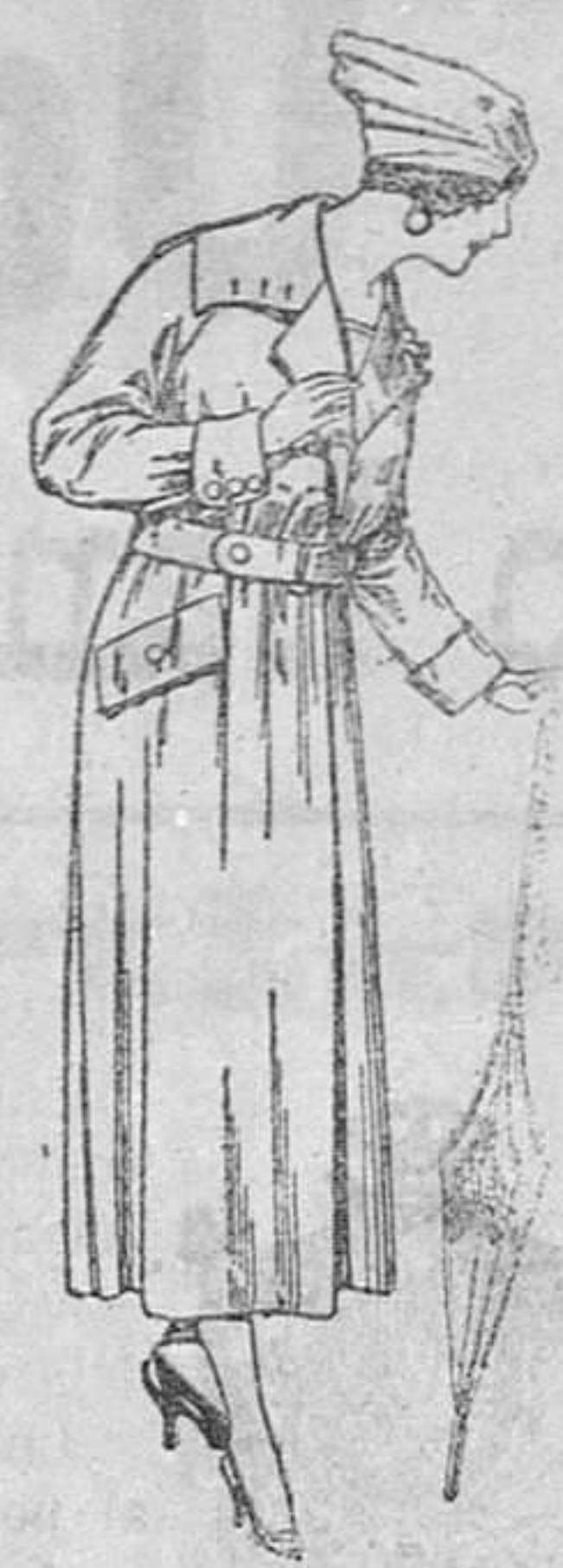
Abrigos de gabardina inglesa, impermeabilizados, diferentes colores, de ptas. 85 a 150