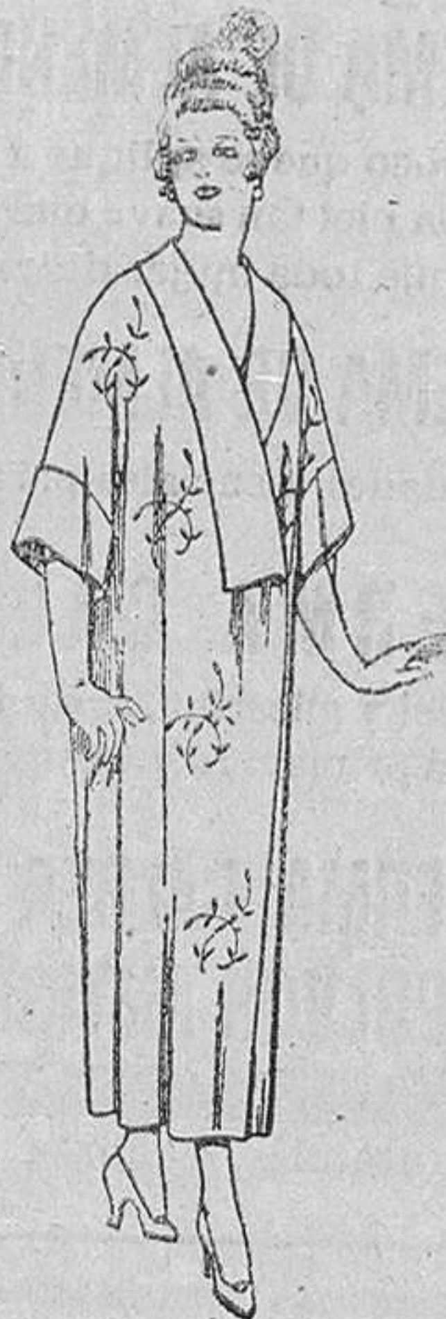
Bata de esterilla «Matting», adornos bordados, de ptas. 45 a 58