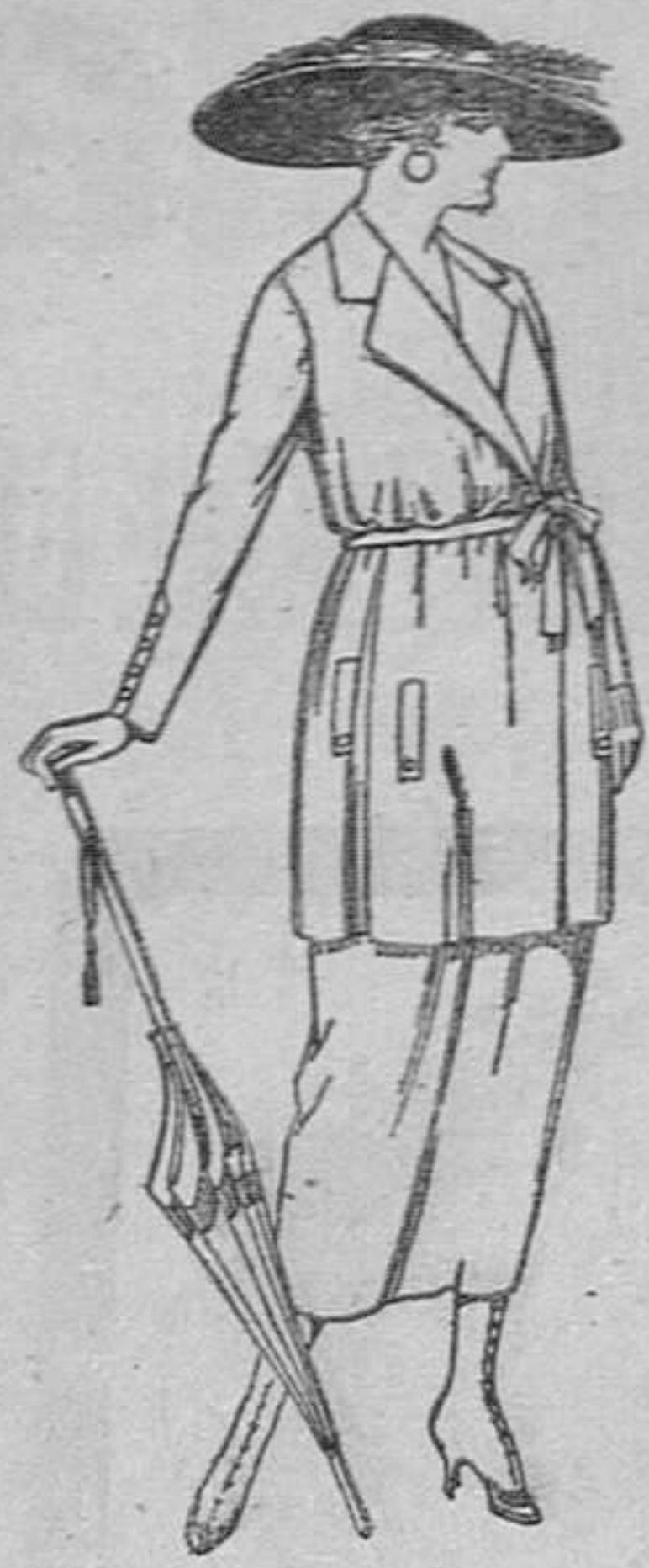
Trajes de estambre, lenilla, etcétera. en negro, azul y color, de ptas. 120 a 135

Madrid, Barcelona, Alicante, Almería, Bilbao, Cádiz, Cartagena, Gijón, Granada, Málaga, Palma de Mallorca, Sevilla, Valencia, Valladolid y Zaragoza.