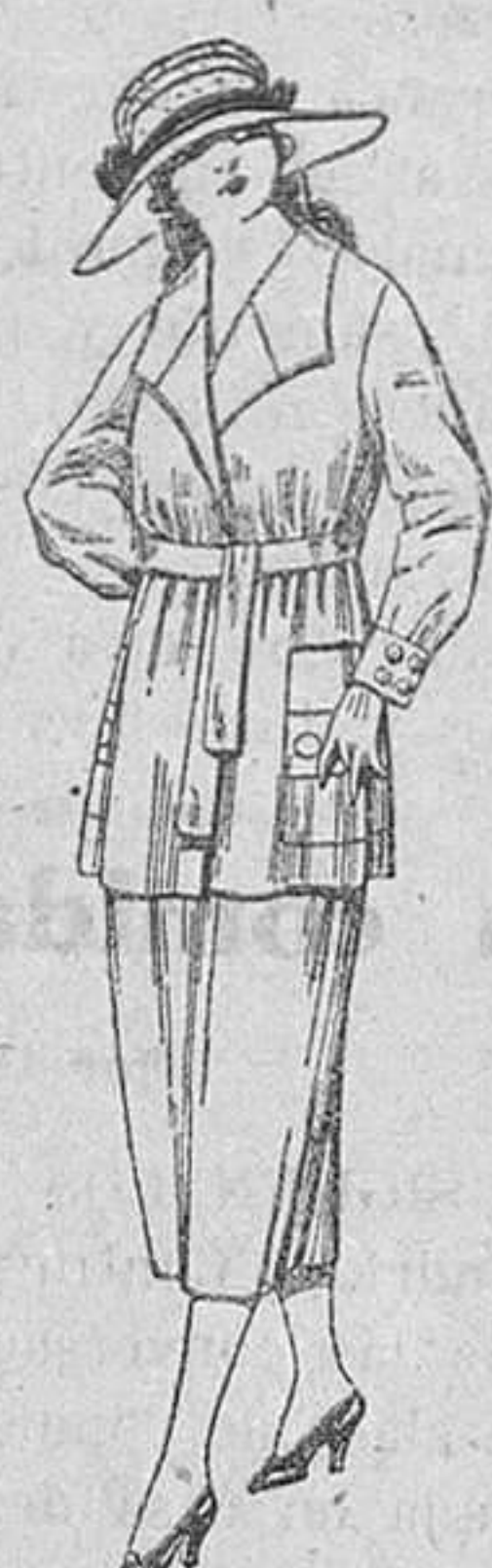
Trajes de estambre, gabardina, etc., en azul y color, de ptas. 68 a 79