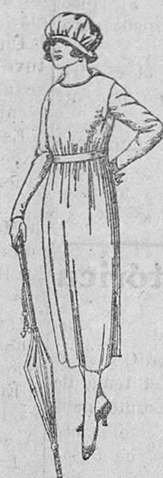
Vestidos de estambre, lenilla, etc., en azul y colores, adornos bordados, de ptas. 57 a 65