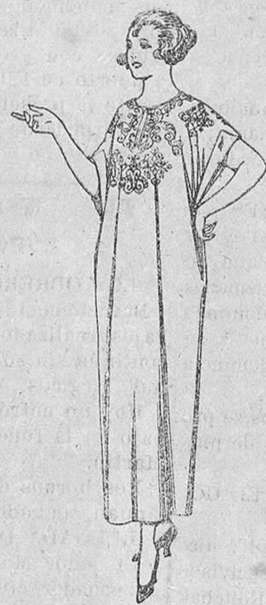
Batas de crepón, voile, etc., adornos bordados, de ptas. 14 a 22