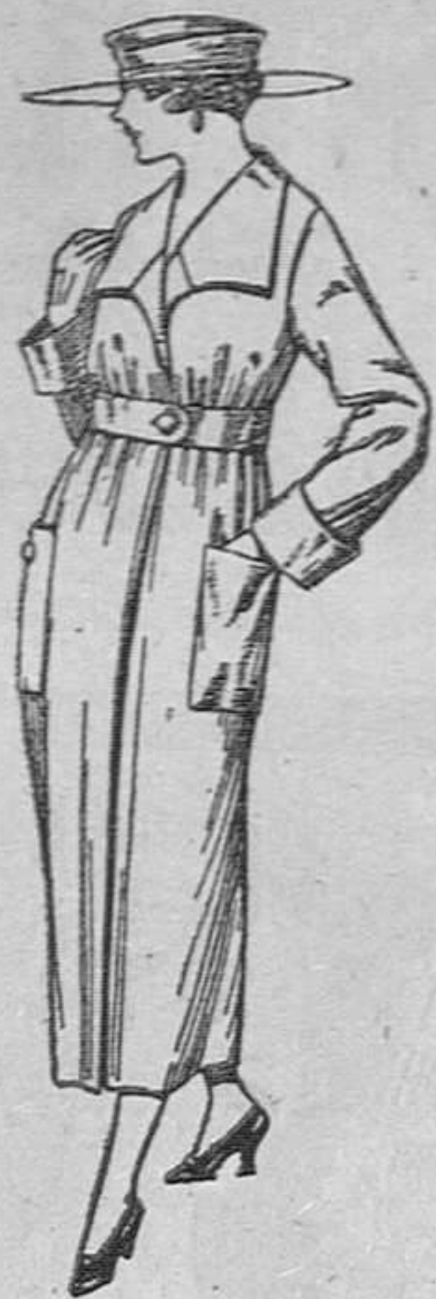
Guardapolvos de drill crudo, gris, etc., de ptas. 14 a 28