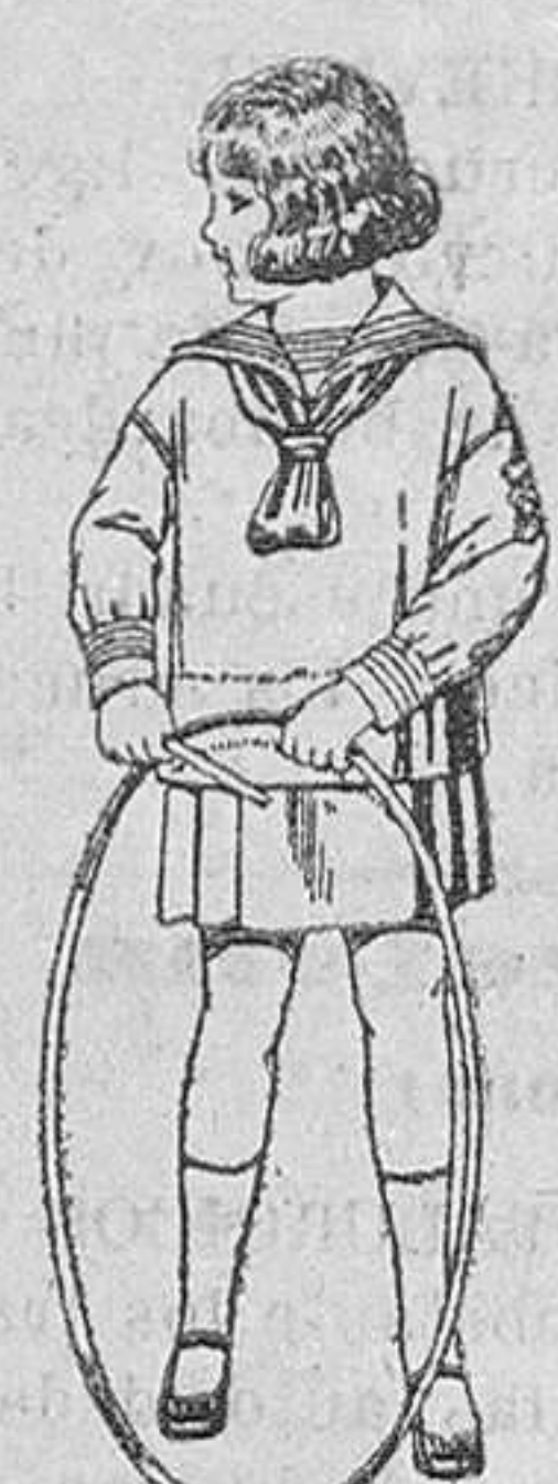
Trajes modelo «Marinera inglesa», de estambre o sarga azul, para niños de 4 a 9 años, de ptas. 30 a 42