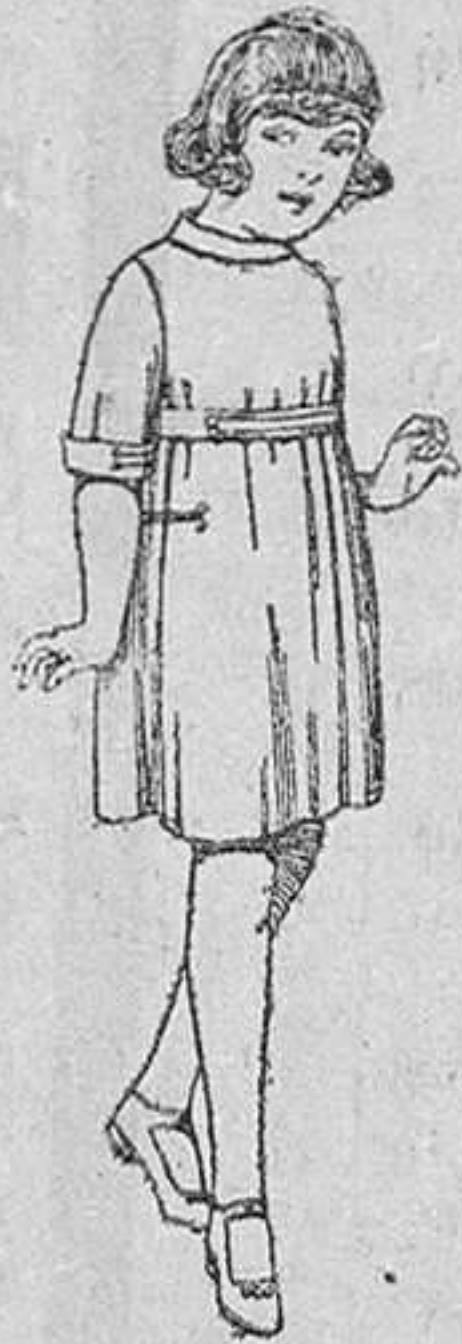
Vestidos de sarga inglesa azul, adornos sarga blanca, para niñas de 4 a 9 años, de ptas. 36 a 40