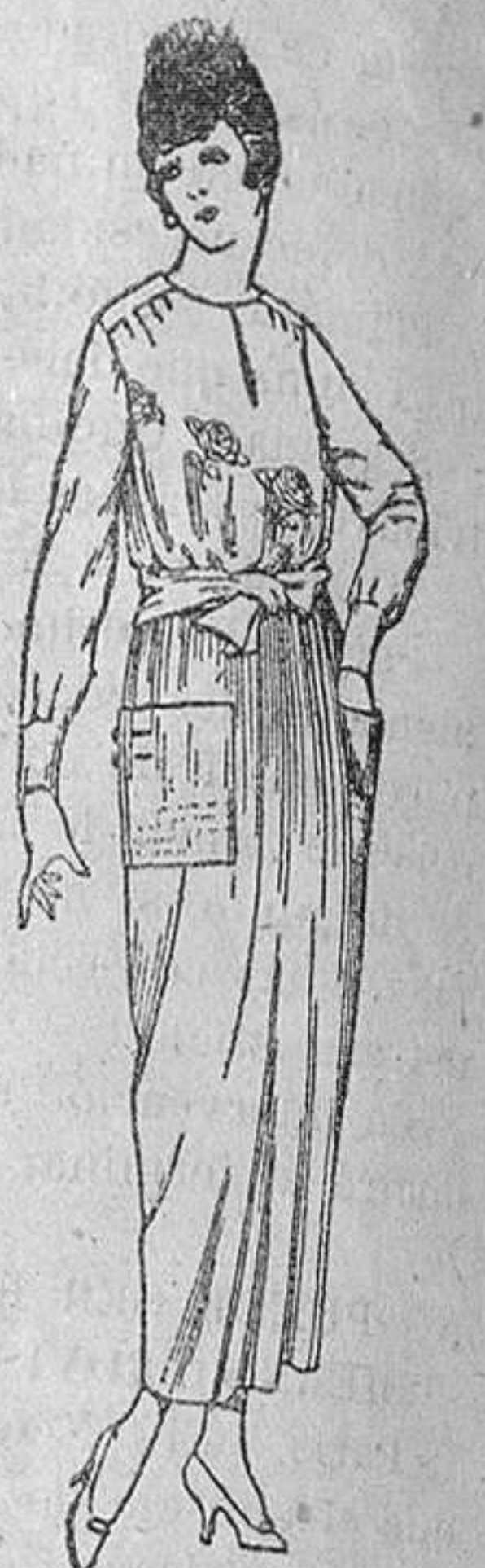
Batas de crepón, voile, etc., en negro, azul y color, adornos bordados, de ptas. 17 a 22

Camisería, Géneros de punto, Corbatería, Guantería, Sombrerería, Zapatería, Peraguas, Bastones y Artículos de Viaje