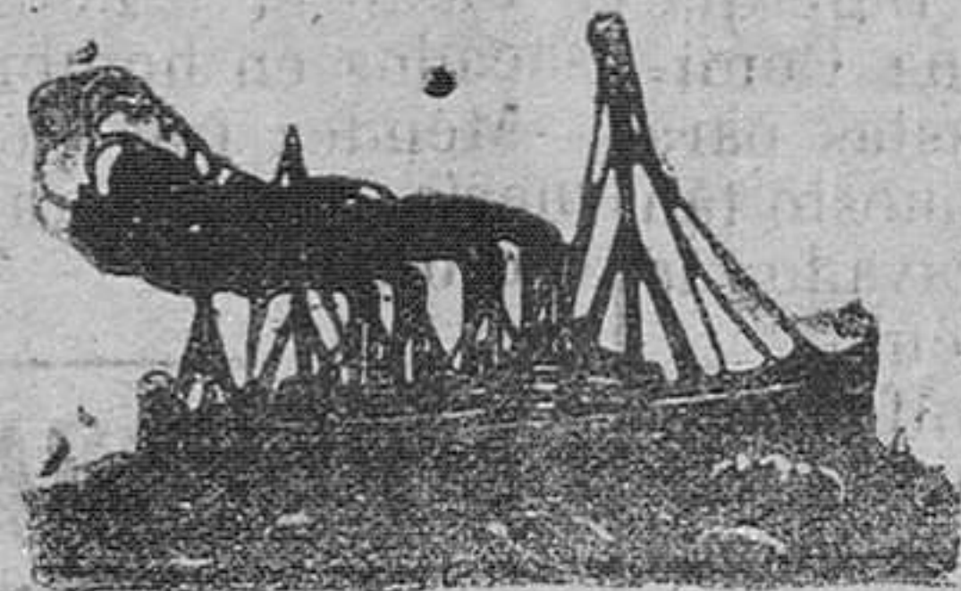
Vapores correos españoles DE LA