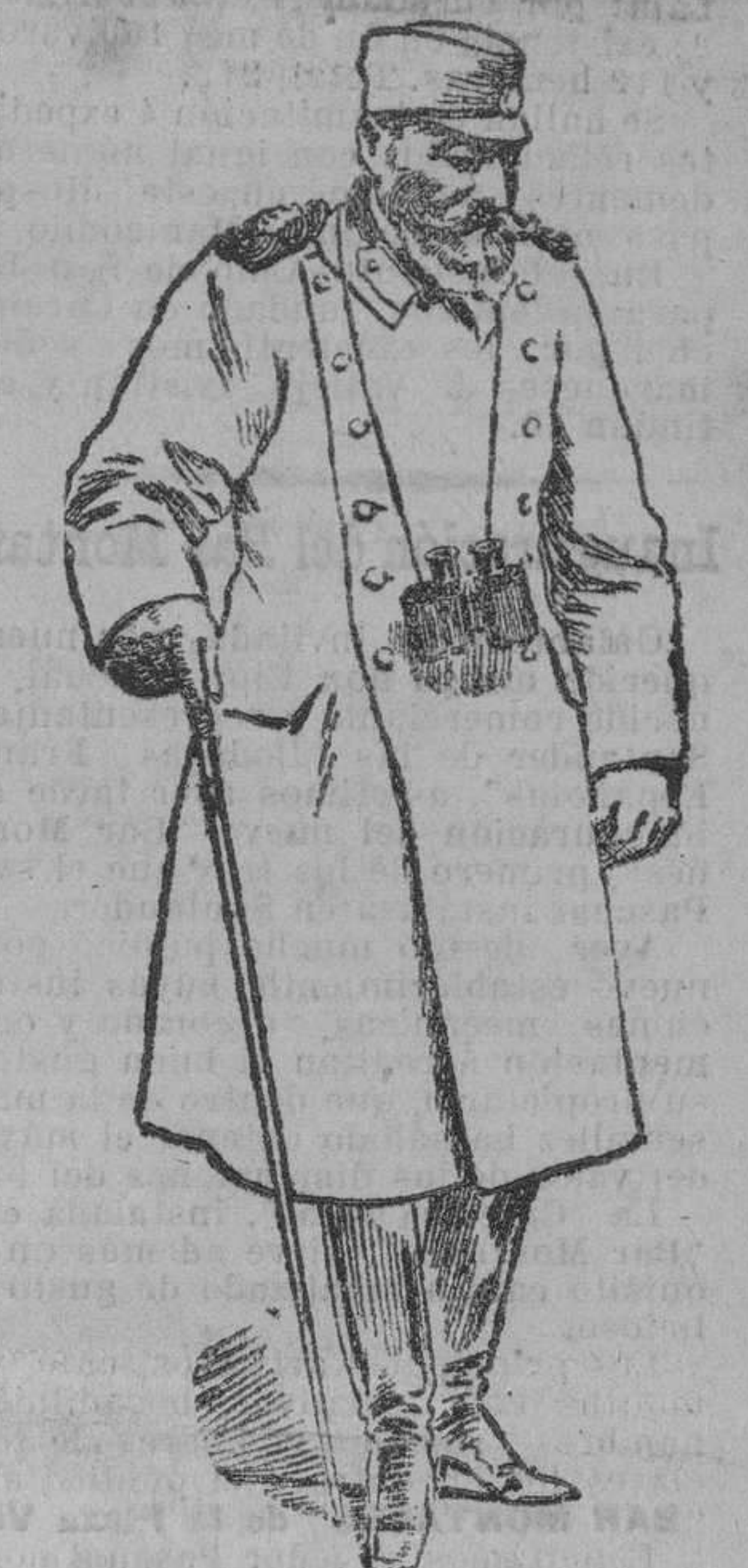
Un soberano proscripo Ultimo retrato del Rey Pedro de Serbia

Beneficencia provincial Movimiento del personal ocurrido en los Establecimientos de Beneficencia durante el mes de abril último: Hospitales Existían en fin de marzo 293; ingresaron en abril 204; fueron baja; por curación, 193; por defunción, 20; quedaron en fin de abril, 176 varones y 108 hembras. Total, 284. Existían para la cura y asistencia diaria, 63. Ingresaron 69 y fueron alta 78. Quedan 54. Casa de Caridad Quedaron 552; ingresaron 11; fueron baja; por reclamación, 5; por defunción, 8; existencia en fin de mes, 279 varones y 277 hembras. Total 556. Casa de Expósitos Existían 400; ingresaron 29; fueron baja; por reclamación paterna, 2; por cumplimiento de la edad reglamentaria, 3; por defunción, 14; quedaron en