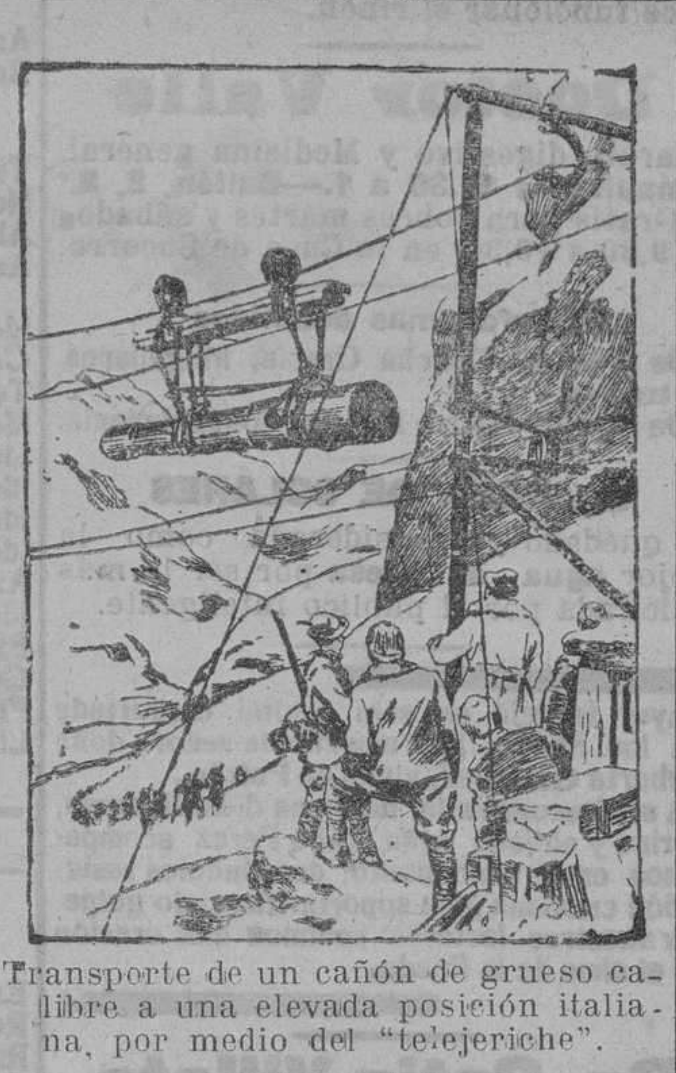
Transporte de un cañón de grueso calibre a una elevada posición italiana, por medio del "tejericho".