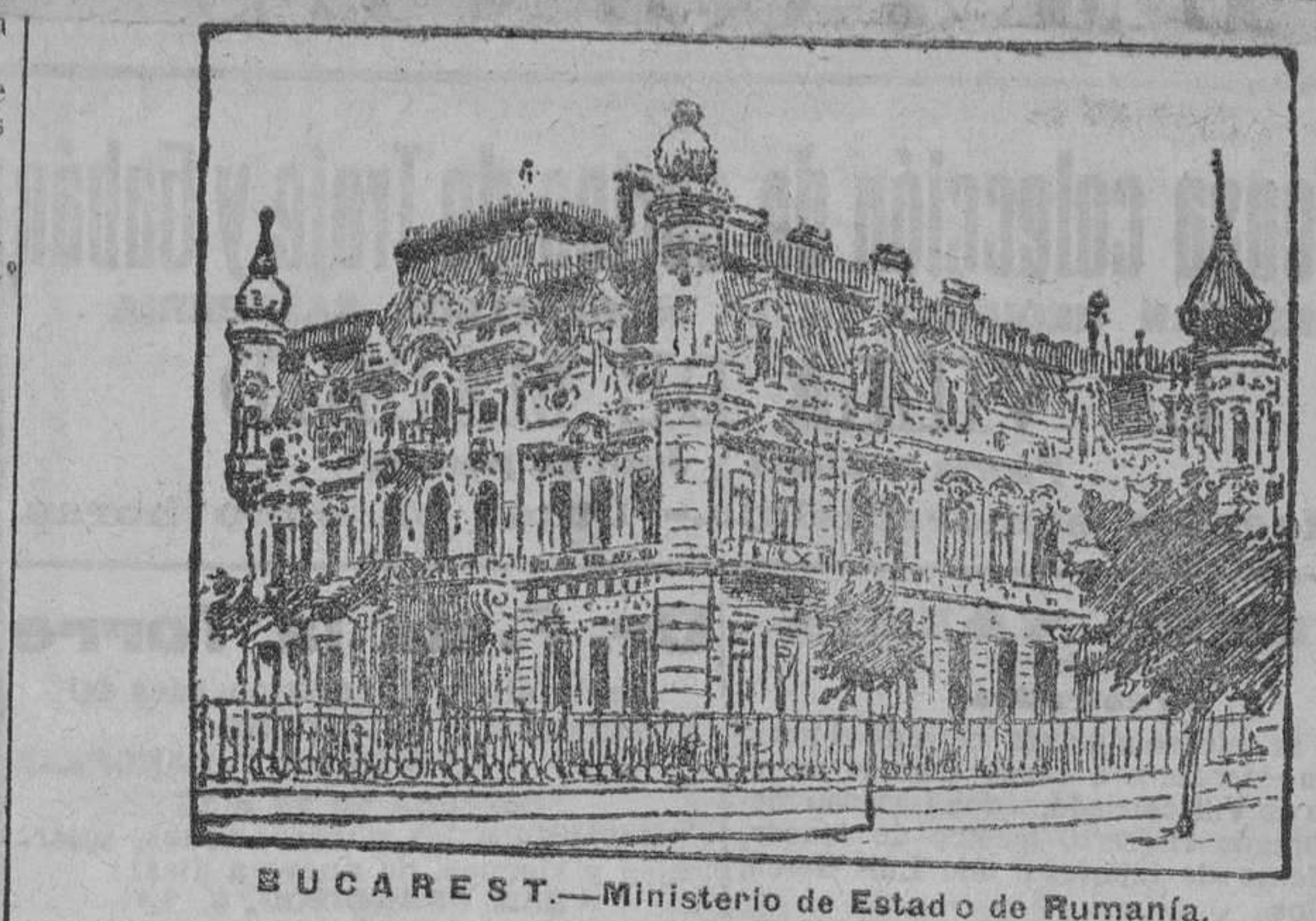
BUCAREST.—Ministerio de Estado de Rumania.