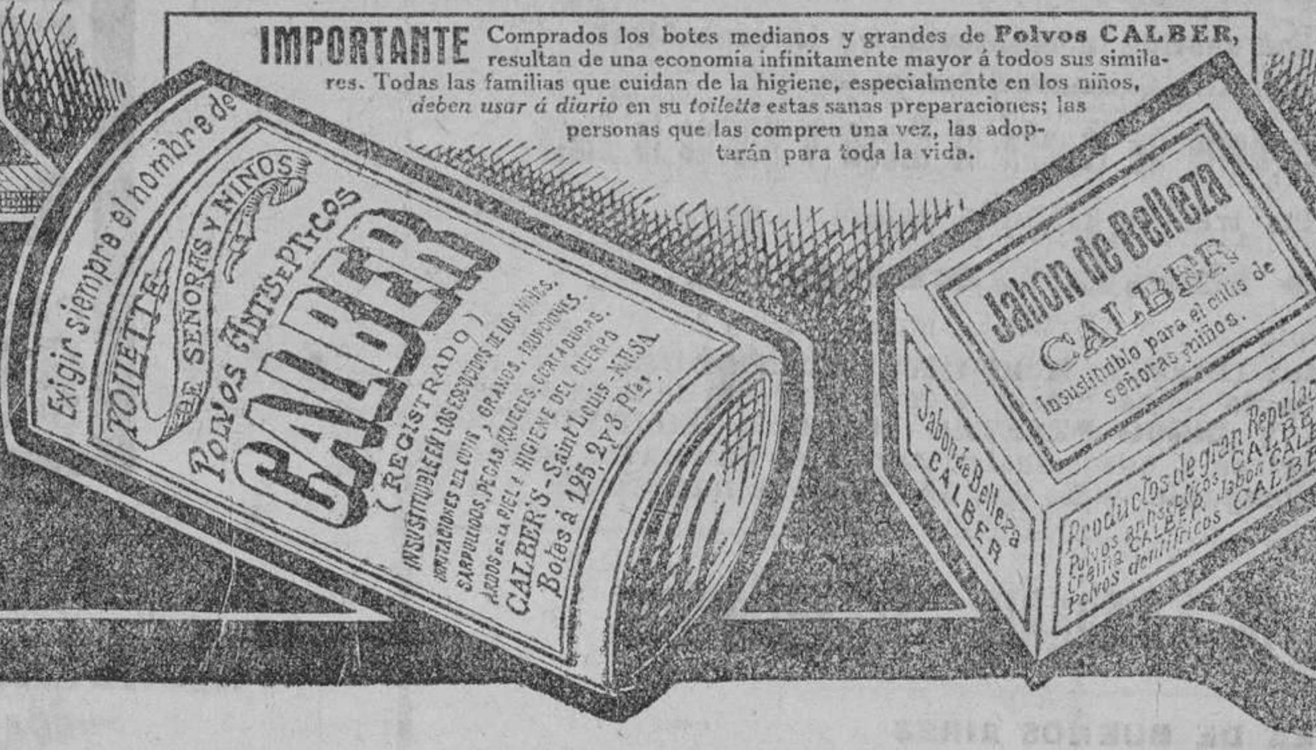
De venta en Santander: Señores Pérez del Molino y Compañía y señores Villafranca y Calvo.

son los preferidos por todas las madres y señoras cuidadosas de la higiene y de la salud. Y su reputación es tan sólida, porque son distintos de los demás, é infinitamente mejores, para los escocidos de los niños especialmente, irritaciones de la piel, granos, sarpullidos, rojeces, erupciones, manchas del cutis é higiene en general del cuerpo. La comodidad de su envase especial evita el uso antibigiénico de la borla ó algodón.