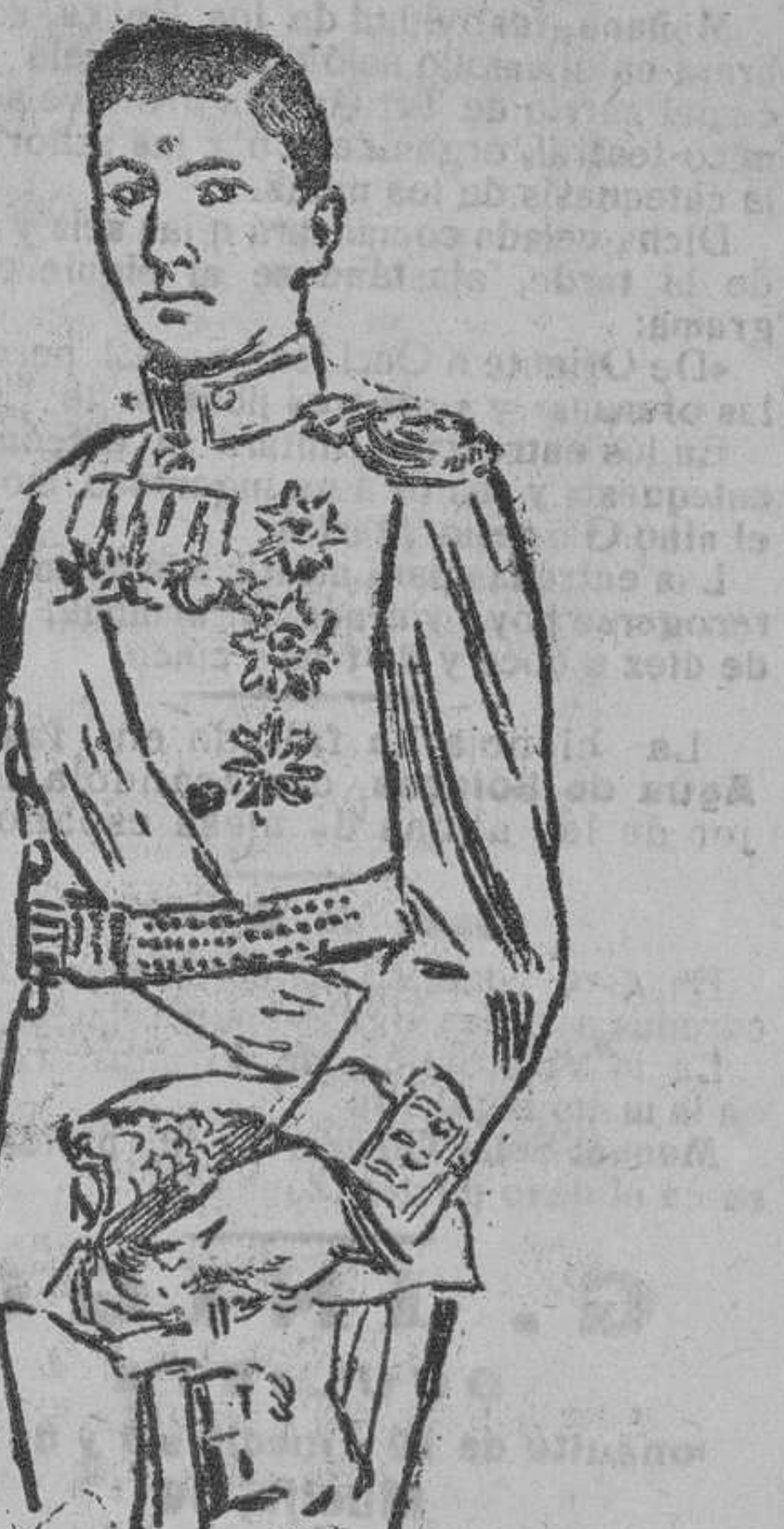
El Kronprinz de Bulgaria príncipe Boris, agregado al Cuartel general de feldmariscal Mackensen

Para obtener el resultado conseguido, ha sido preciso utilizar los descansos, doblar los trabajos y limitar las licencias a casos graves. La Dirección general, al publicar estos datos para que el Cuerpo de Correos reciba el homenaje público que merece, aprovecha la ocasión para discurrir que los muchos que recomiendan licencias, permisos o traslados y a quienes no es posible complacer porque hay que reclamar de todos una asiduidad extraordinaria y no interrumpida.