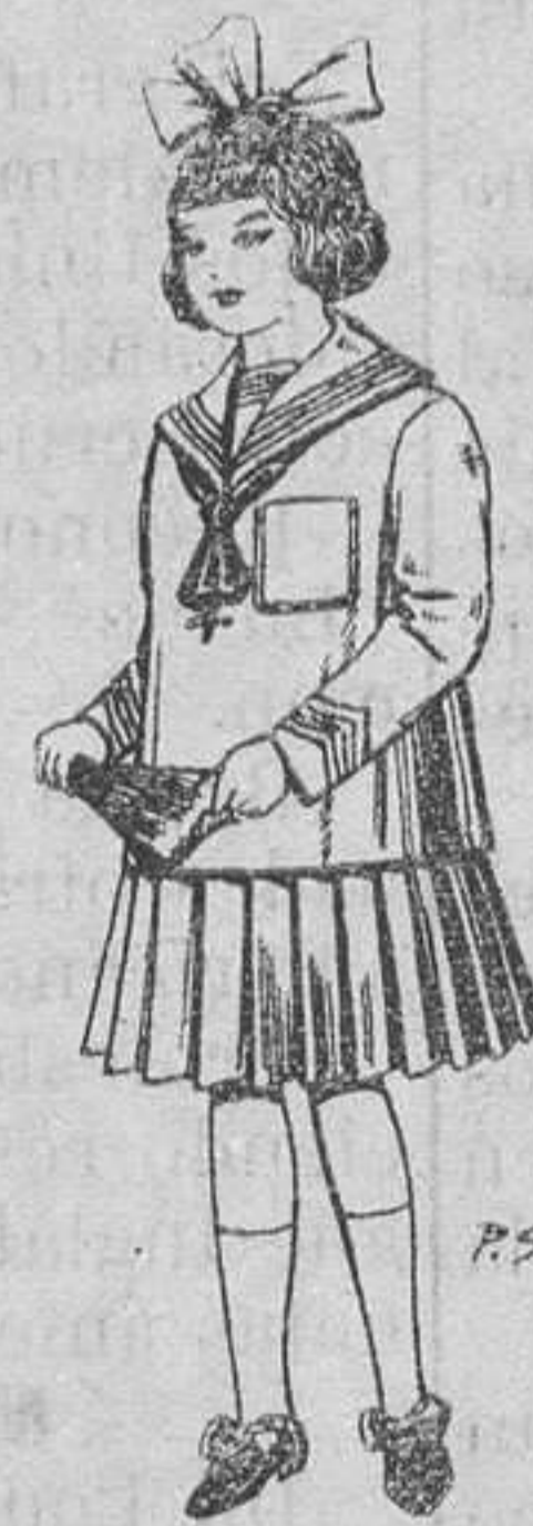
Trajes de lanilla para niñas de 4 a 12 años. De pesetas 32 a 40.