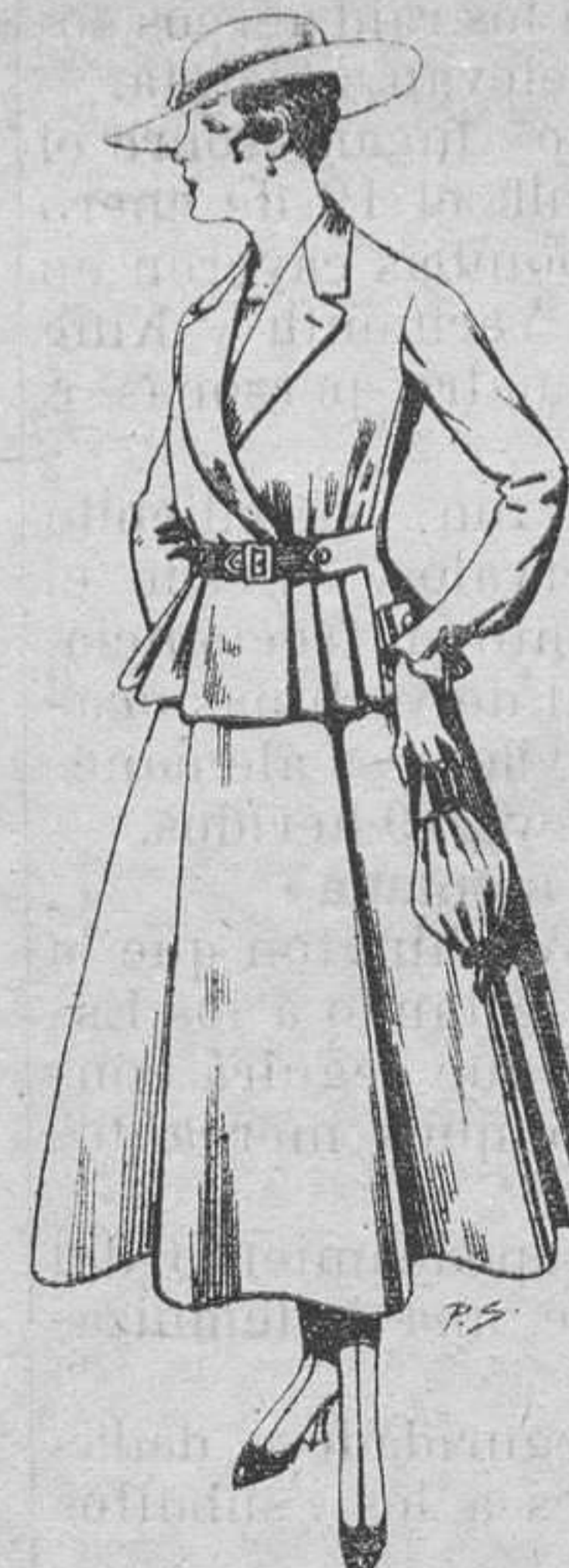
Trajes de lanilla para señora a pesetas 70.