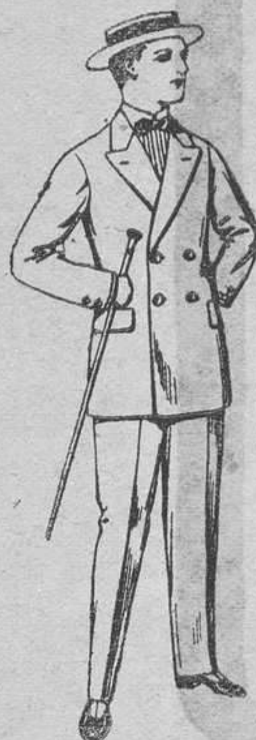
Trajes de lanilla para jovencitos de 10 a 16 años. De pesetas 17 a 48.