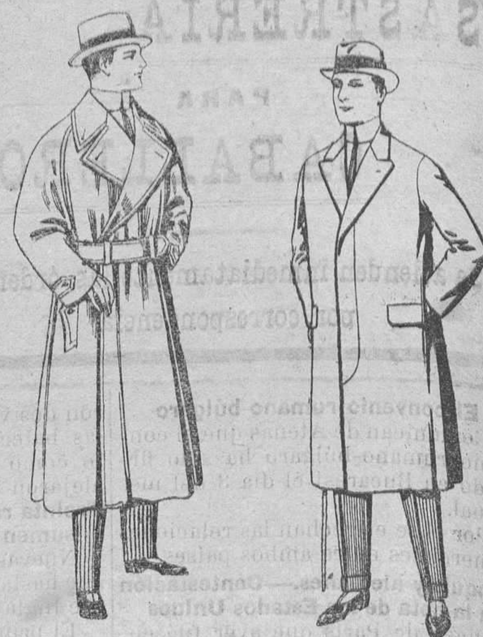
Cabanes impermeabilizados, color beige. De pesetas 65 a 110.