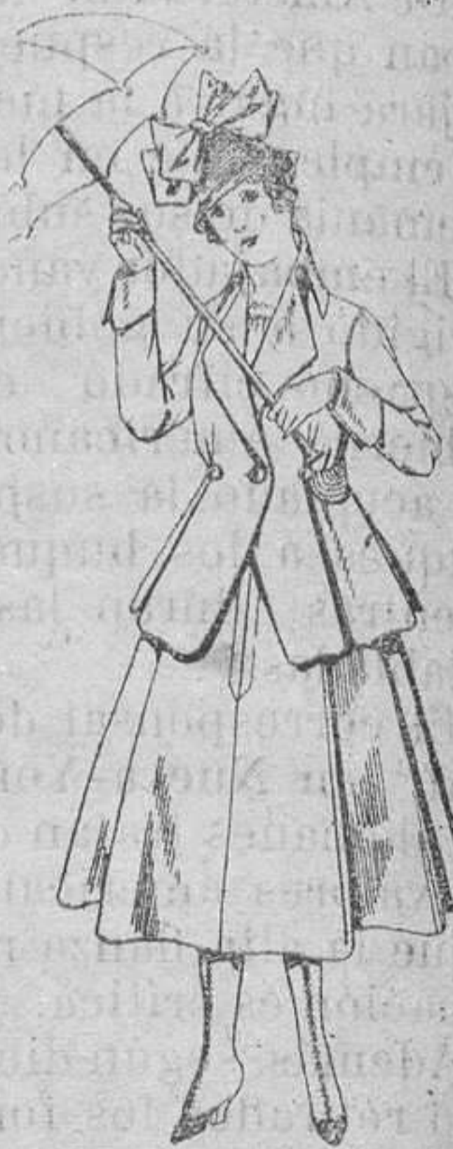
Trajes de lanilla para jovencitas de 13 a 16 años. De pesetas 53 a 55.

SUCURSALES: Madrid, Barcelona, Alicante, Almería, Bilbao, Cádiz, Cartagena, Gijón, Granada, Málaga, Palma de Mallorca, Sevilla, Valencia, Valladolid, Zaragoza