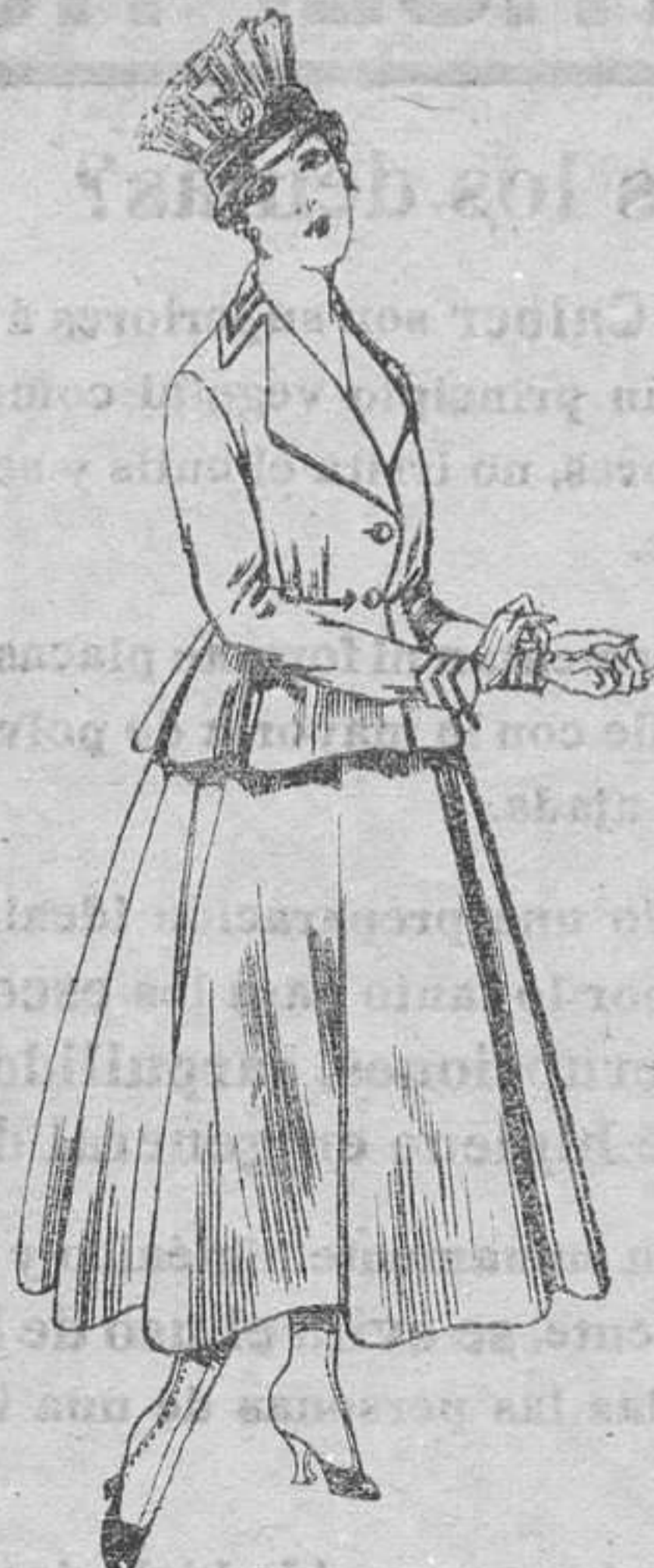
Trajes de lanilla para señora, a pesetas 80.