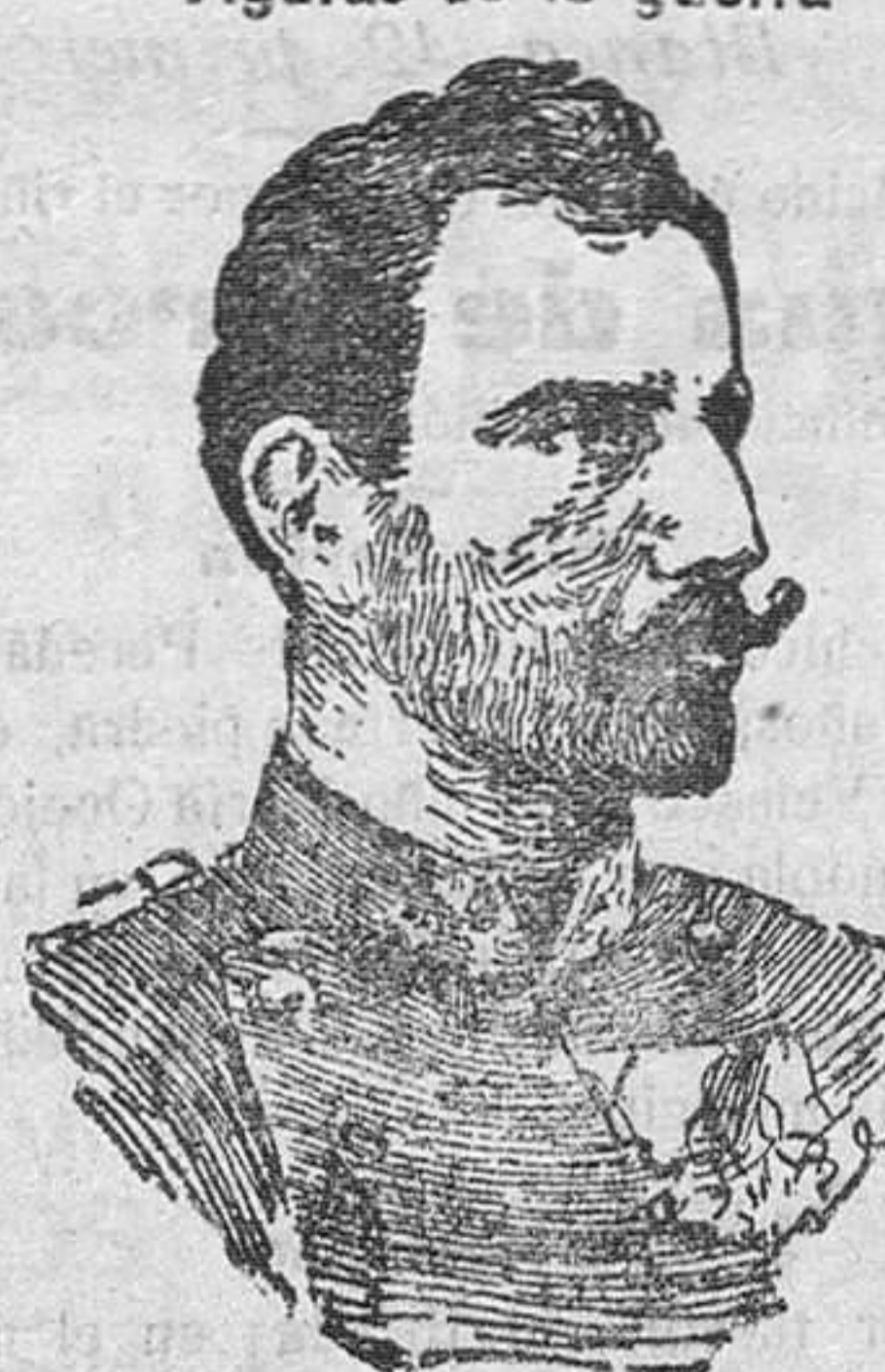
El archiduque Eugenio, nuevo generalísimo del ejército austro-húngaro