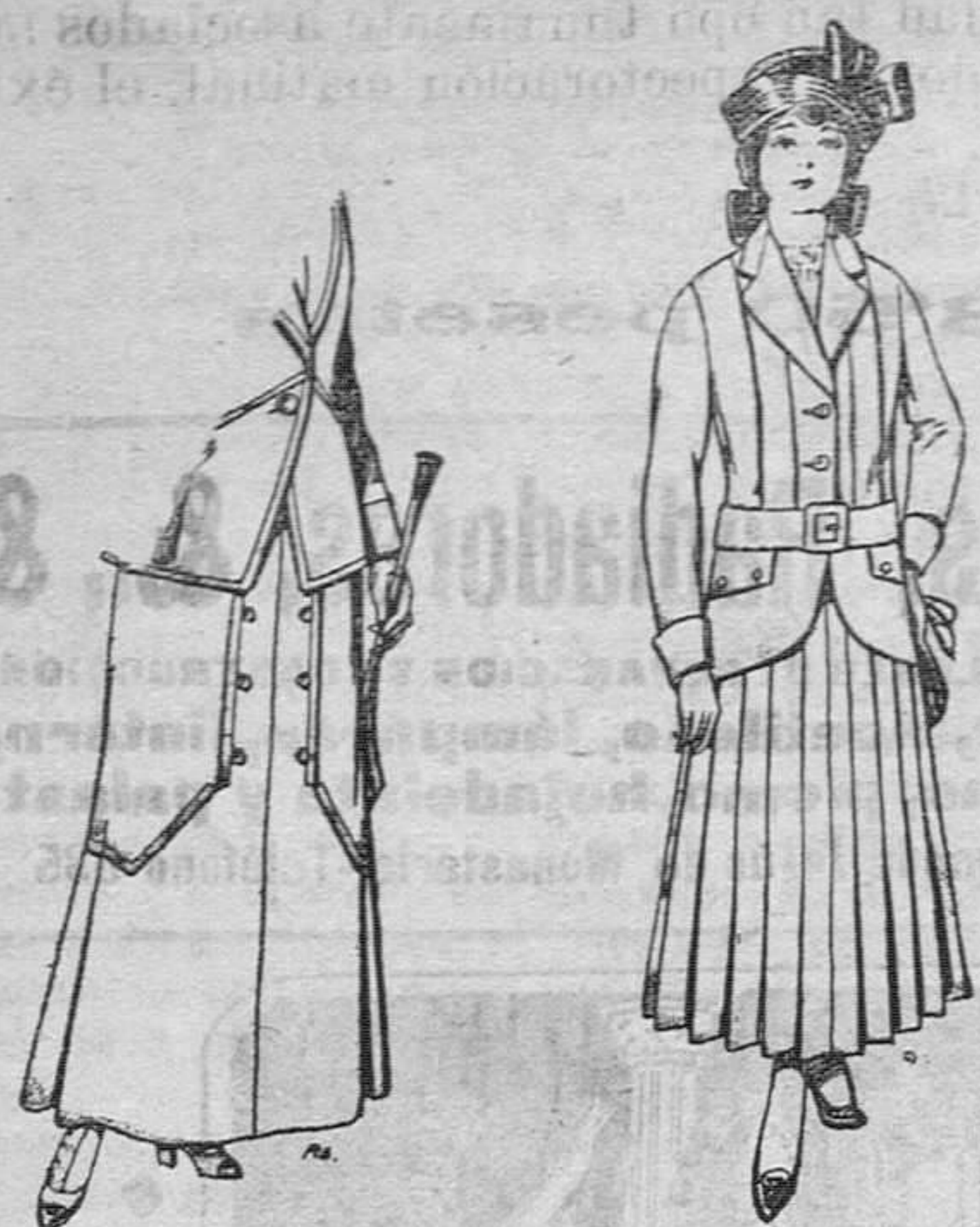
Trajes de lana negra azul y color para señora a pesetas 55

Madrid, Barcelona, Alicante, Almería, Bilbao, Cádiz, Cartagena, Gijón, Granada, Málaga, Palma de Mallorca, Sevilla, Valencia, Valladolid y Zaragoza