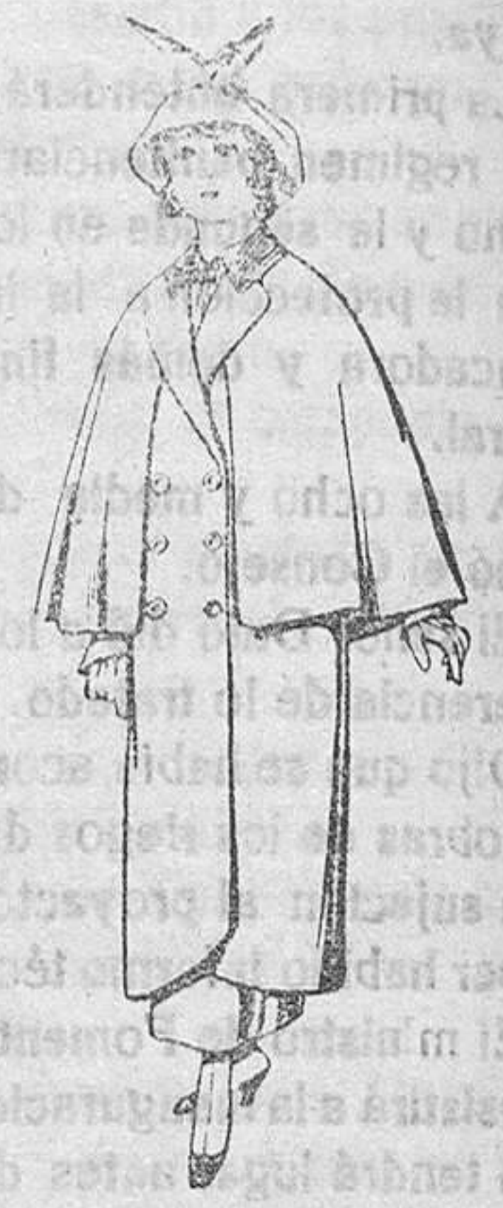
Abrigos de paten colores novedad para jovencitas de 10 a 16 años De Pts. 35 a 40

SECCIONES: Pelotería, Camisería, Géneros de Punto, Corbatería, Guantería, Sombrerería, Zapatería, Paraguas, Bastones y Artículos de Viaje.