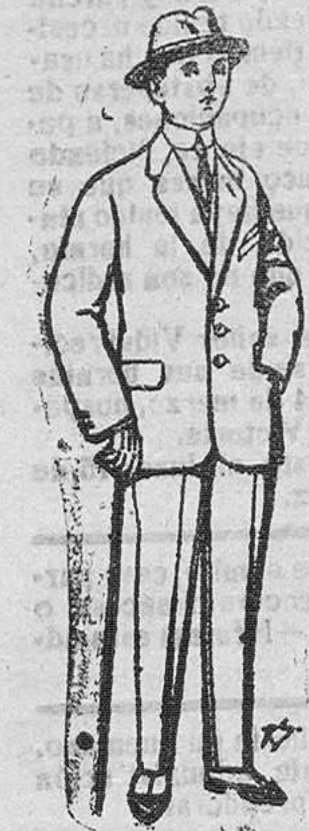
Trajes de paten para niños de 10 a 18 años De Pts. 13 a 48