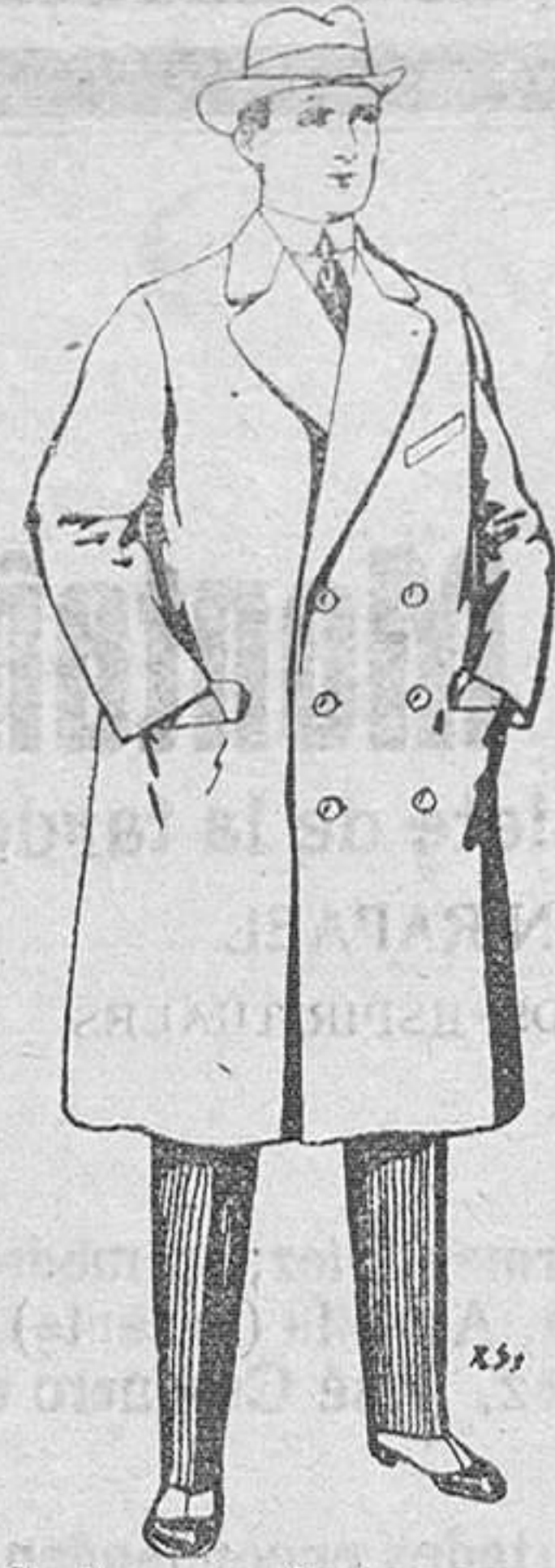
Gabanes de paten y cheviot. De Pts. 55 a 105