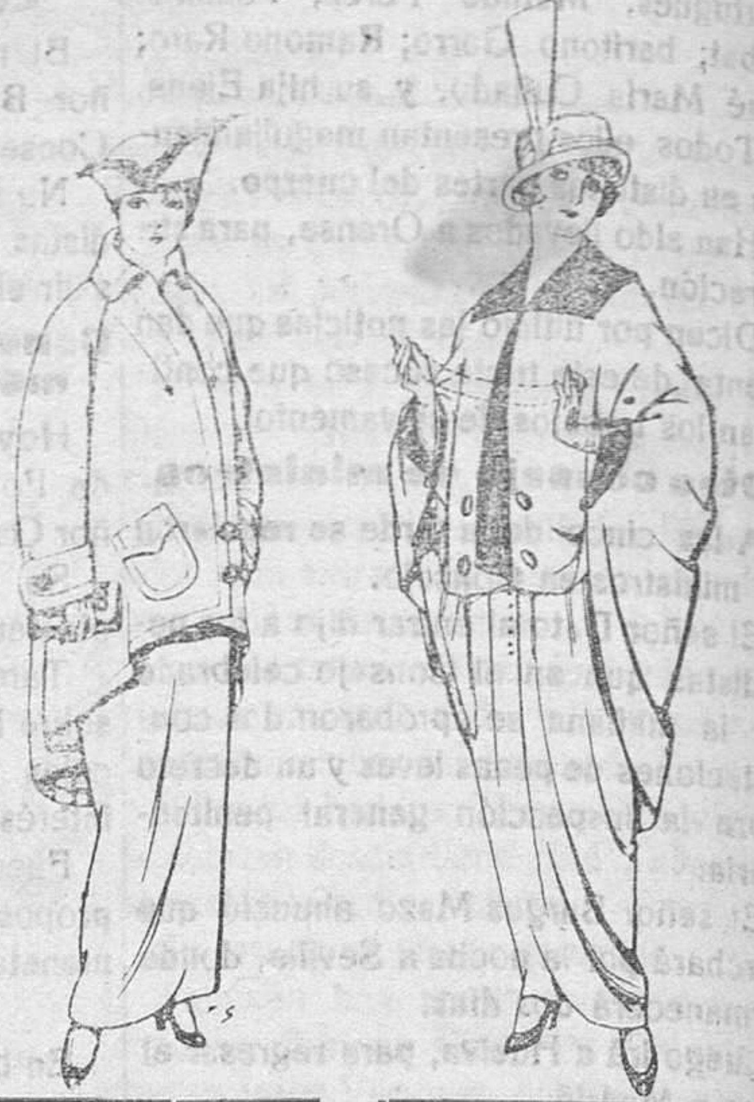
Abrigos de paten para Señora De Pts. 40 a 50