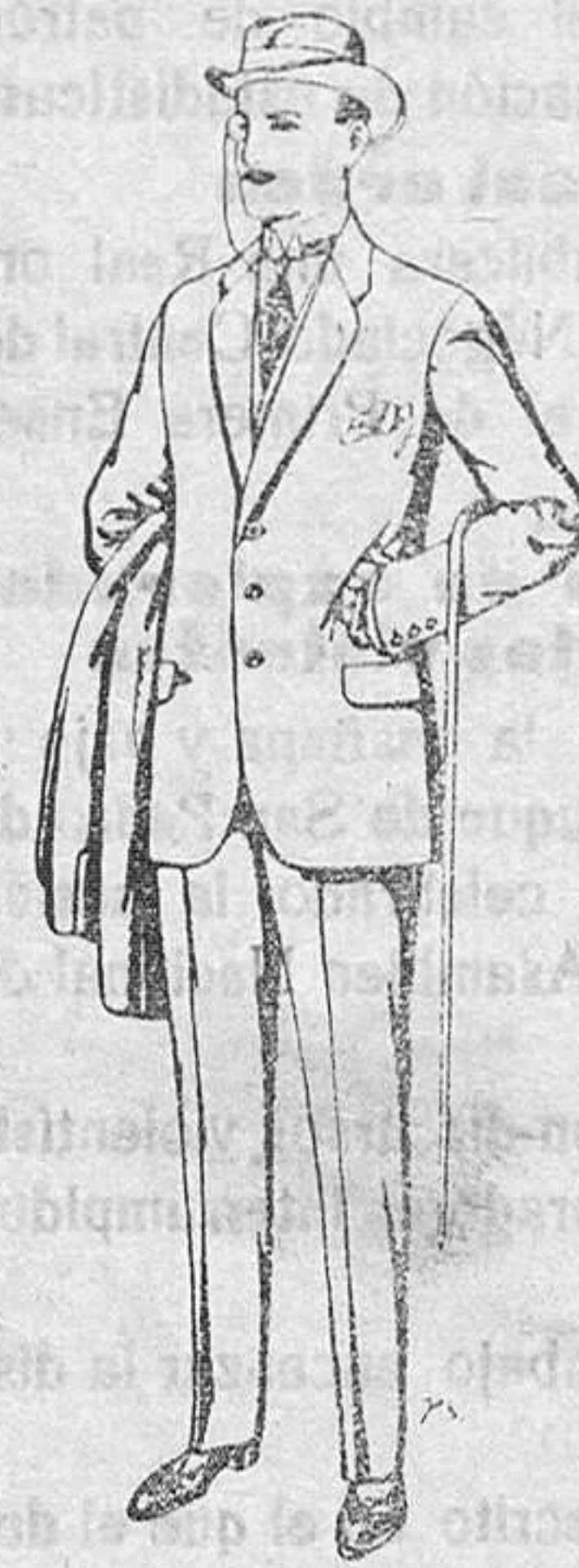
Trajes de paten cheviot, etc. De Pts. 17,50 a 70