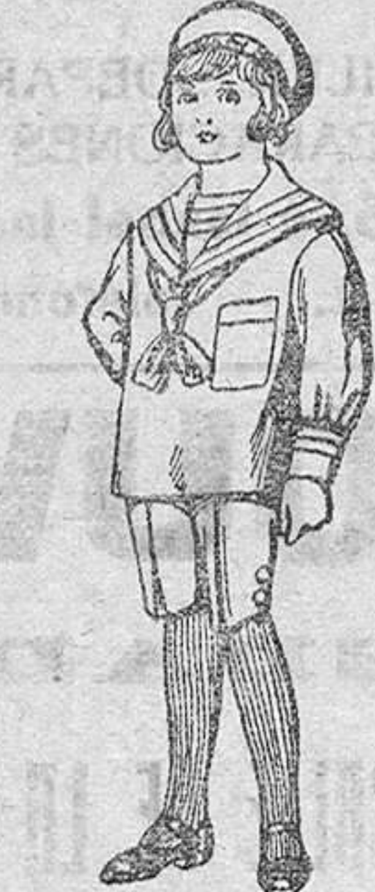
Trajes de jerga azul y negro para niños de 4 a 9 años De Pts. 20 a 22

SECCIONES: Peletería, Camisería, Géneros de Punto, Corbatería, Guantería, Sombrerería, Zapatería, Paraguas, Bastones y Artículos de Viaje.