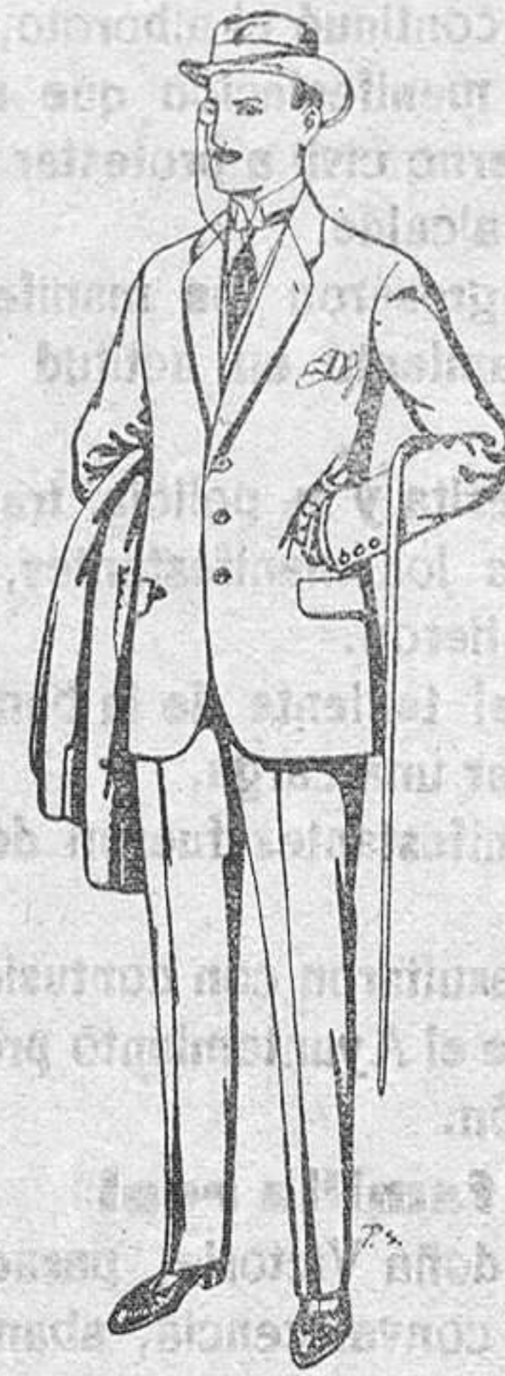
Trajes de paten cheviot, etc. De Pts. 17,50 a 70