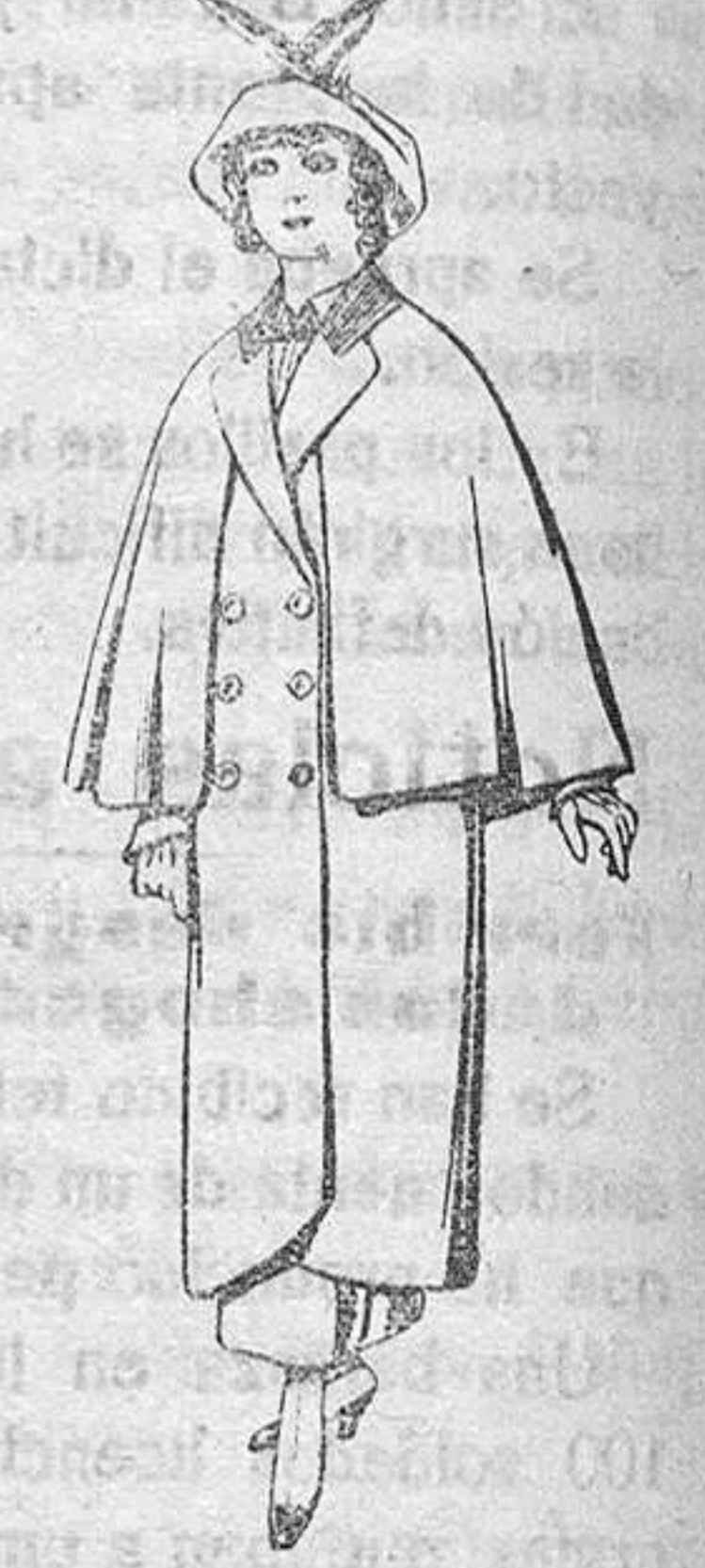
Abrigos de paten colores para jovencitas de 18 a 16 años De Pts. 35 a 40