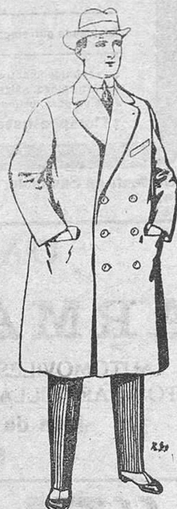
Gabanes de paten y cheviot. De Pts. 55 a 105