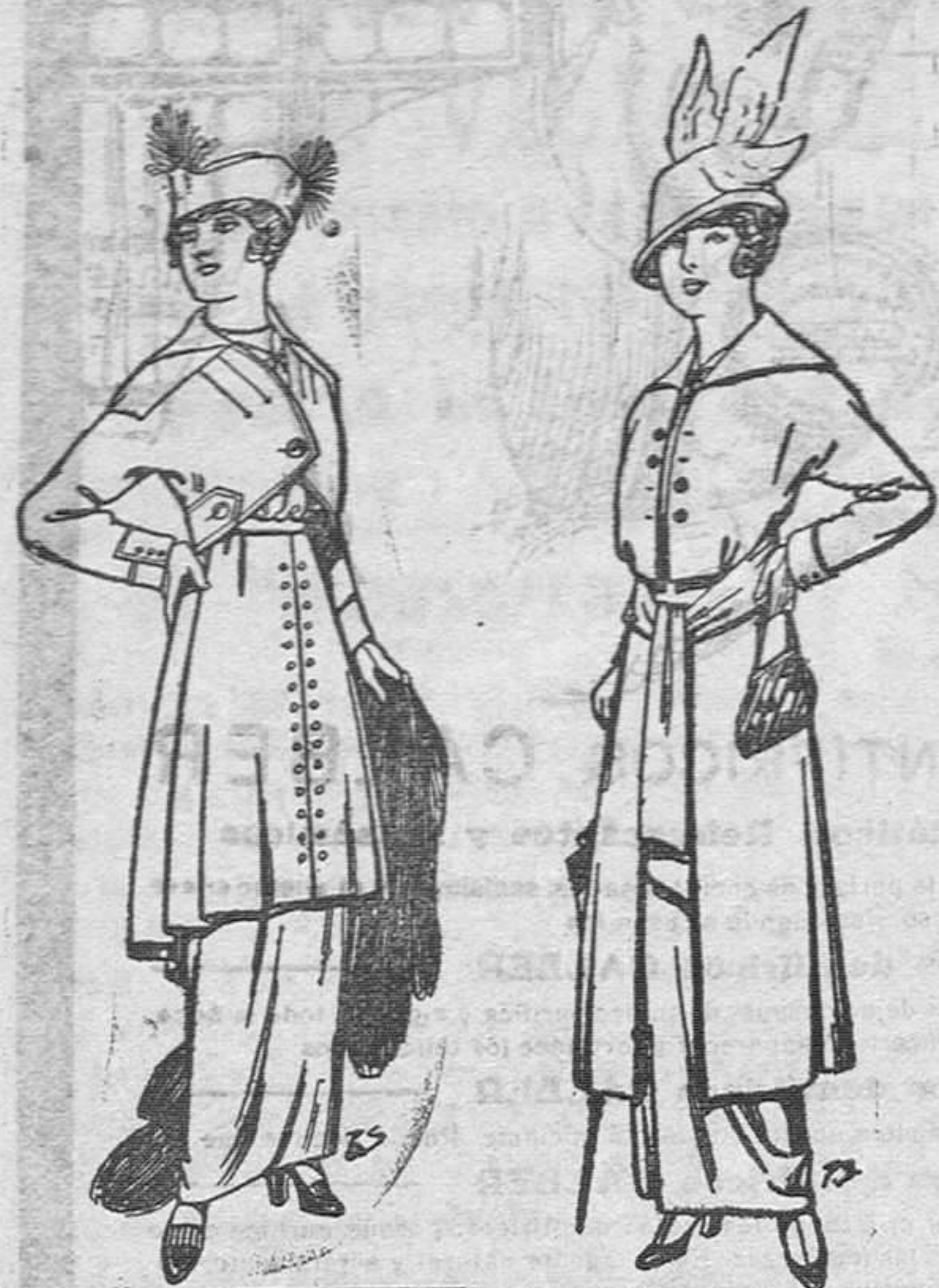
Trajes de jerga nigray azul Pts. . . 55