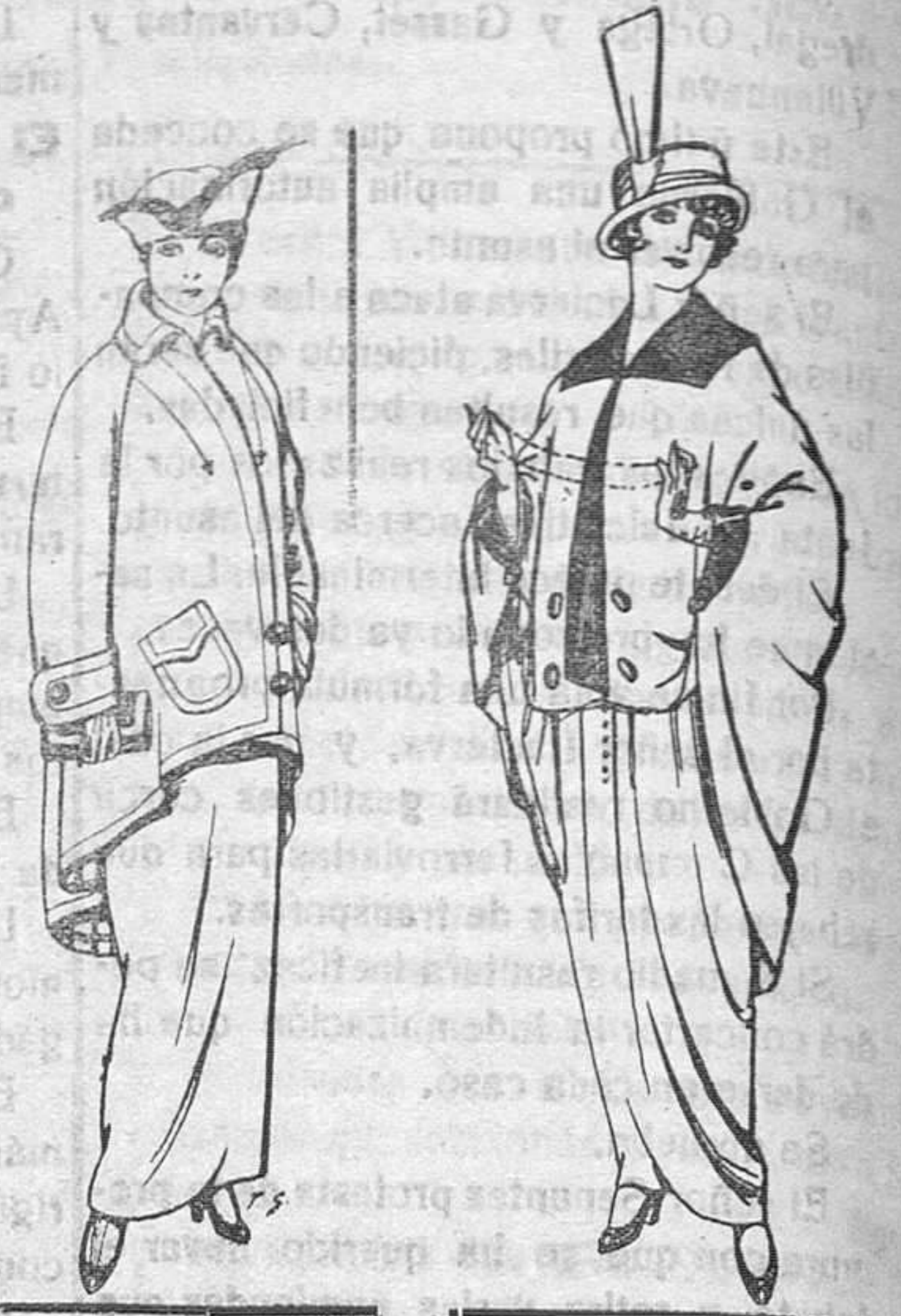
Abrigos de paten para Señora De Pts. 40 a 50