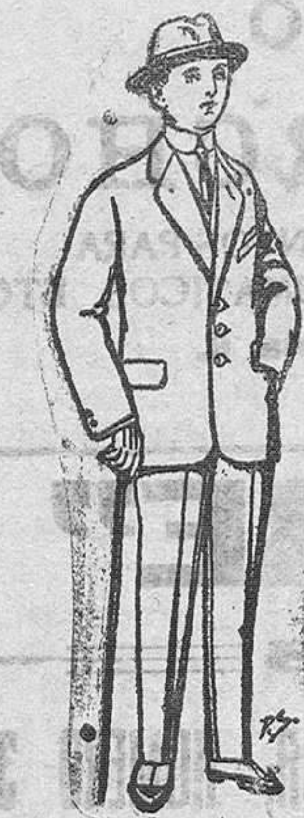
Trajes de paten vioy negro para niños de 10 a 18 años De Pts. 13 a 48