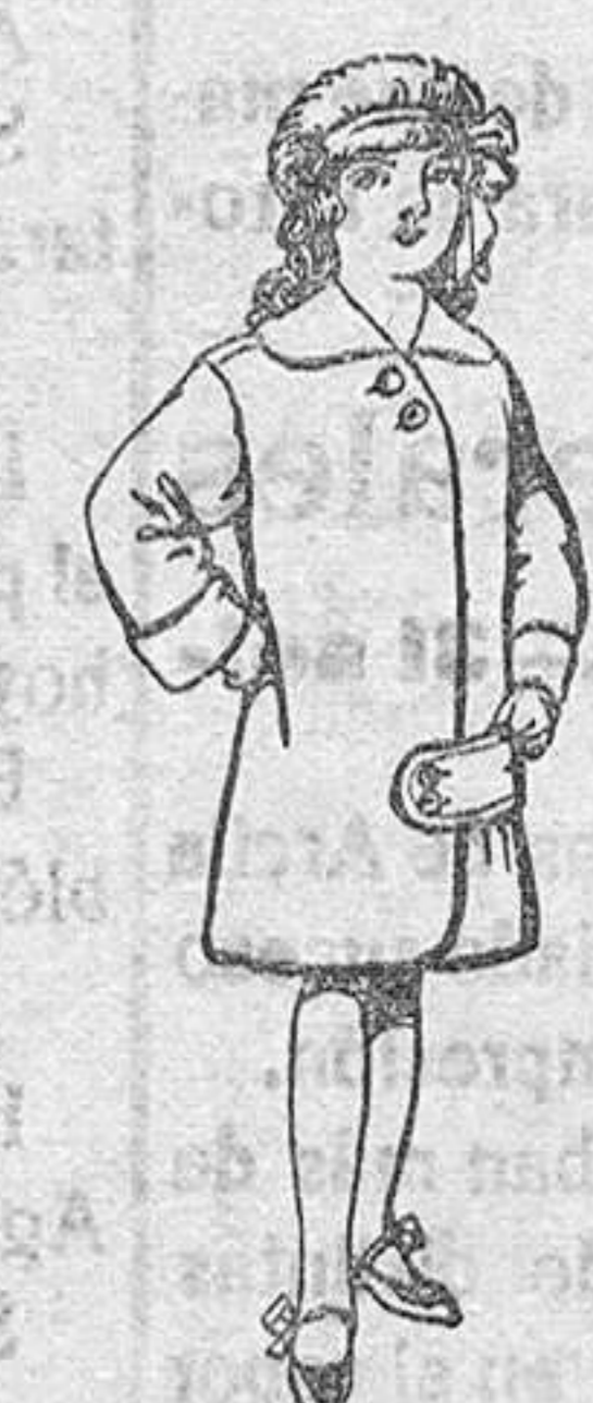
Abrigos de paten para niños de 4 a 9 años De Pts. 20 a 28

SECCIONES: Peletería, Camisería, Géneros de Punto, Corbatería, Guantería, Sombrerería, Zapatería, Paraguas, Bastones y Artículos de Viaje.