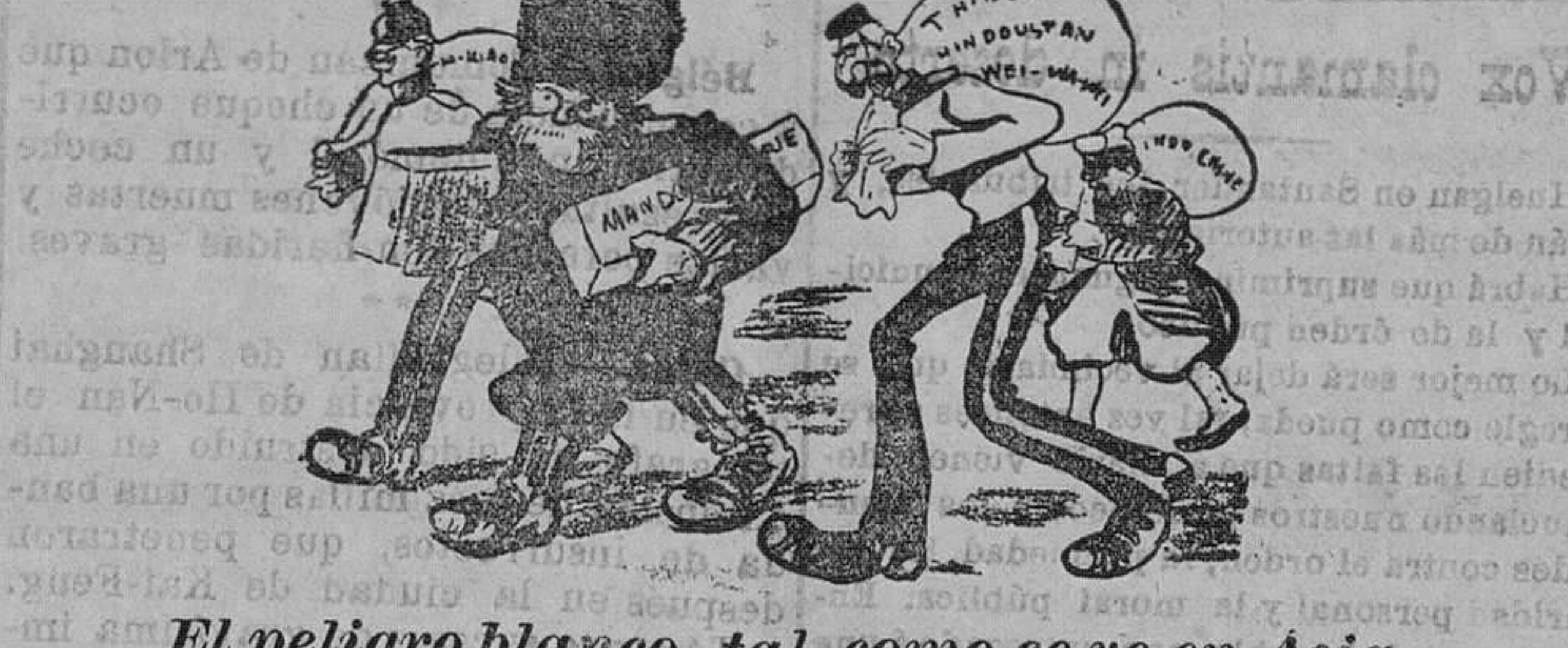
El peligro blanco, tal como se ve en Asia