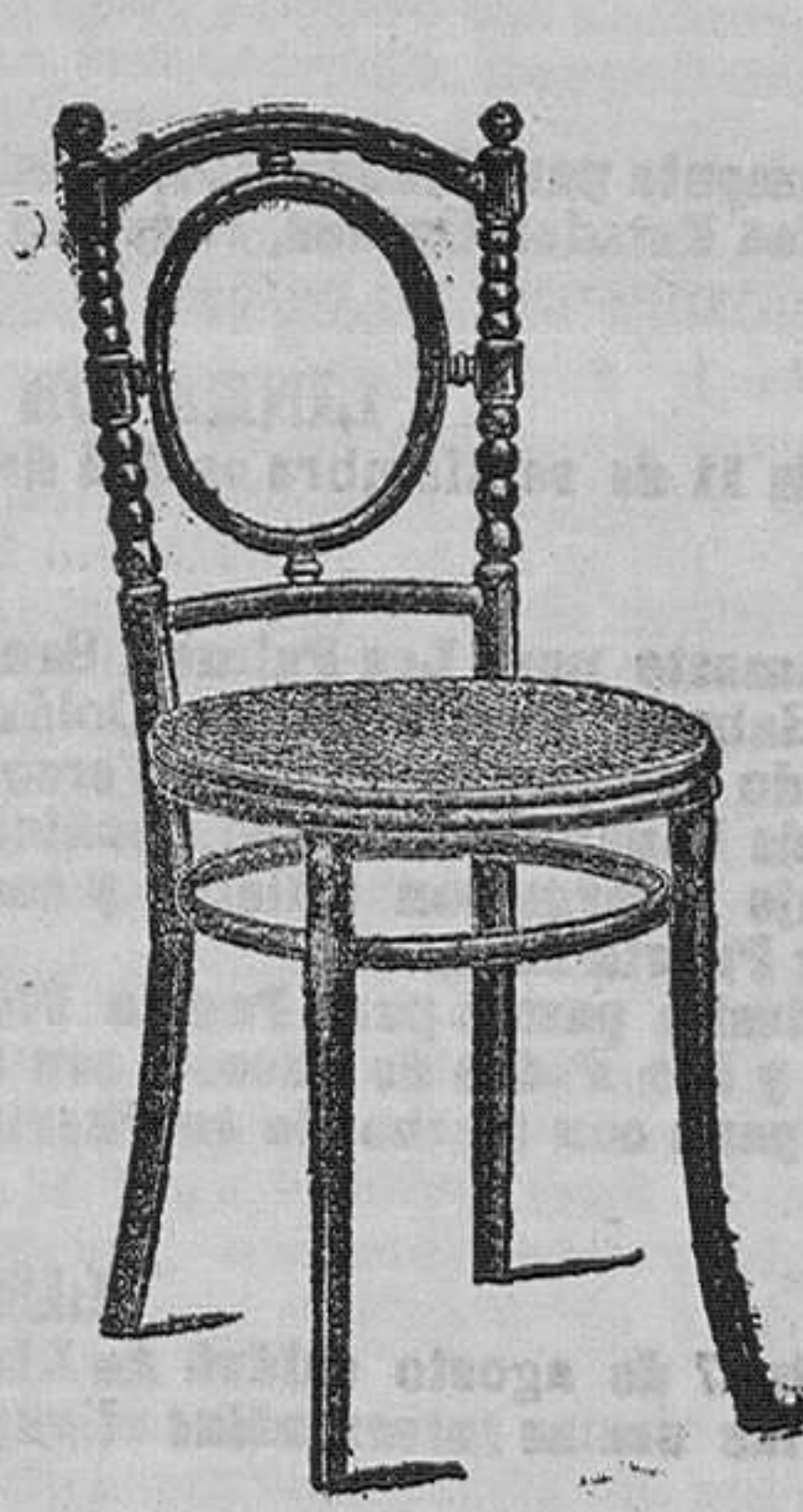
Grandes Almacenes de Muebles