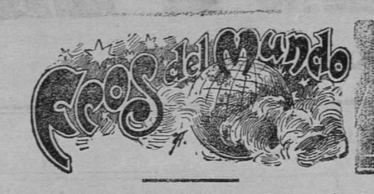
El reloj de Bolonia.—El mundo en el año 2001.—Símiles curiosos.

una obra monumental, yendo al Español á aplaudirla, mandando proceder para averiguar si el inspector...?