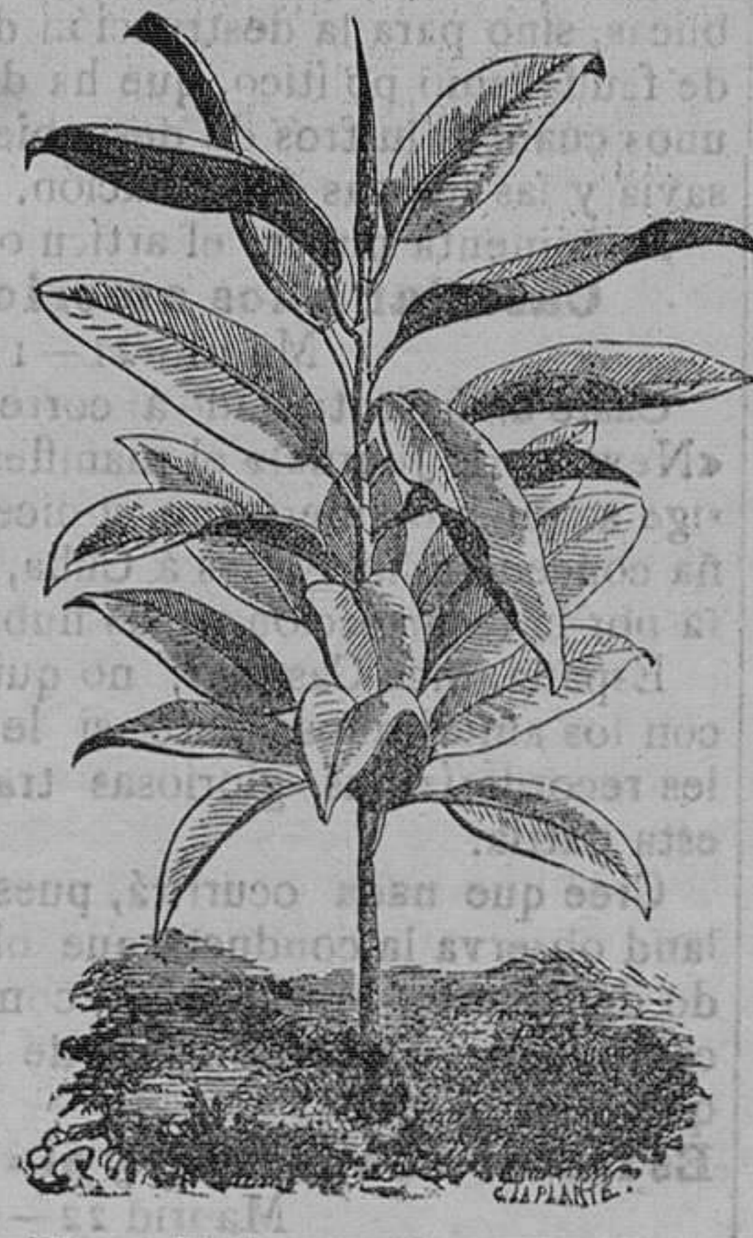
Ficus elástica cachu.—Elegantes plantas para salones.—De 3 a 10 pesetas una.

Vende cuarenta mil vegetales de 200 variedades de árboles frutales, alta noredad.—100 variedades de árboles de sombra y maderables.—400 variedades de arbustos de adorno y floríferos.—600 variedades de cebollas y tubérculos en flor.—200 variedades de plantas en trestos para canastillas y salones, trasados y plantaciones de parques y jardines, a precios módicos.—Remite catálogos gratis a quien los pida.