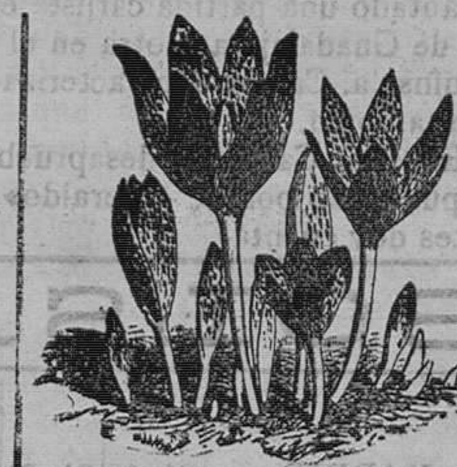
Colchicon color de rosa.—Viva, rara, florece dentro de un papel. Pieza, 1 peseta; docena, 7 pesetas.