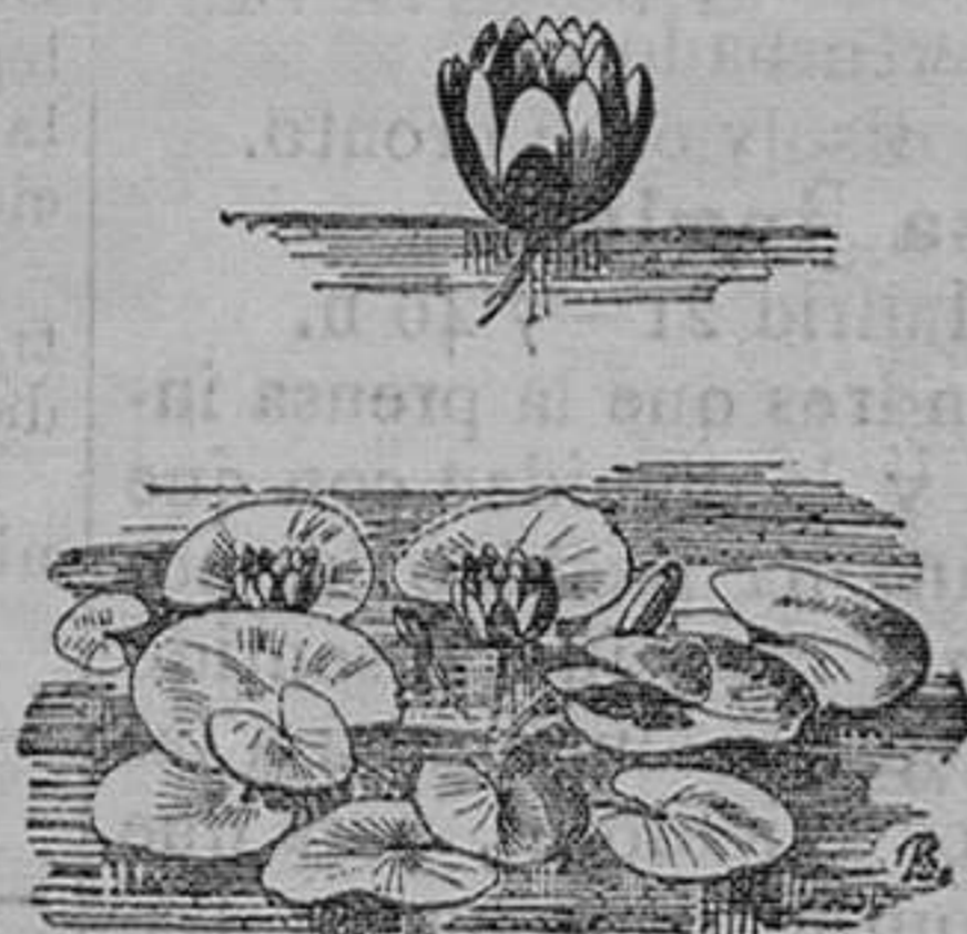
Ninfia de flor blanca pura, planta acuática.—Pieza, 1 peseta 25 céntimos; la docena, 10 pesetas.

Vende cuarenta mil vegetales de 200 variedades de árboles frutales, alta noredad.—100 variedades de árboles de sombra y maderables.—400 variedades de arbustos de adorno y floríferos.—600 variedades de cebollas y tubérculos en flor.—200 variedades de plantas en trestos para canastillas y salones, trasados y plantaciones de parques y jardines, a precios módicos.—Remite catálogos gratis a quien los pida.