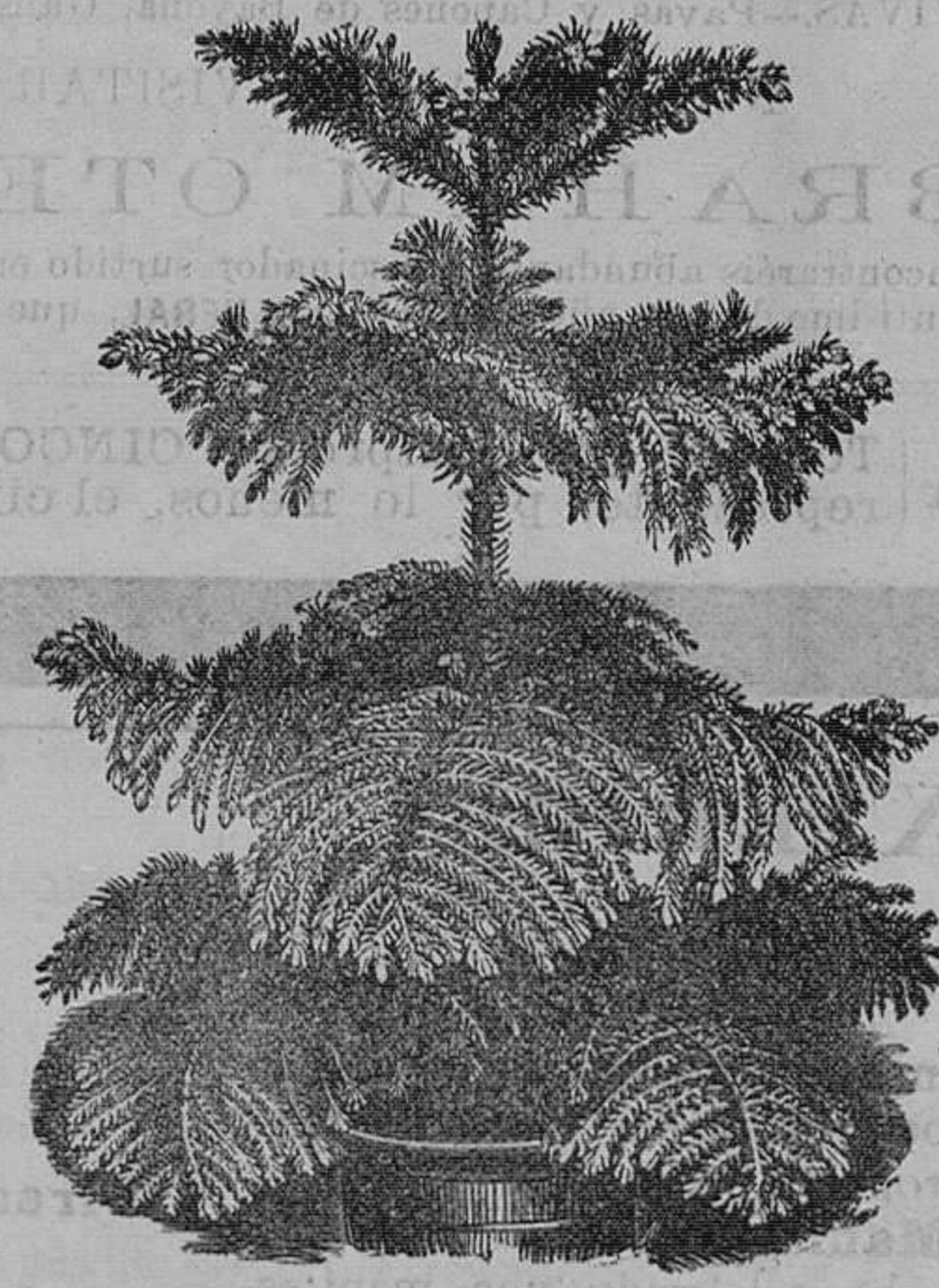
Arancaria excelsa.—Bellas plantas para salones y demás.—Pieza, de 6 a 10 pesetas.

Catálogo de cebollas y tubérculos de flores, gratis a quien los pida.