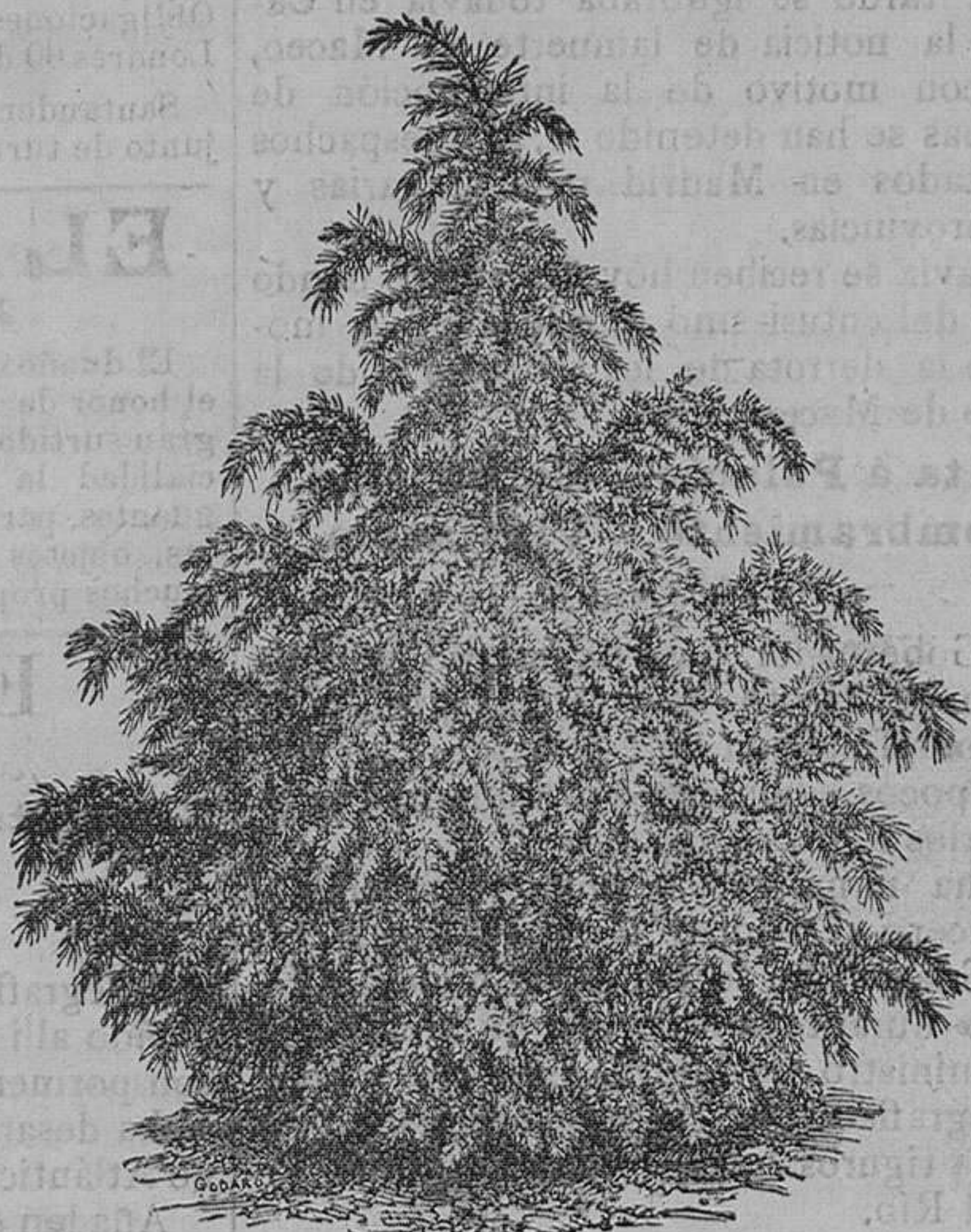
Cedro de Odra Robusta: pieza, de 1 peseta á 10 pesetas. Idem de Líbano: pieza, de 1.50 pesetas á 10 pesetas.

Vende cuarenta mil vegetales de 200 variedades de árboles frutales, alta novedad.—100 variedades de árboles de sombra y maderables.—400 variedades de arbustos de adorno y floríferos.—600 variedades de cebollas y tubérculos en flor.—200 variedades de plantas en tientos para canastillas y salones, trazados y plantaciones de parques y jardines, á precios módicos.—Remite catálogos gratis á quien los pida.