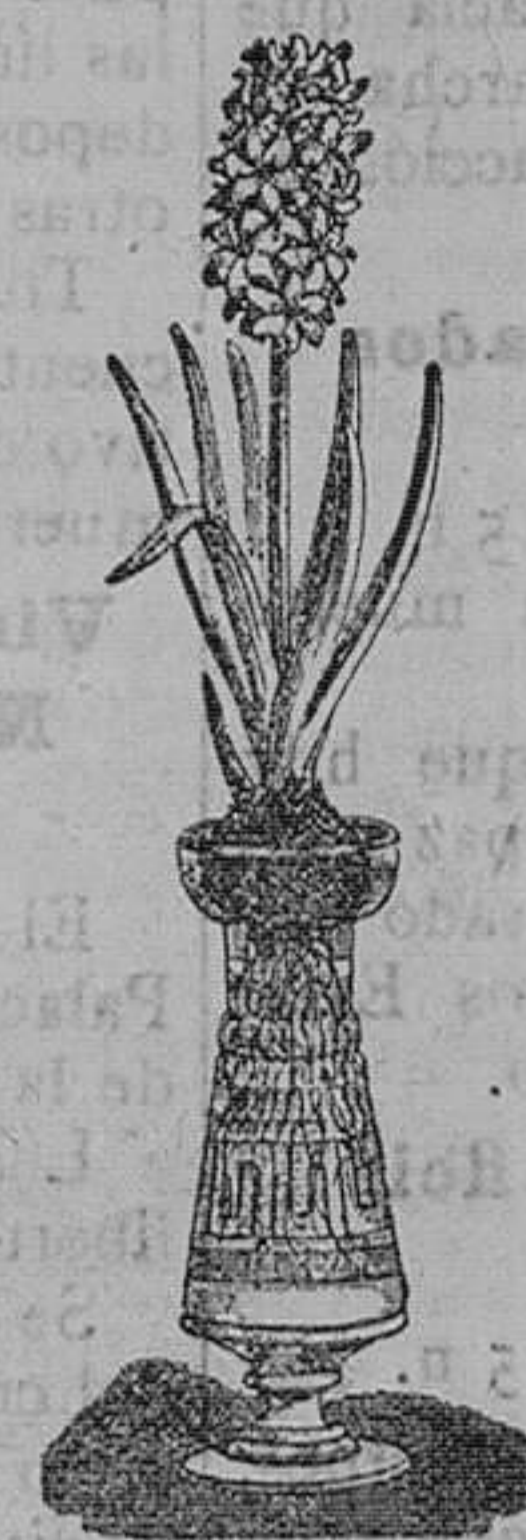
Jacintos variados dobles para agua. Pieza, 1 peseta. Idem con botella, tas.—Idem Latania Borbónica: pieza, de 2 bonito modelo, pesetas pieza.