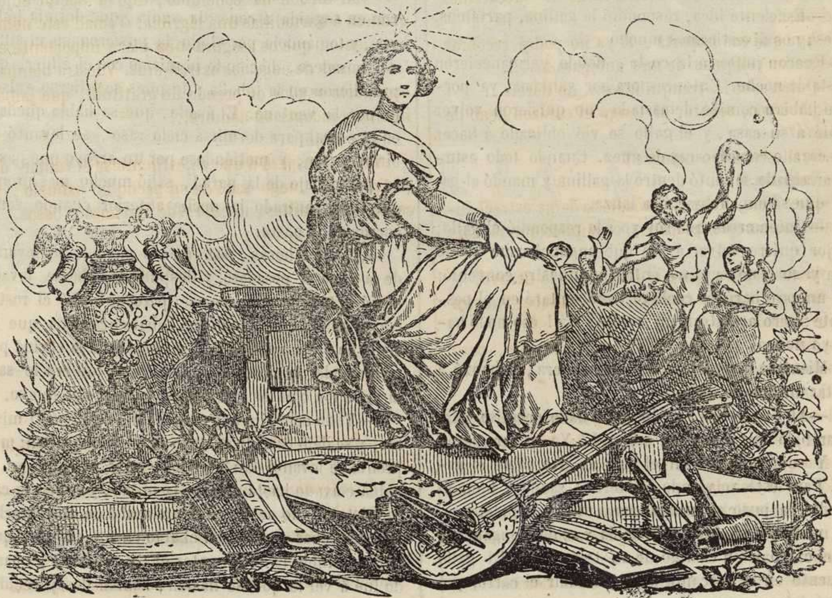
Las bellas Artes.

En Europa , el espíritu es mas vivo , el cuerpo mejor formado y lleva el sello de una noble armonía: en esto se conoce la influencia de las artes, que dejan por donde pasan la huella de su afición á todo lo bello, y de sus tendencias á la perfeccion , porque las artes , no sola procuran imitar á la naturaleza en sus bellas creaciones, sino realzarla y sobrepujarla : por