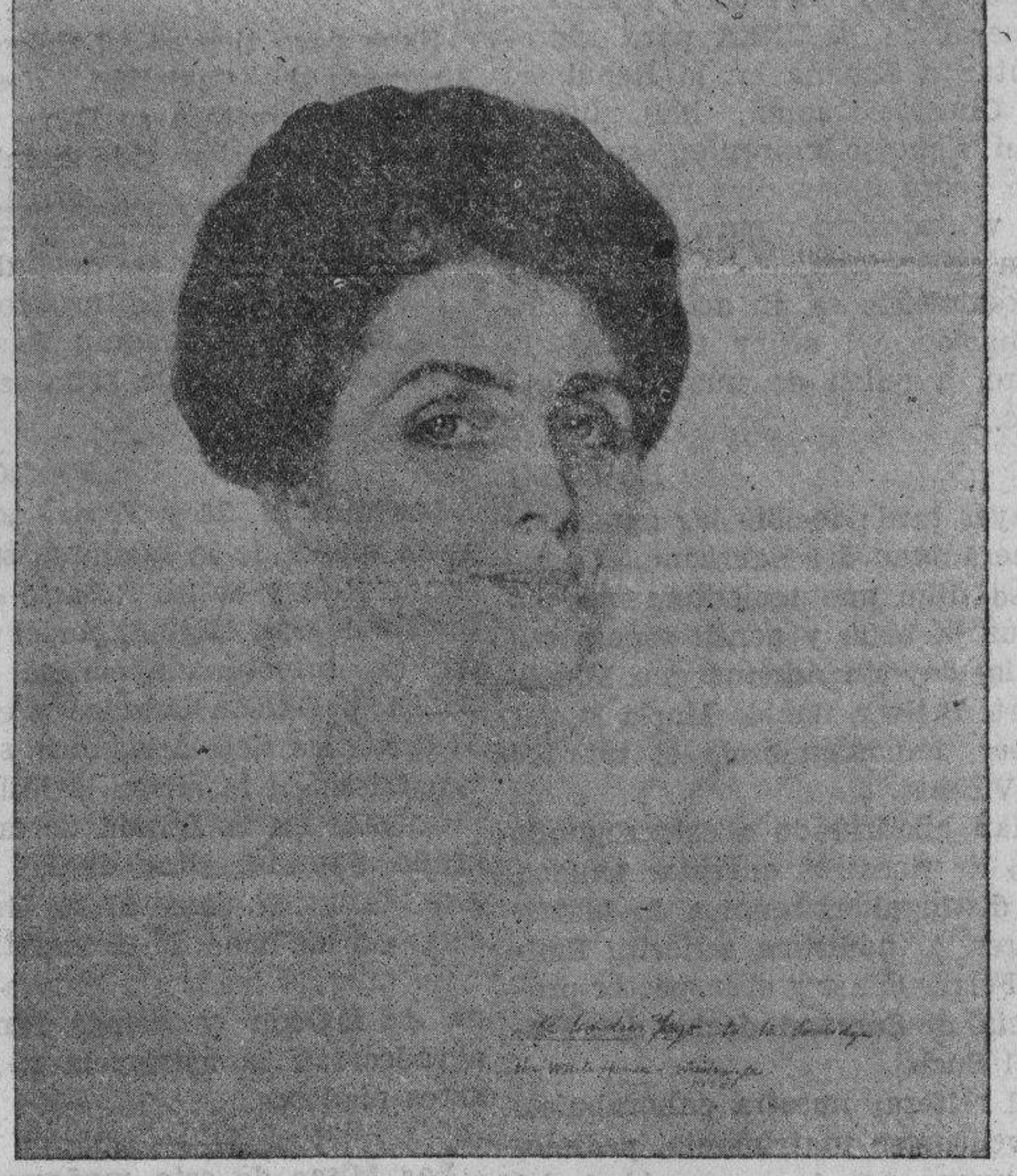
MRS. CALVIN COOLIDGE Esposa del expresidente de los Estados Unidos (Por Rafael Sanchis Yago) Retrato adquirido por el Museo de Hispanic Society de América (New-York)