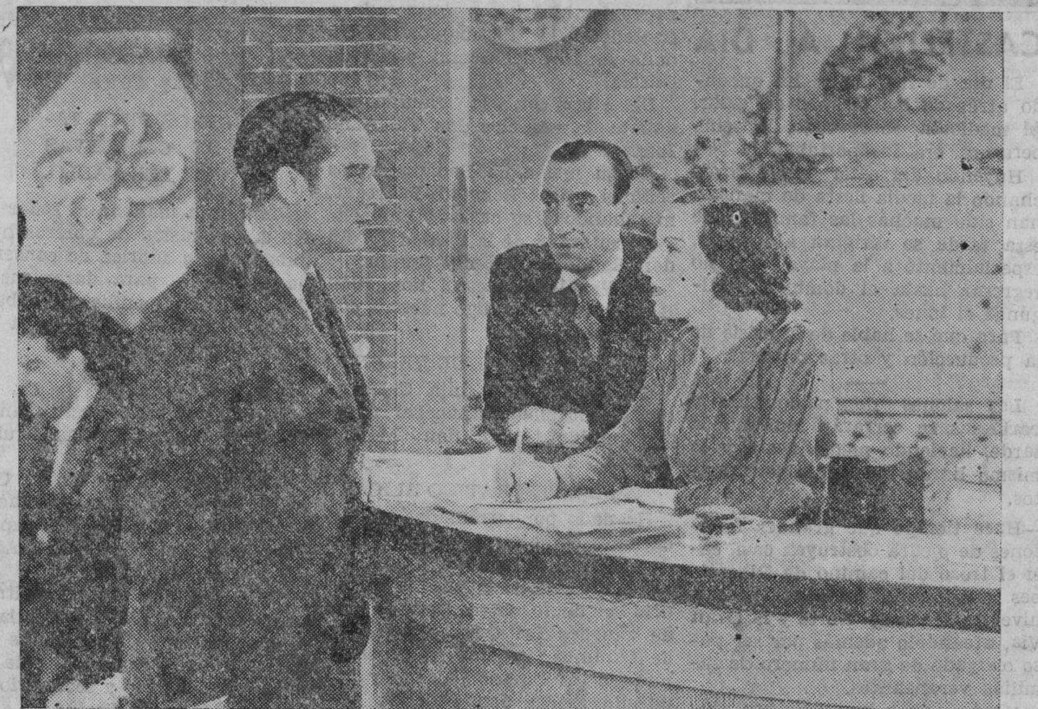
Una escena de la película "LA HERMANA SAN SULPICIO" que CIFESA presentará en la temporada próxima. Los exteriores de dicho film, han sido rotados en los magníficos terrenos del Balneario de los Hervideros de Cofrentes. (Foto Arguellas).

Los seis primeros meses de su vida el niño no debe tomar otro alimento que leche. La lactancia más beneficiosa para el niño es la natural. La leche de la madre pertenece al hijo, y no debe privarse de ella más que por consejo médico. Todas las madres, en general, pueden criar con sus pechos a su hijo; la que no puede totalmente, puede hacerlo en parte. La lactancia artificial sólo debe ser utilizada ante la imposibilidad absoluta de crianza por la madre. Las madres que crían deben seguir los siguientes consejos: Primer. Acostumbrar al niño a mamar a horas fijas, resistiéndose al llanto del pequeño, y no darle el pecho para callarle, ni por la noche ni entre horas. Segundo. No tener al niño mamando más de quince minutos. Tercero. Utilizar solamente un pecho para cada teta. Cuarto. Lavarse los pechos con agua hervida o boricada antes y después de mamar el niño, y una vez al día, con alcohol de 90 grados, y luego secarles delicadamente. Quinto. Ordeñarse unas gotas antes de dar de mamar. Sexto. La mujer que cria no debe tomar bebidas alcohólicas y Séptimo. Al terminar el niño de mamar debe colocarse vertical, para facilitarle la salida del aire que traga, y acostarle en cuanto lo expulse por la boca. Las madres que crían deben tener en cuenta que no es posible una buena lactancia sin seguir los consejos arriba indicados. Doctor L. N. de C.