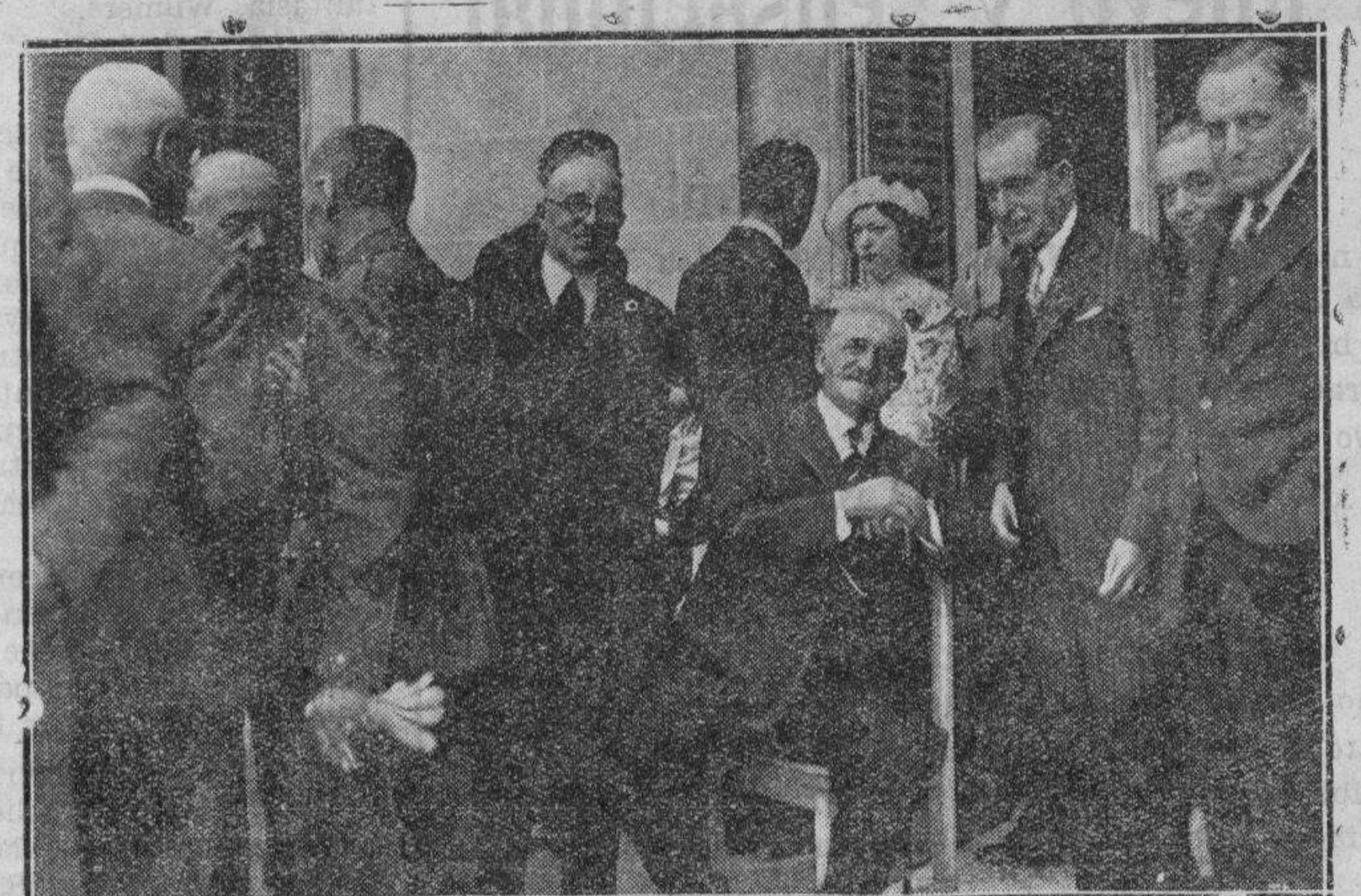
El conde de Romanones obsequia a los enviados del Toledo americano en su finca de Buenavista del Toledo español.