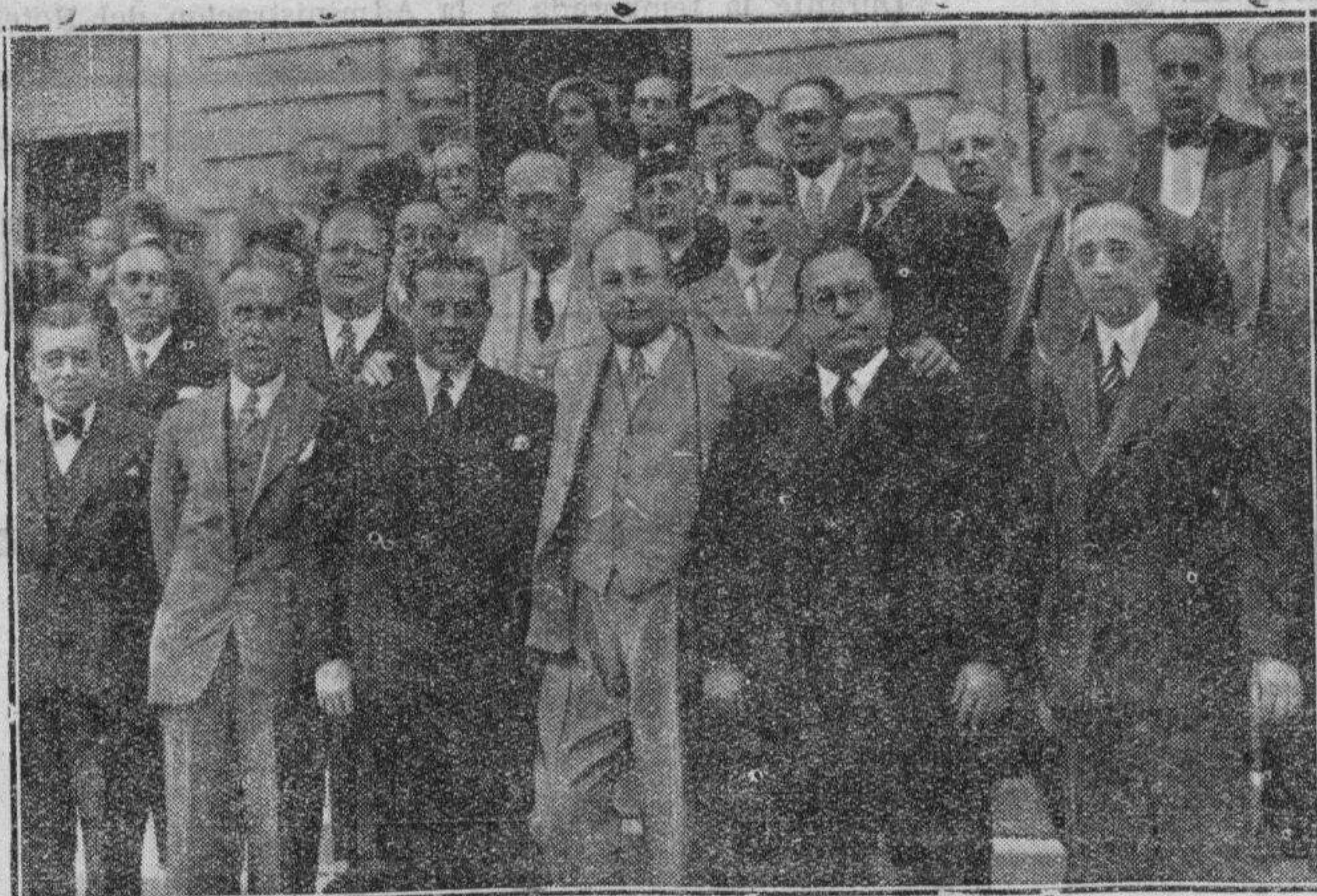
En la embajada de los Estados Unidos, ha tenido lugar una recepción en honor de los delegados de Toledo de Ohio (Estados Unidos) y de Toledo Español. El embajador norteamericano Mr. Bovers con los delegados de los dos Toledos.