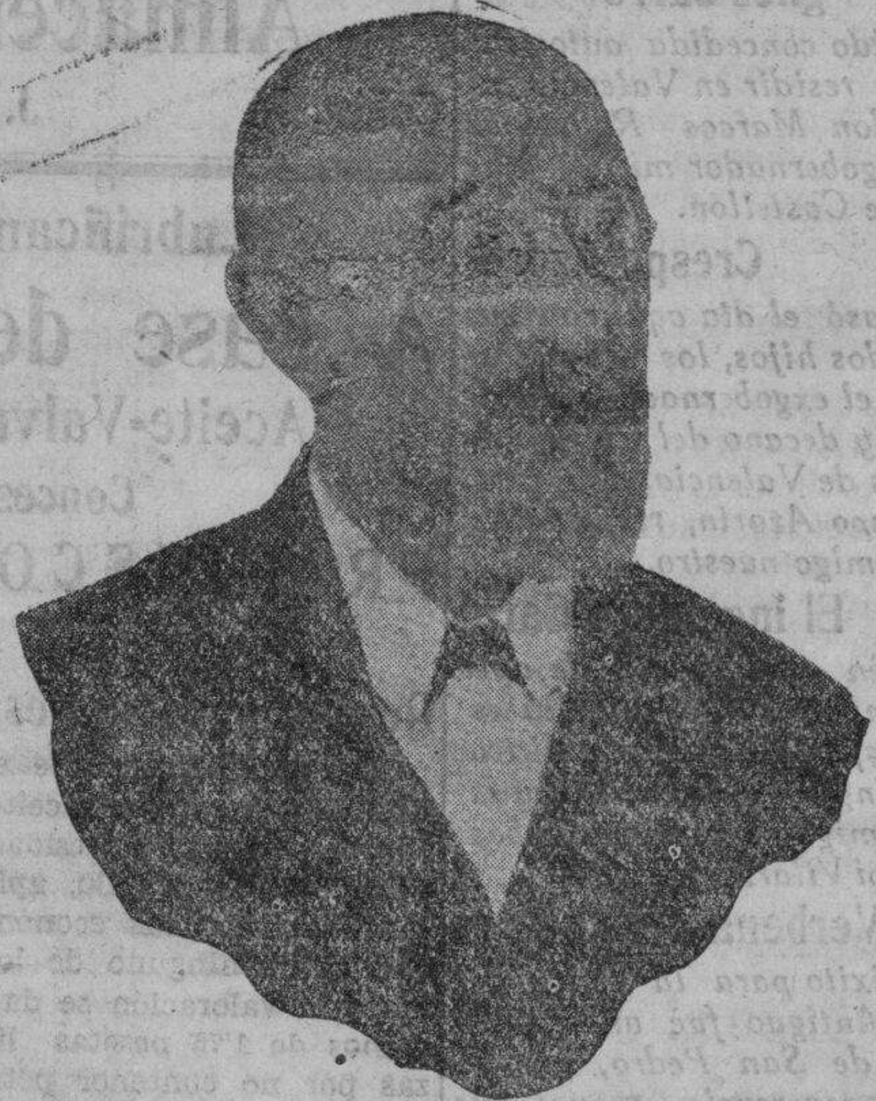
Don Fernando Gasset Lacasaña

culpa en el inexcrupulo o en el afán descarado por el poder, tuvo ayer dispuesta su organización propia pero la restante de la provincia, incluso la misma pobre y