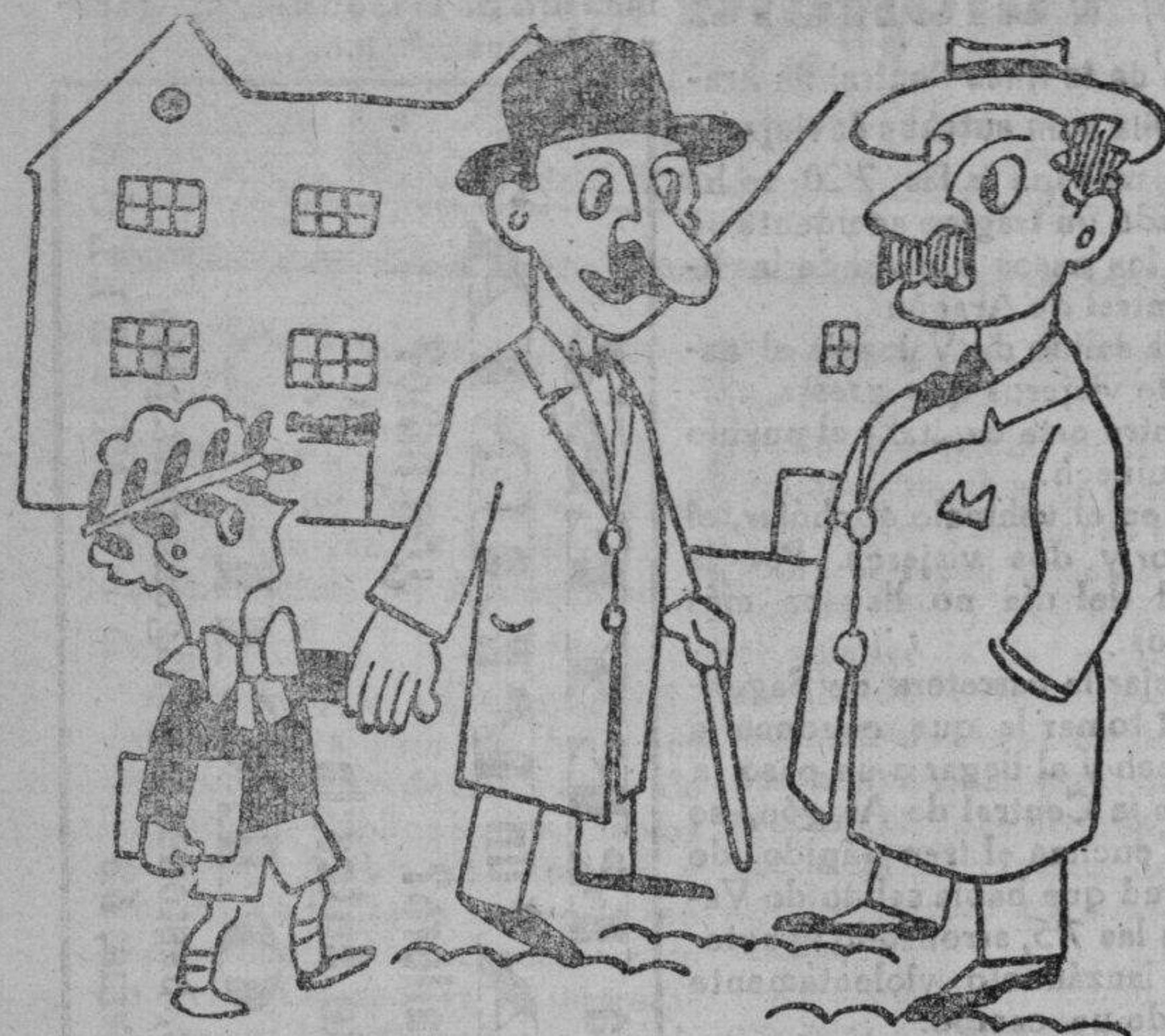
Las esperanzas en el chico

—Que, tu hijo promete, ¿eh? ¿Ya opera? —¡Ca, hombre! Todavía no ha llegado a hacerse una opereta.