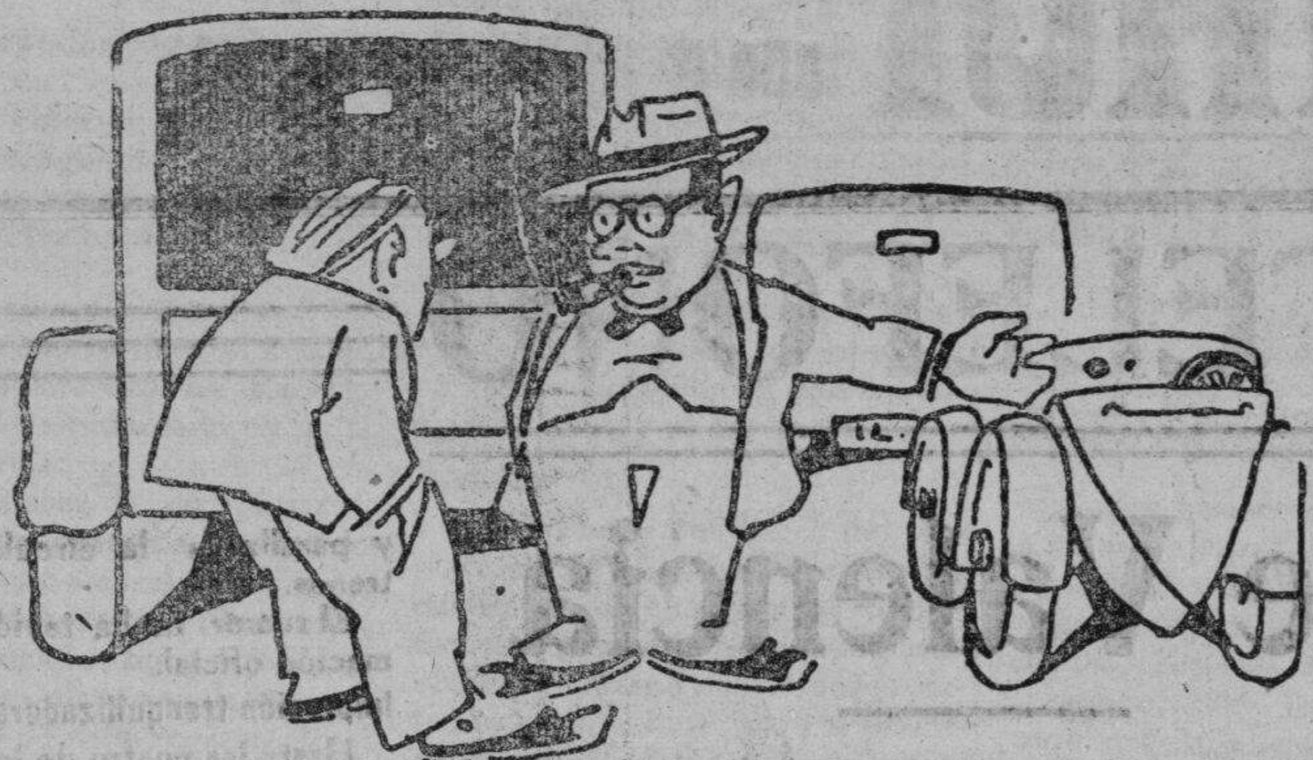
Un automóvil barato

el camión UNIC es garantía de buen servicio durante muchos años la amortización de su valor resulta mucho más económica y su beneficio más prolongado e. dávalos masip - castellón - calle cajal, 31