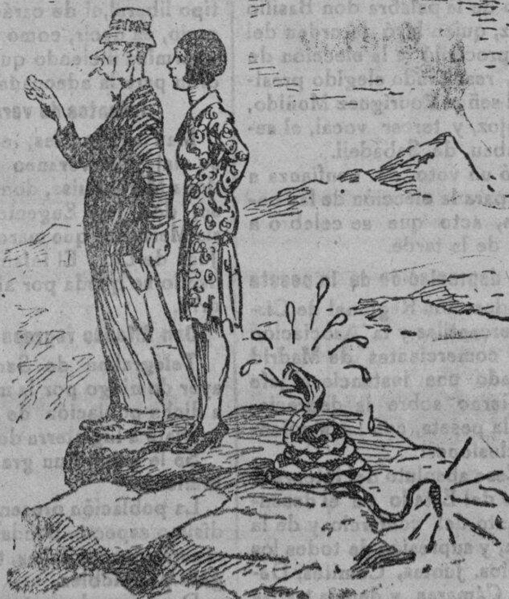
La piel de mamá

Este es lector, creemos deducir, el ambiente que se produjo alrededor de la Asamblea llevada a cabo el pasado sábado.