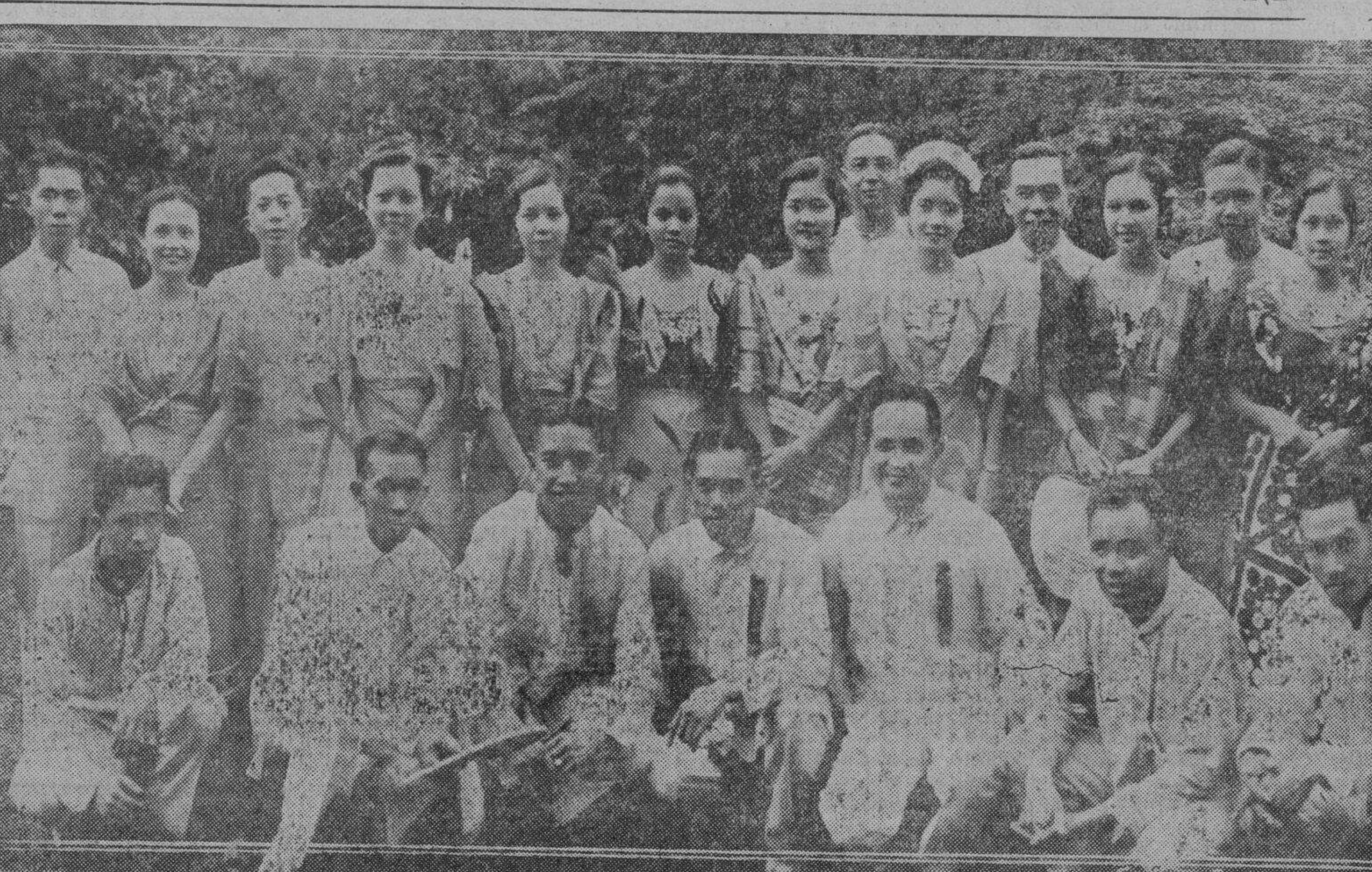
Miembros del comité organizador del Nucleo Solteril, a cuyos esfuerzos y actividad se debe el resonante éxito del 'salo-salo'...