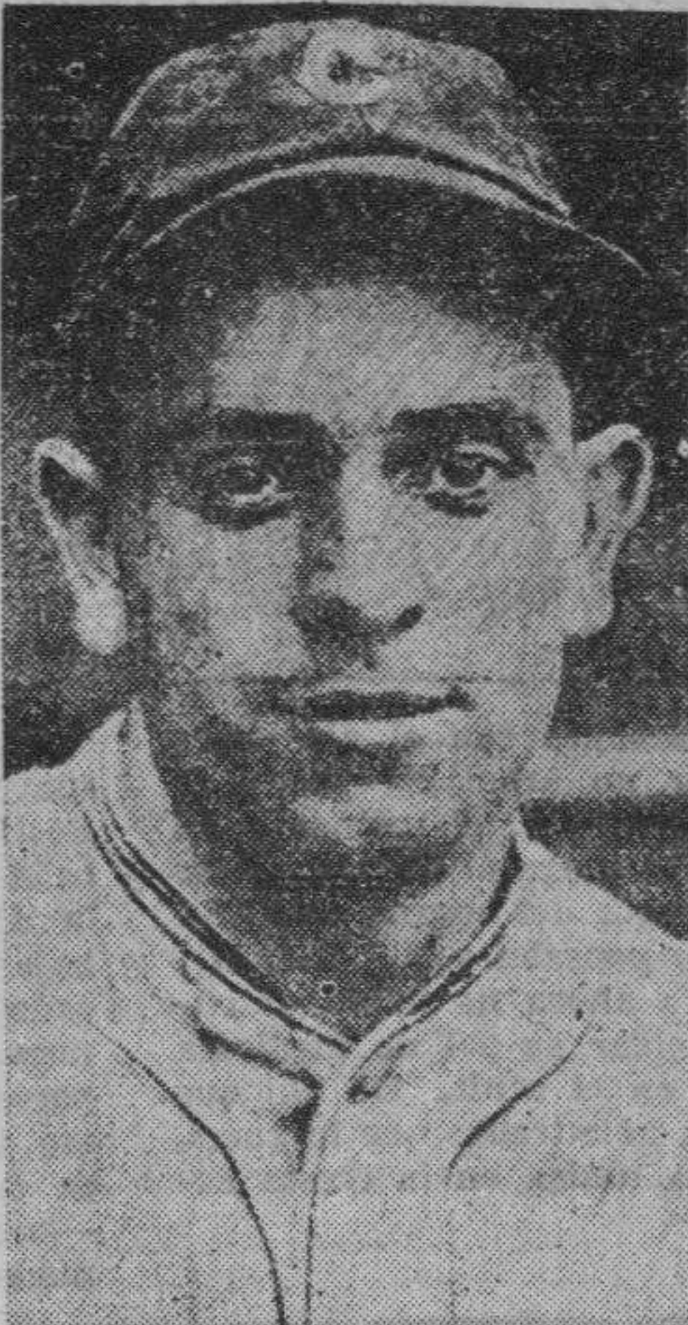
EARL AVERILL Que se lucio por el equipo de Babe Ruth en el segundo partido en el Japon registrando dos "homers".