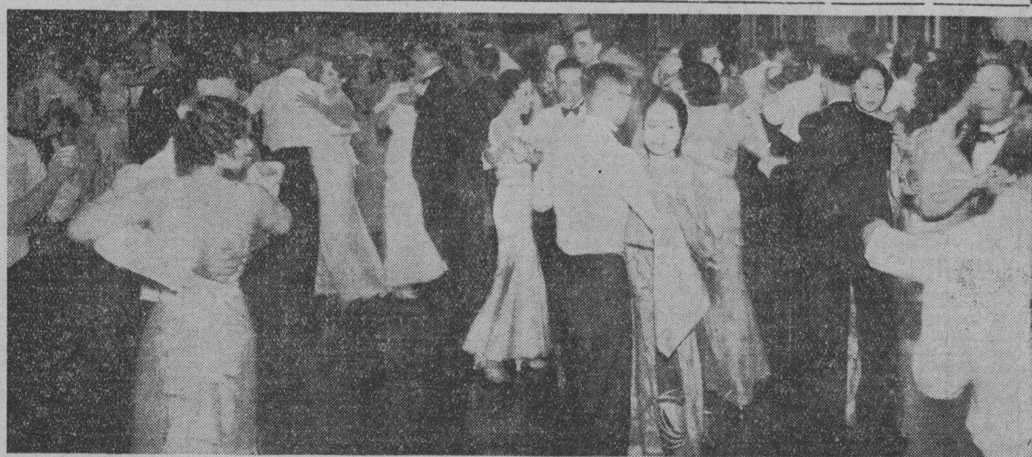
Un instante grafico del tradicional baile de Nochebuena de la Sociedad Tiro al Blanco de Manila. Después de la Misa de Gallo, la fiesta se reanuda hasta las dos y media del día siguiente, diciembre 25.

Desde las 9:00 p. m. hasta las dos y media de la mañana del 25 de Diciembre la elegante casa-club de la Sociedad Tiro al Blanco de Manila en Santamesa fue escena de un alegre y espléndido acontecimiento cosmopolita celebrado con ocasión de la Nochebuena. Este tradicional baile del Tiro al Blanco atrajo en la noche del 24 una concurrencia