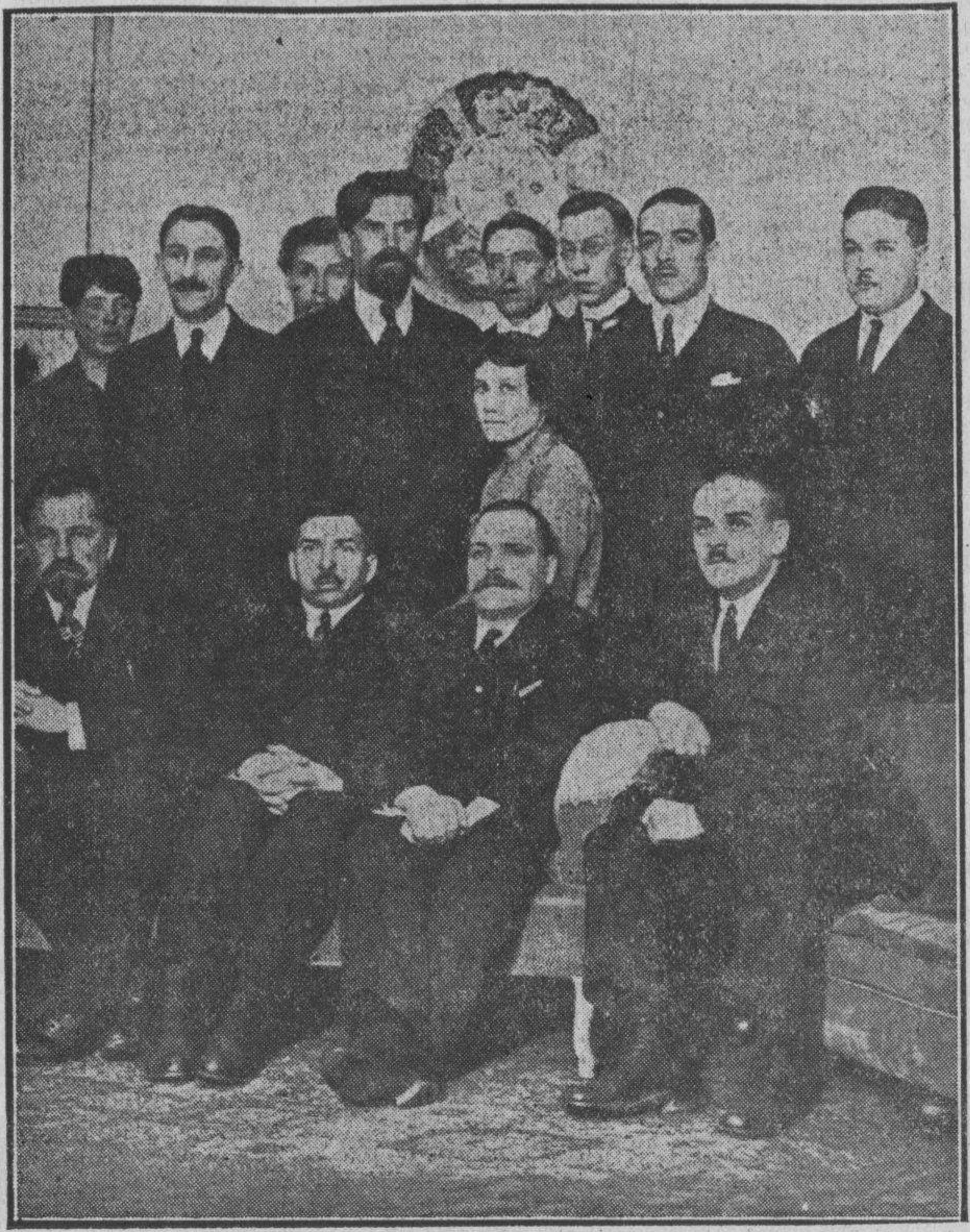
Los delegados de la República de los Soviets, que después de la Conferencia Anglo-Rusa, celebrada en el Ministerio de Negocios Extranjeros de Londres, vuelven a su país.

El símbolo de este período abyecto, de este período en que Barcelona no ha tenido política y ha estado a punto de convertirse en un paraíso— un paraíso con detonaciones—, podría encontrarse en la famosa obra de la Exposición de Industrias Eléctricas. Es posible que muchos barceloneses, acompañando a algún forastero en un paseo por la montaña de Montjuich, hayan dicho también, contentando a su elogio y recordando nuestras miserias: «Sí, Barcelona sería un paraíso, si no fuese por la condenada política...»