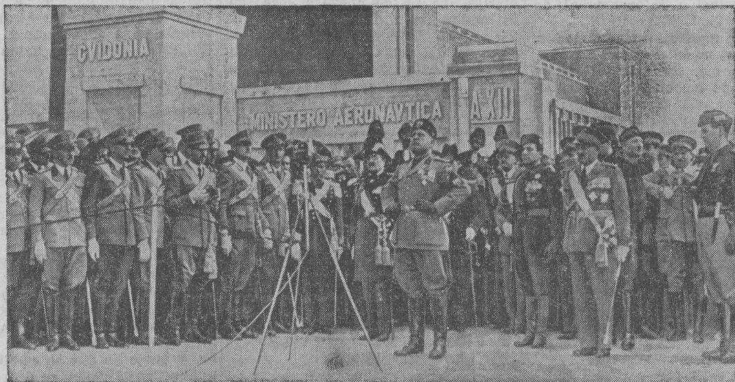
Esta fotografía corresponde a la inauguración de la Ciudad de las Alas, Gudonia, situada a 20 kilómetros de Roma, acogimiento gigantesco de millares de aeroplanos de guerra, italianos. Gudonia ha tomado el nombre de un célebre aviador que se distinguió extraordinariamente durante la guerra, muerto recientemente al entrar en barrena el aparato que tripulaba. En primer término, Mussolini pronunciando el discurso inaugural ante lo más florido de las especialidades aviatorias de Italia. Gudonia ha sido levantada en poquísimo tiempo.