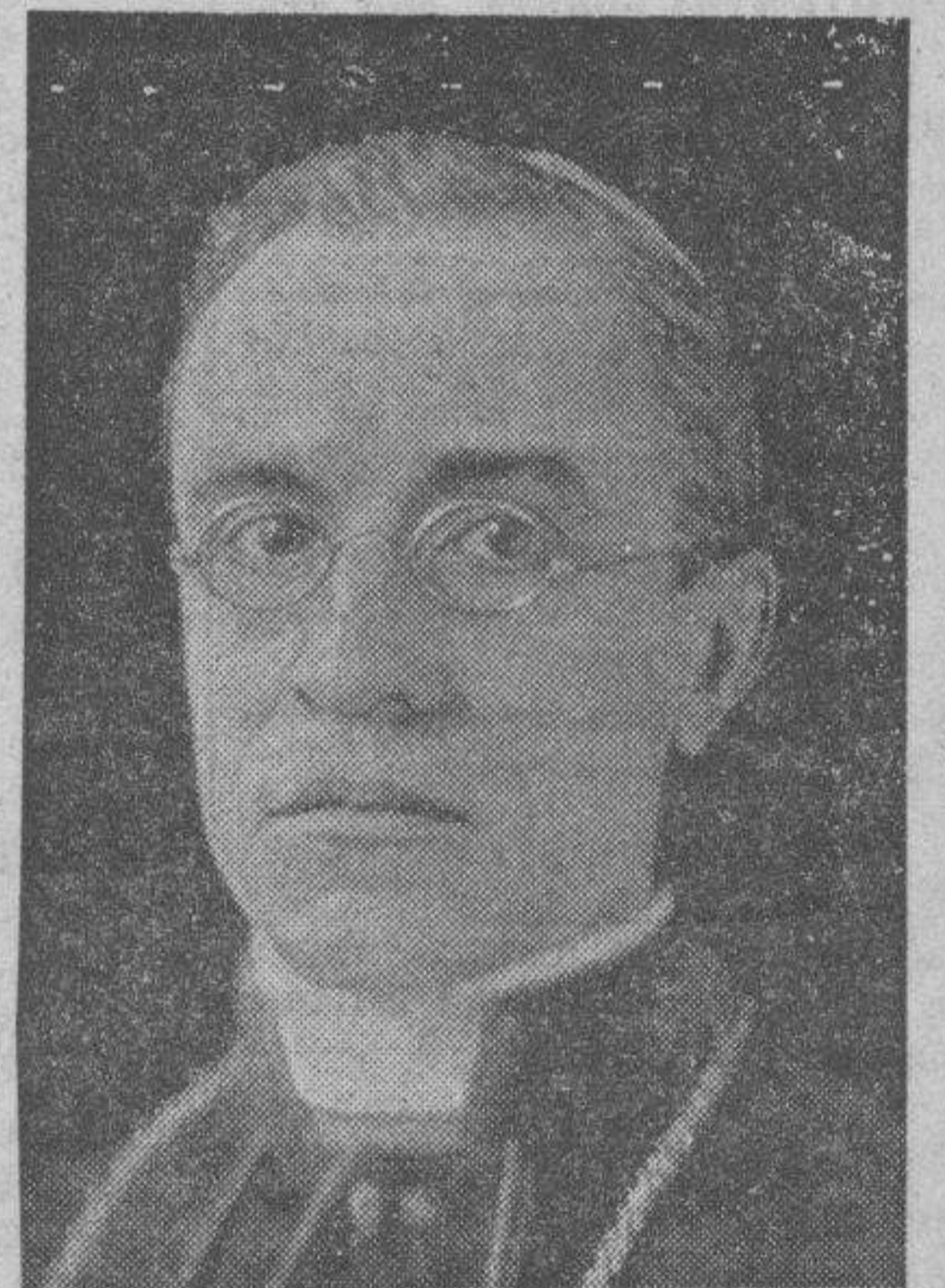
La muerte del cardenal Gasparri planteó un problema de capacitación para ocupar el responsable cargo que ocupaba el fallecido. Por fin, después de varias dilaciones, ha sido nombrado el cardenal Pacelli, cuya es la fotografía que publicamos.

Nos dijeron que ha regresado el presidente. Debemos esperar.