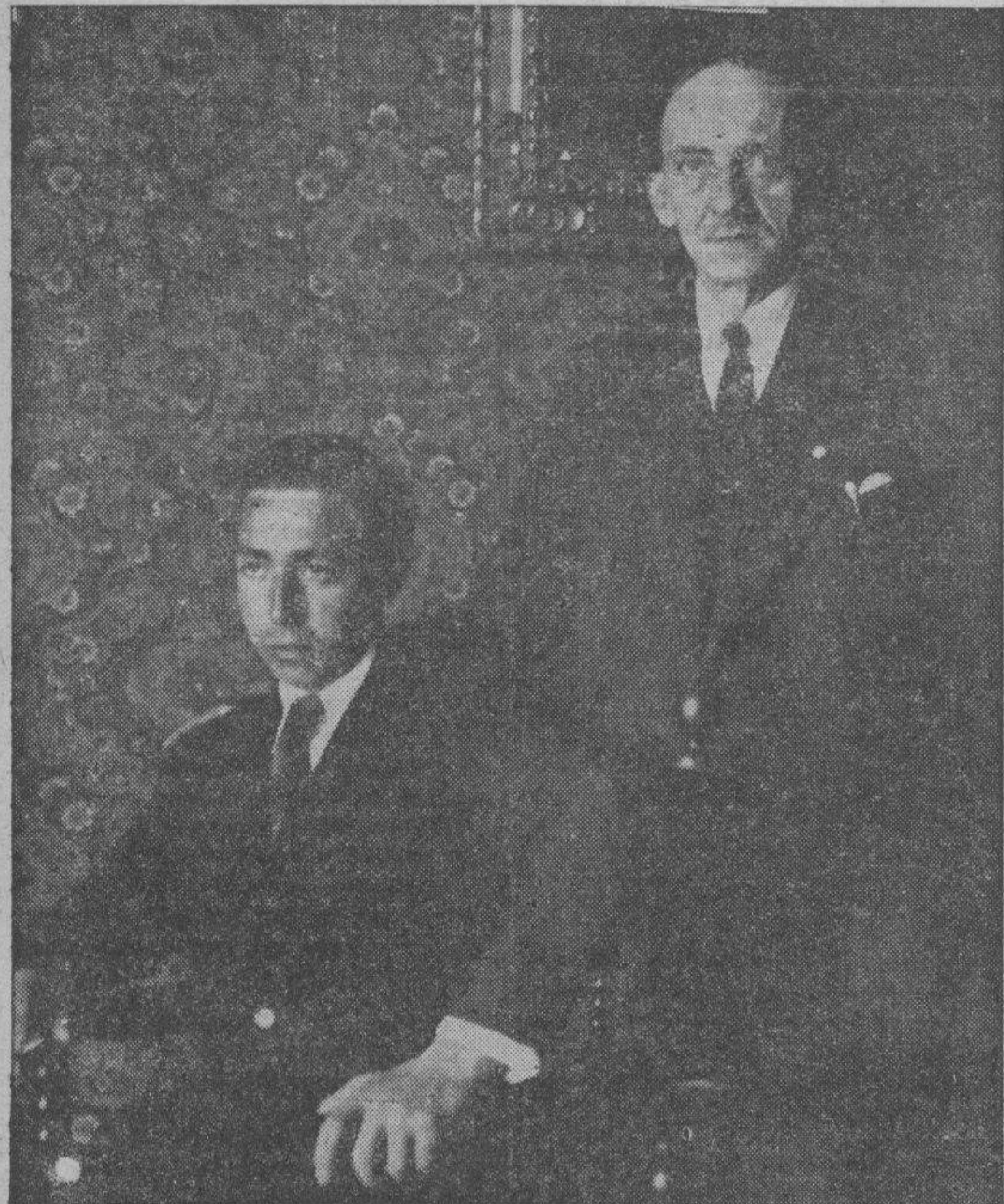
Un gran pianista que encontró un noble protector. Diga que ha encontrado un ser extraordinario. Porque el desinterés y la nobleza habían huido de la Tierra, hasta que ahora reaparecieron en forma de hidalgo mecenas de un músico.