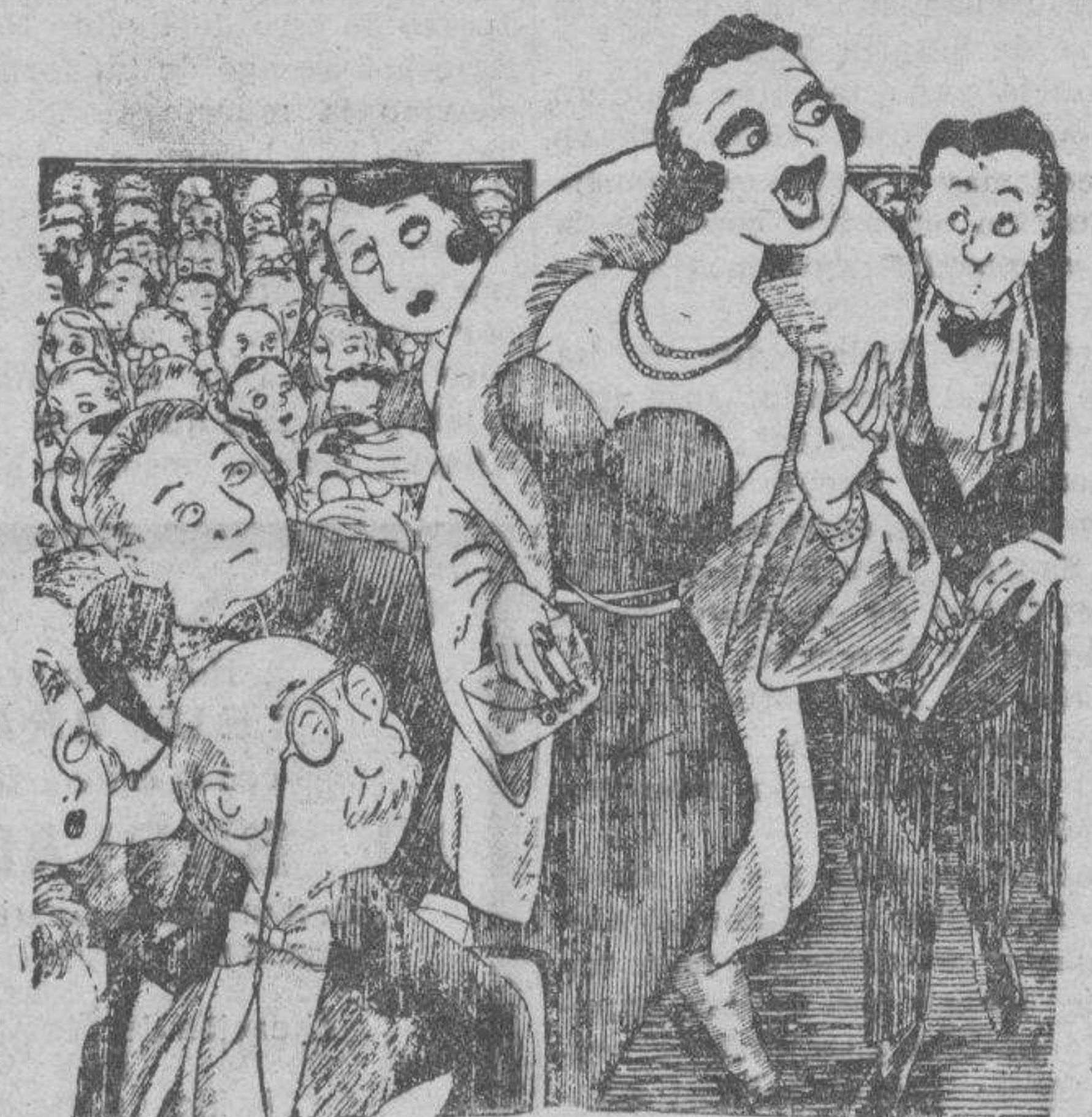
TARDE Y CON DAÑO

—Créame usted: es una cosa que me espanta llamar la atención cuando llego tarde al teatro. (De "Life".)