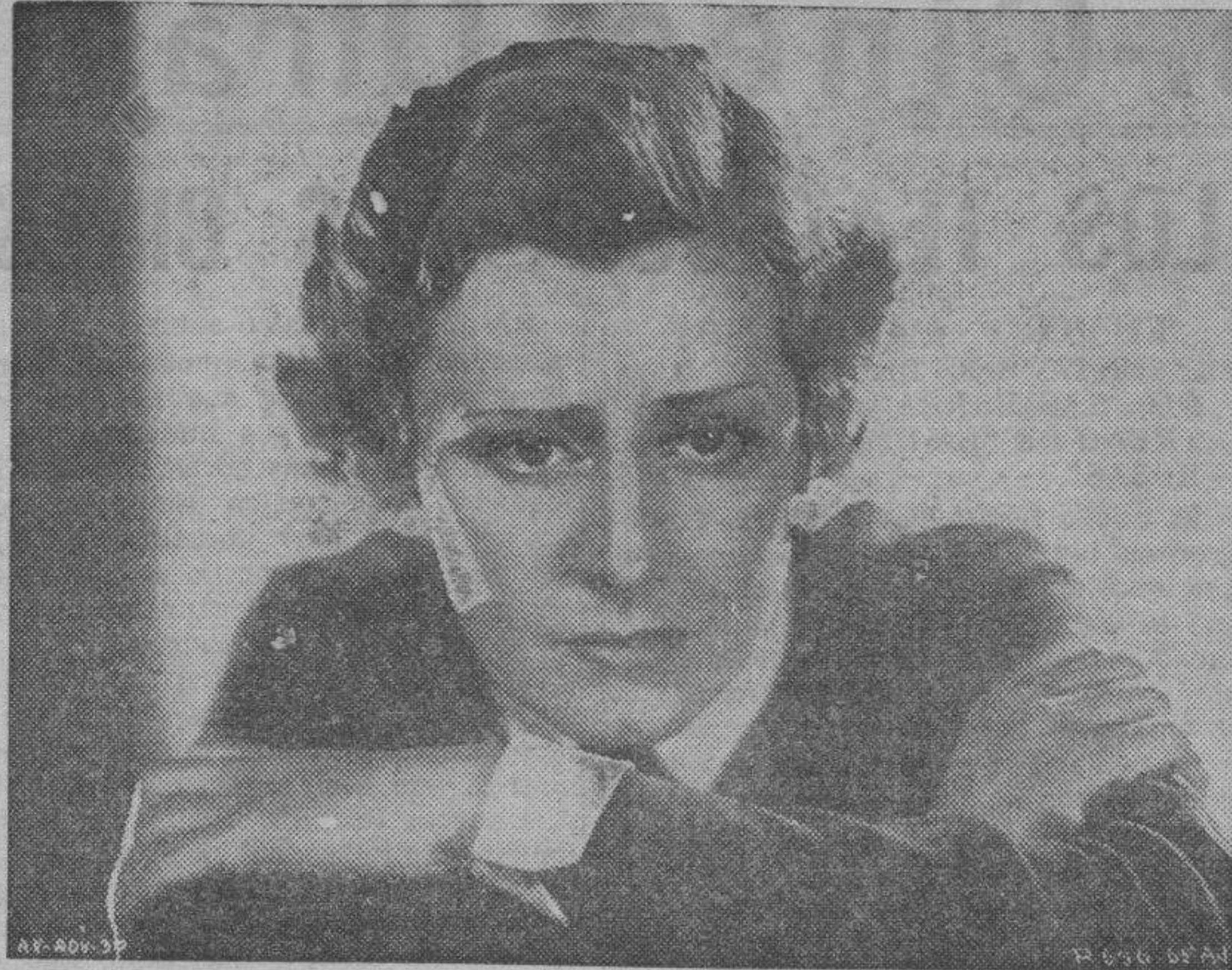
Irene Dunn, protagonista de "Amor sublime".

Muy otra debe ser la posición del crítico ante la película objeto de su crítica: posición de equilibrio, de justicia y de rectitud de juicio. Tan distante ha de estar del elogio a todo pasto, sin medida ni rasero, como de la disección despiadada y cruel, ya que no hay obra humana perfecta ni a la cual no se le puedan sacar media