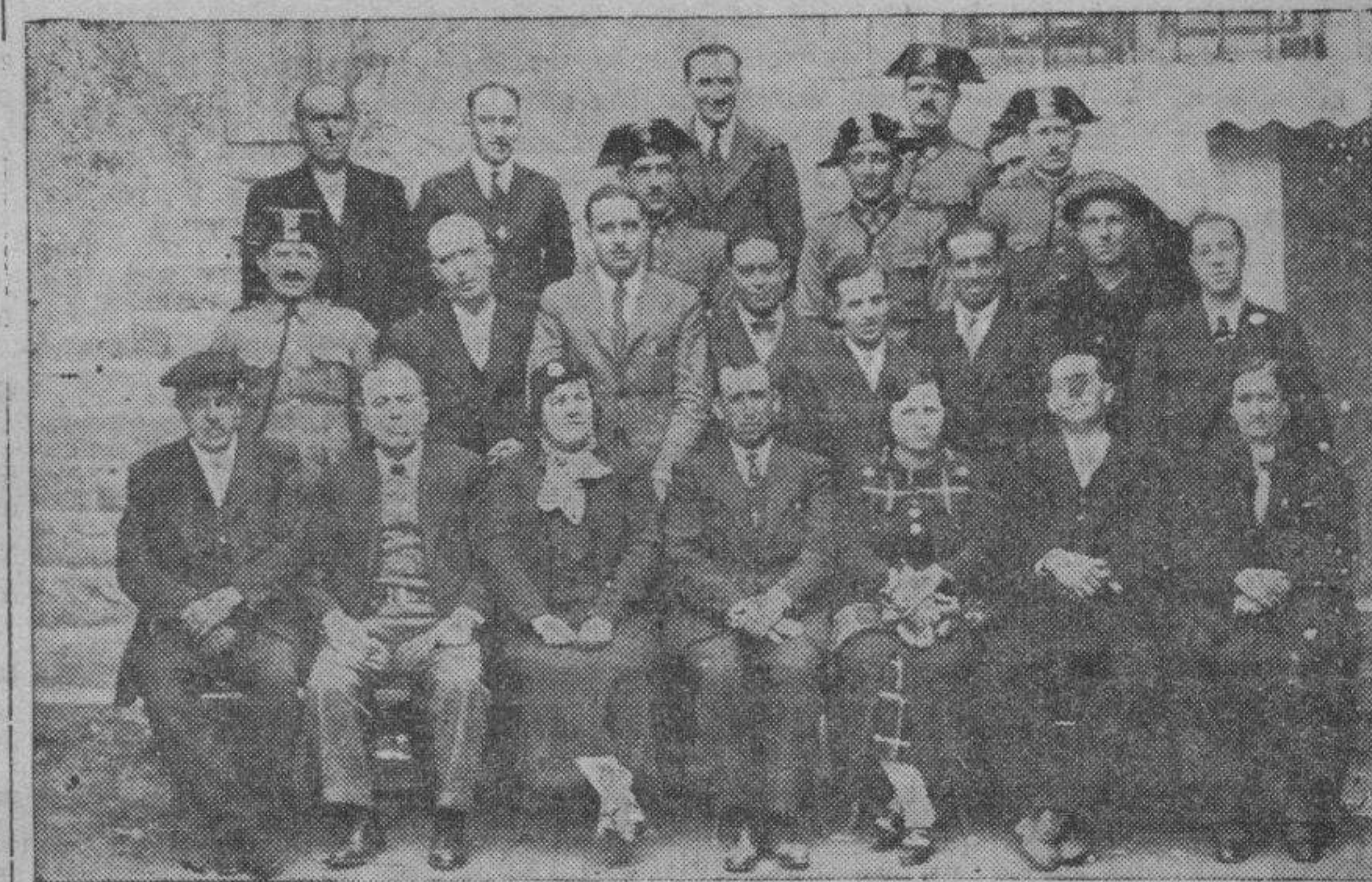
MARIA DE HUERVA. — Señores maestros y autoridades que presidieron la Fiesta del Libro, el día de San José.