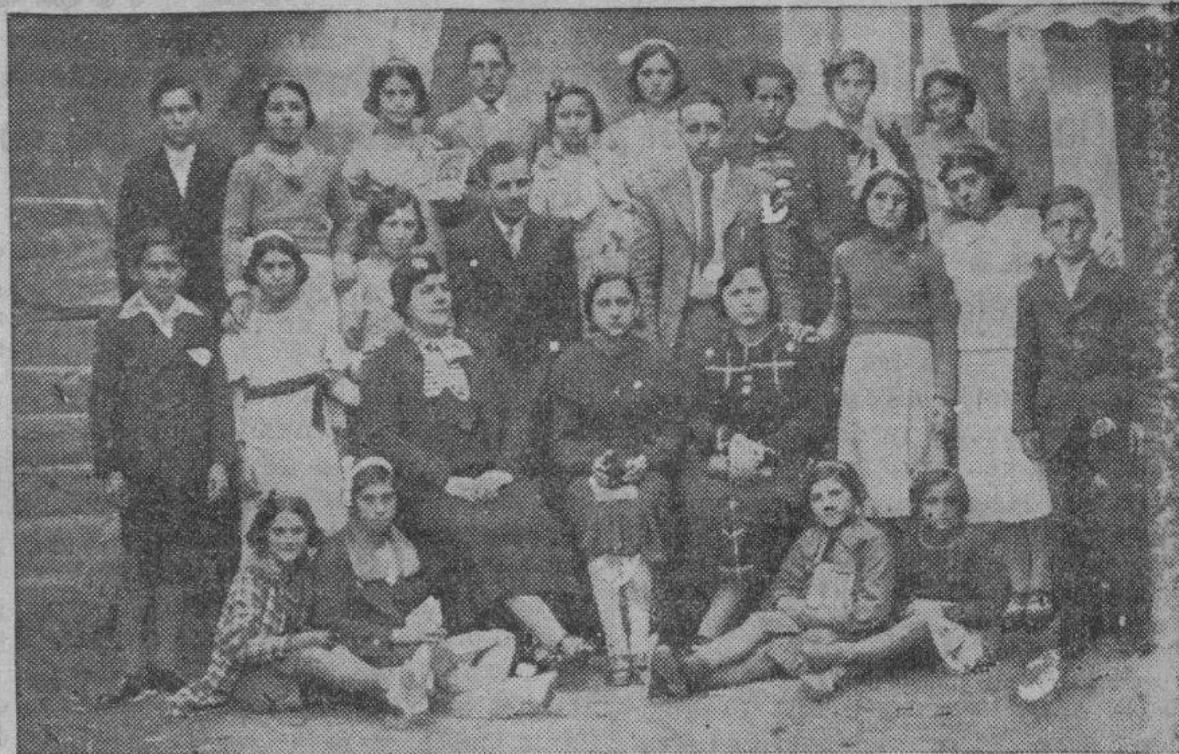
MARIA DE HUERVA. — Las niñas y niños de las escuelas nacionales que leyeron preciosas poesías y desarrollaron muy hermosos trabajos, acompañados de sus maestros.