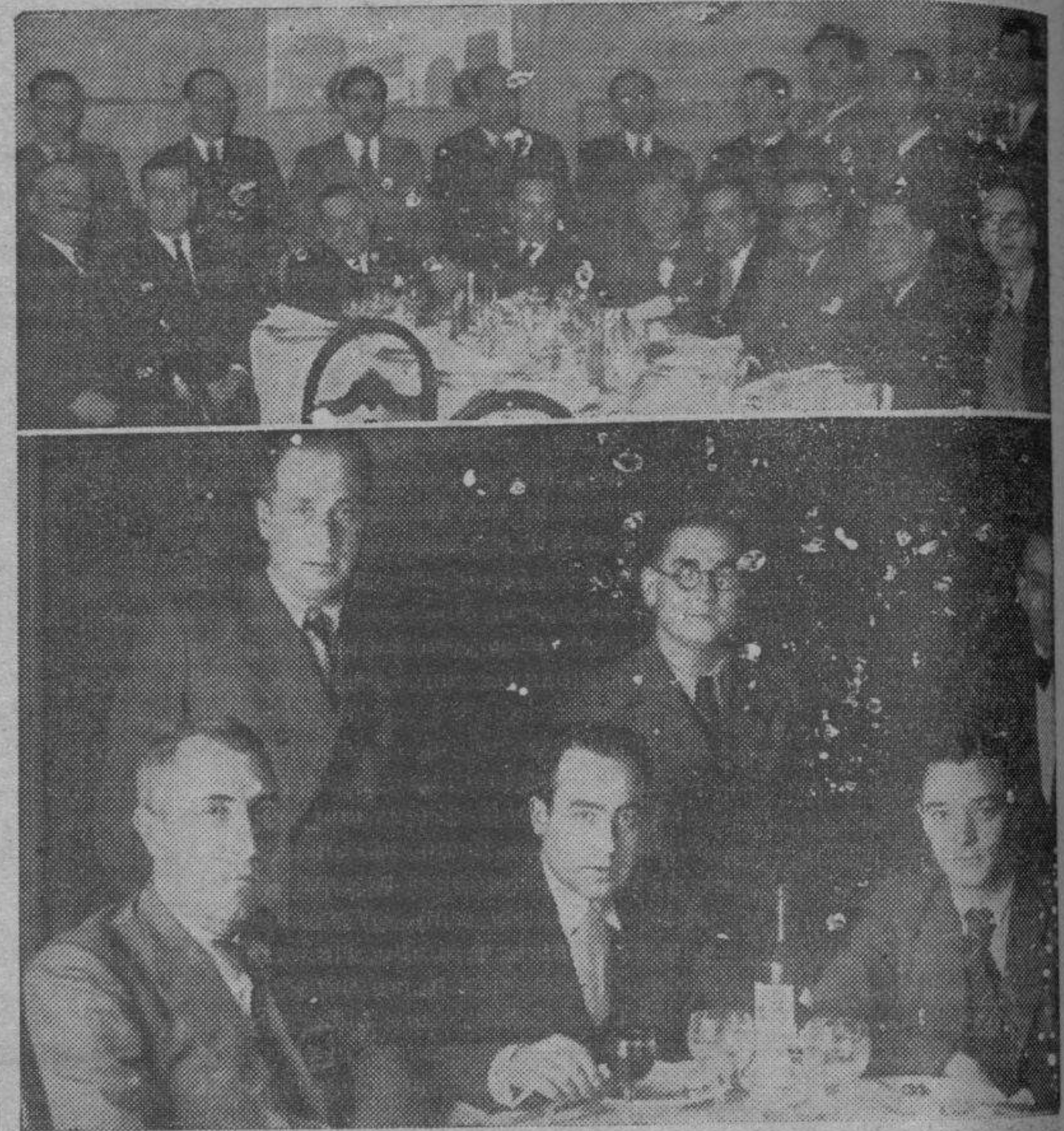
Personal de Redacción y Administración, arriba y abajo, respectivamente, reunidos para recibir el agasajo del Consejo de Administración del periódico.